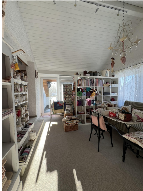
Wohnzimmer Einliegerwohnung DG