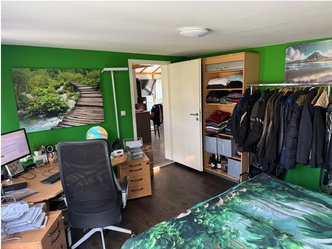
Schlafzimmer / Büro