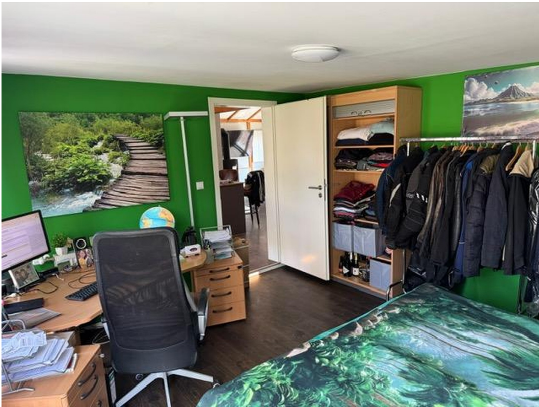
Schlafzimmer / Büro