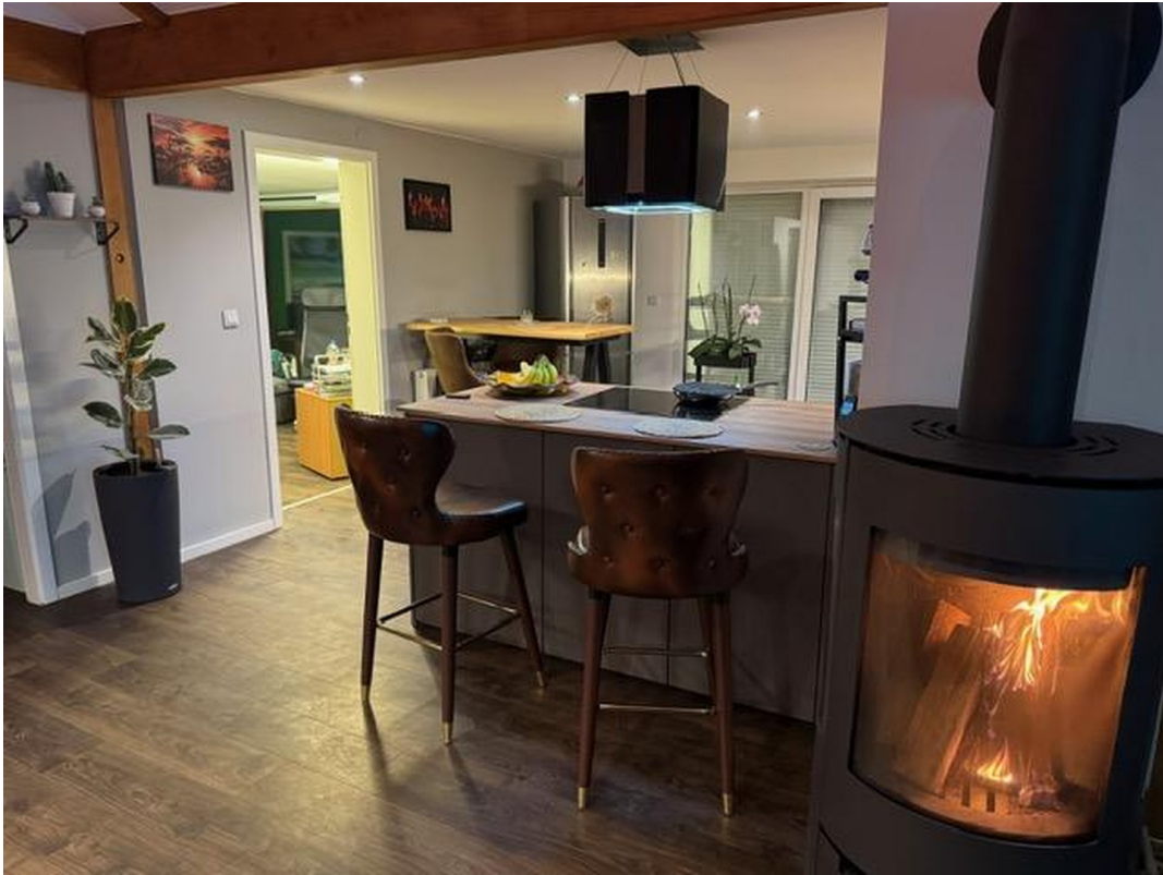
Küche / Kaminzimmer