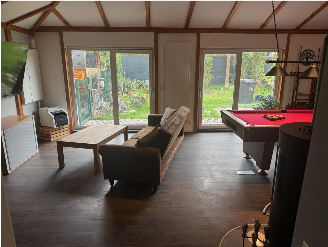
Wohn- & Billiardraum