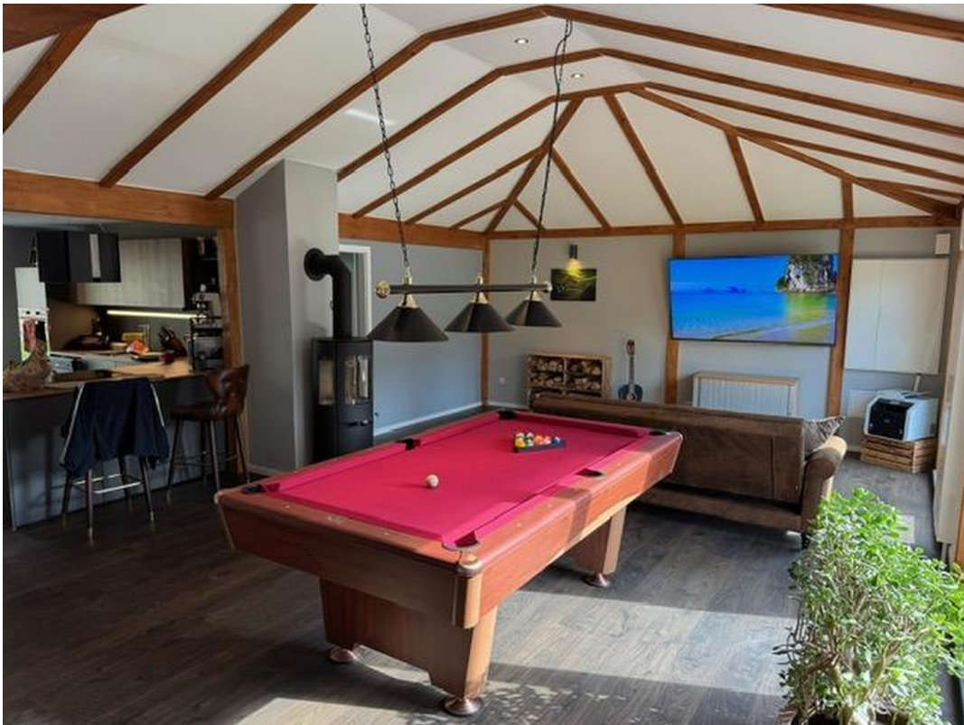
Wohn- & Billiardraum