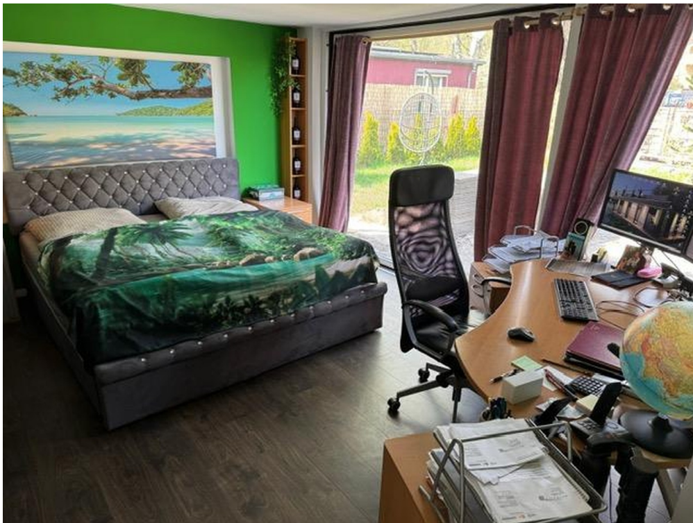
Schlafzimmer / Büro