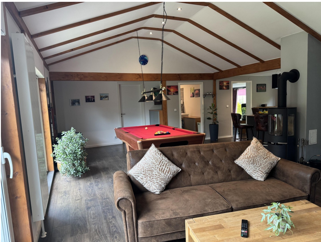
Wohn- & Billiardraum