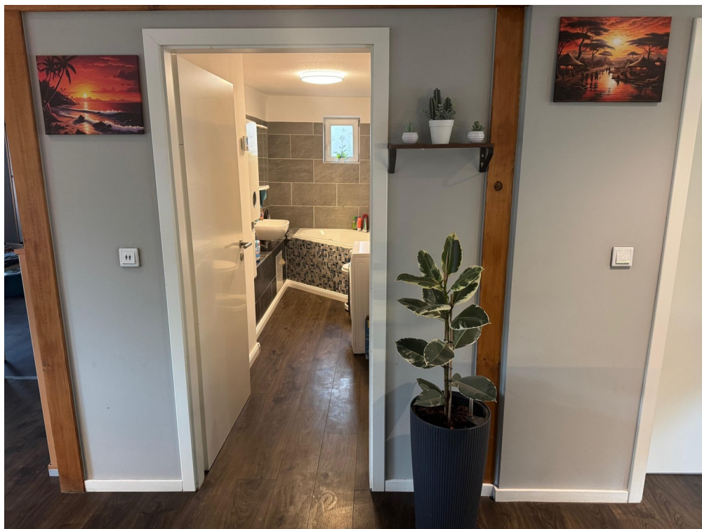
Blick vom Billiardraum ins Bad