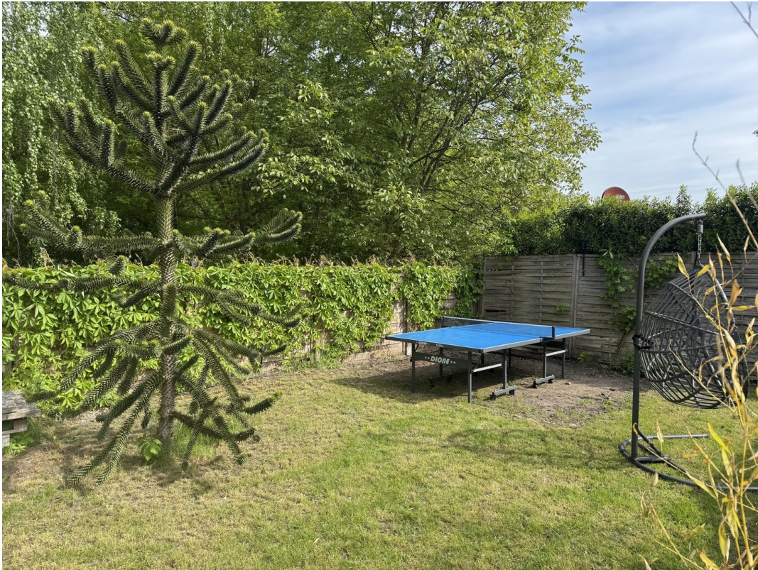
Ansicht vom Garten hinten