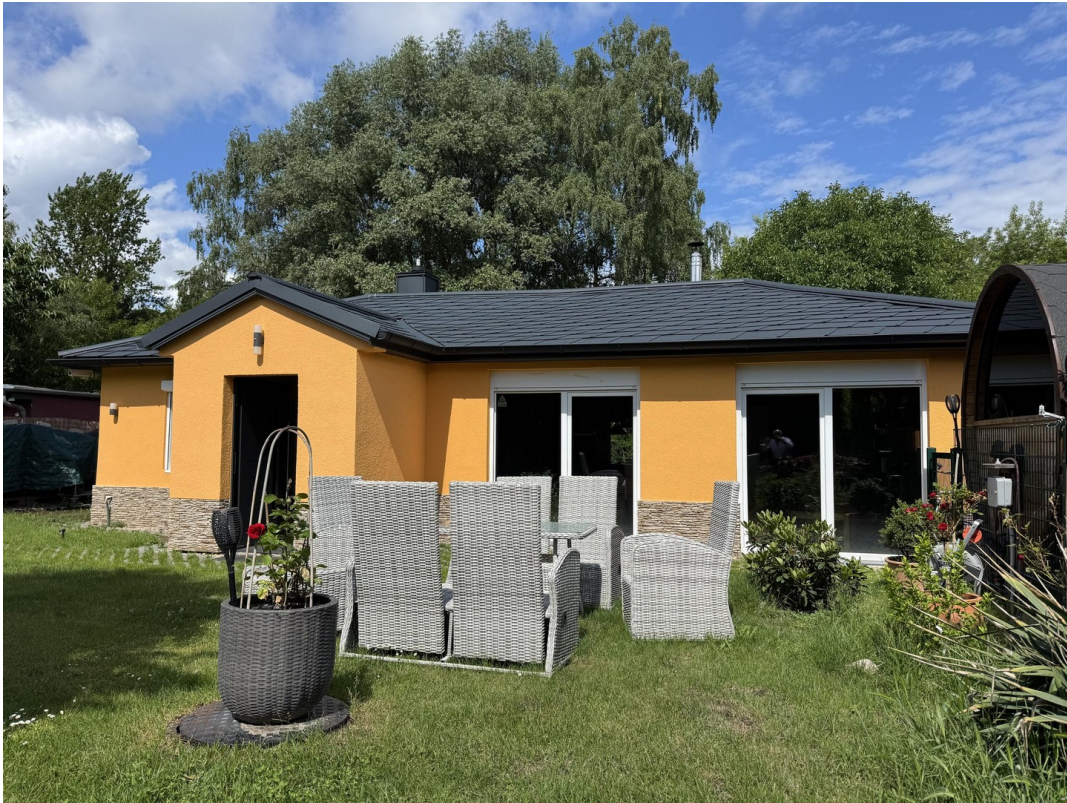
Ansicht vom Garten