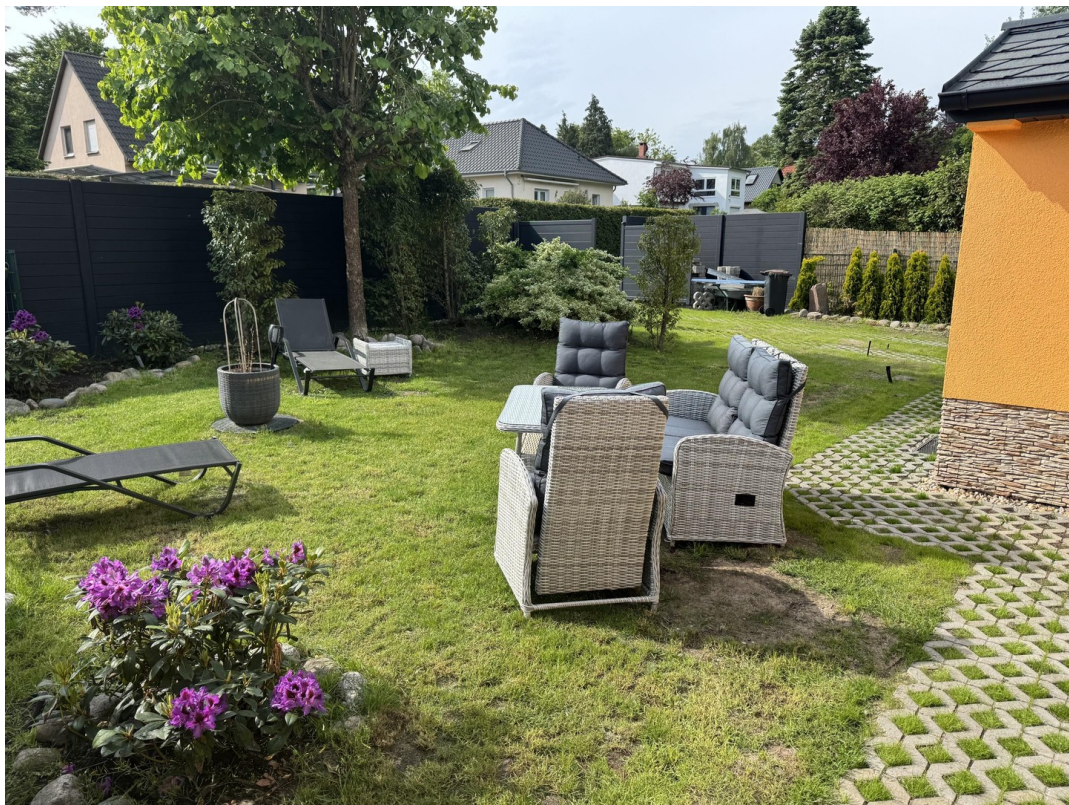
Ansicht vom Garten vorne