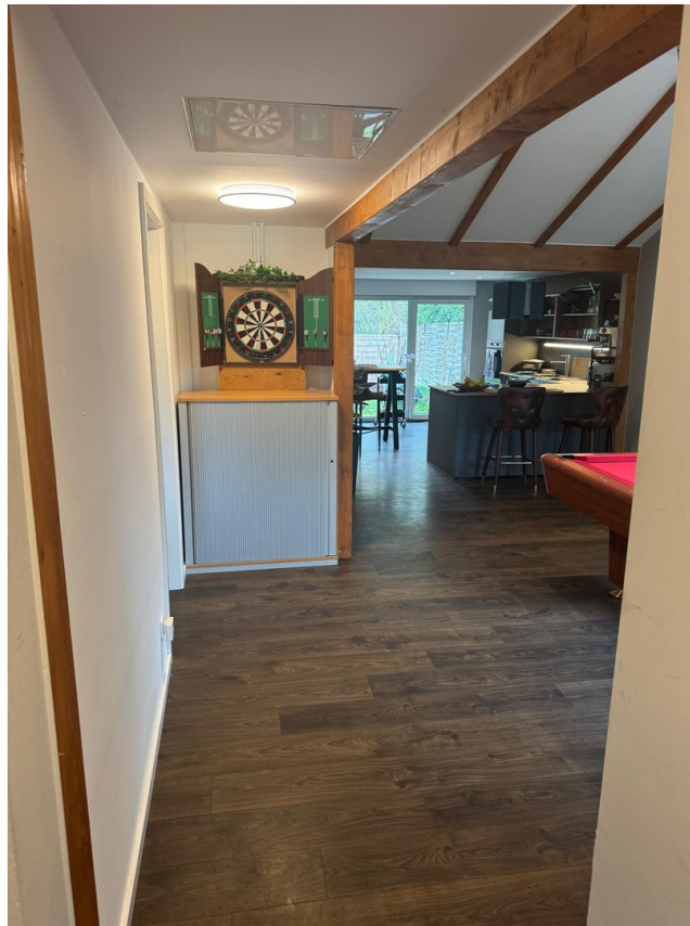
Wohn- & Billiardraum