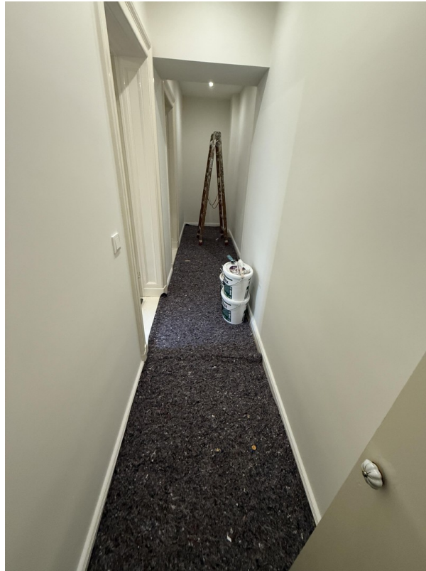
Flur und Eingangsbereich