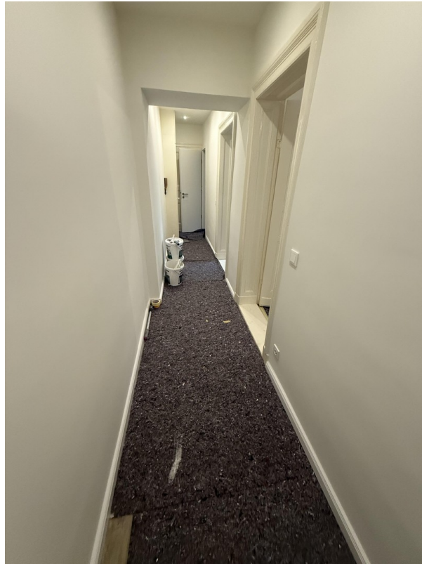
Flur und Eingangsbereich