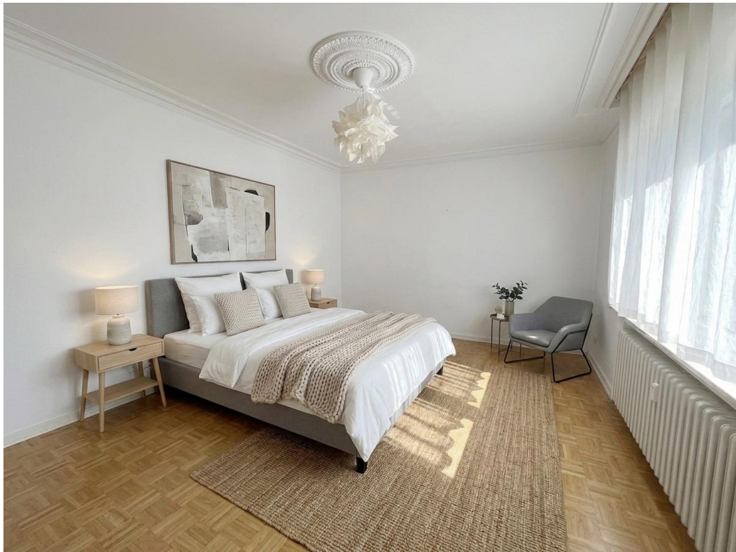
Schlafzimmer KI Vorschlag