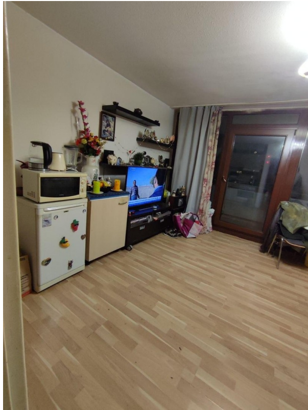
Linke Seite Wohnbereich