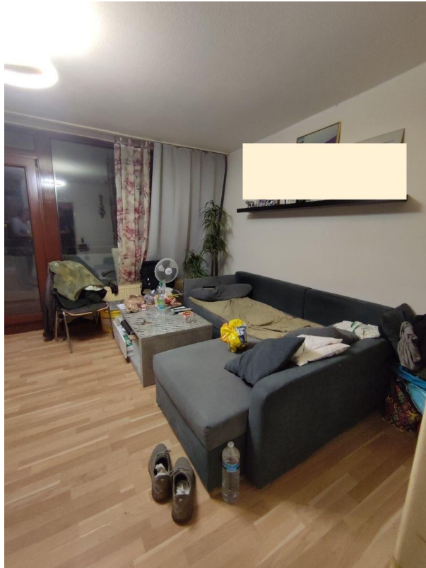
Rechte Seite Wohnbereich