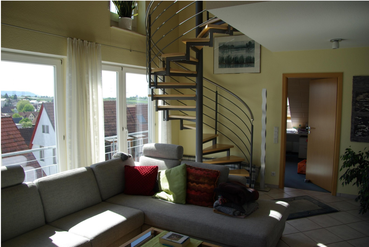
Wohnbereich und Treppe