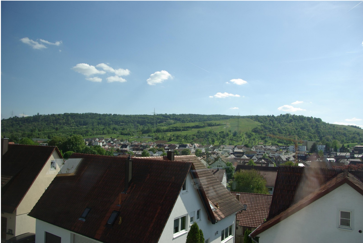
Blick auf Schurwald