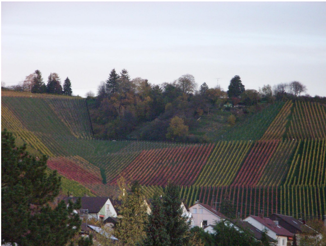
Blick auf Weinberge