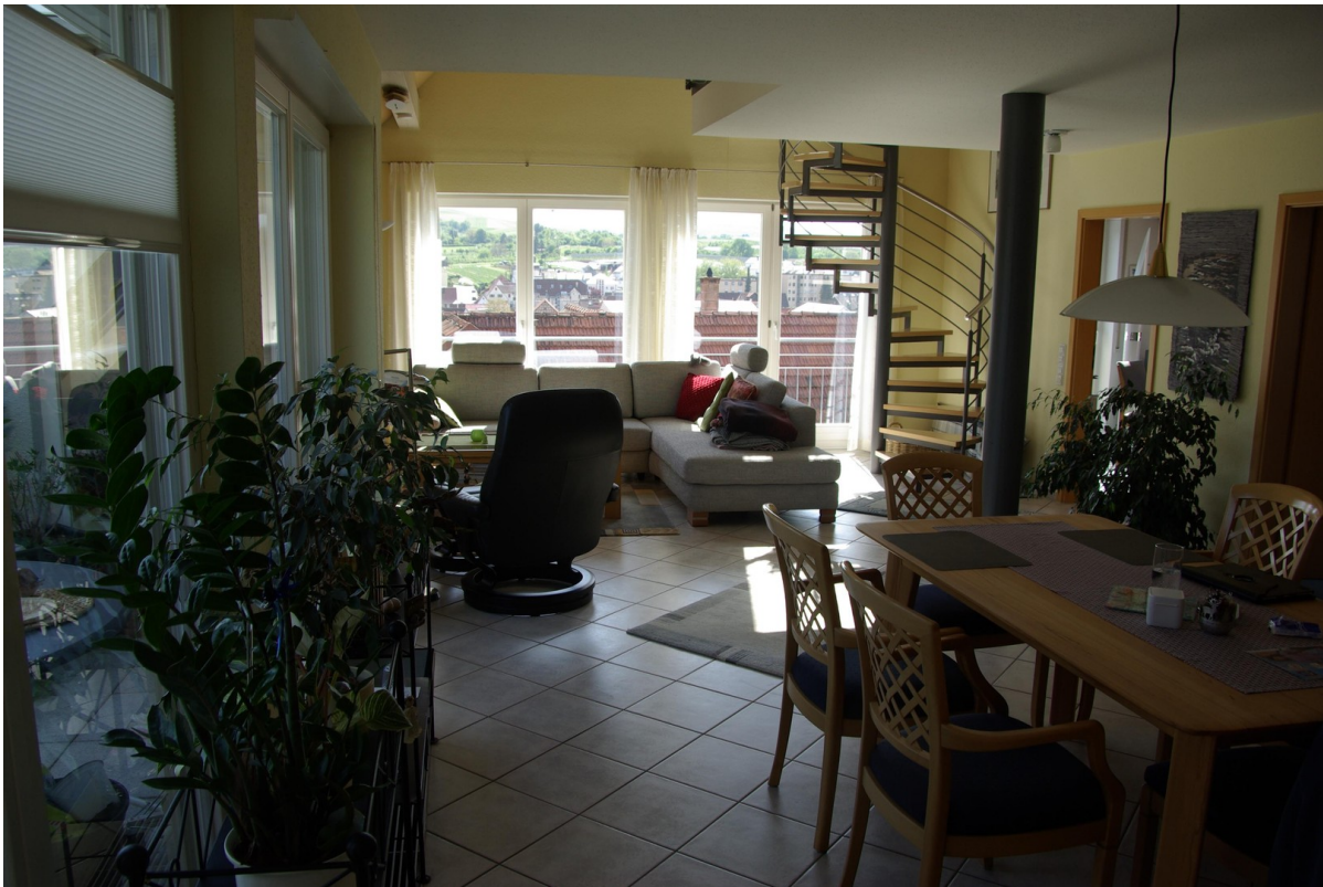
Wohn- / Essbereich