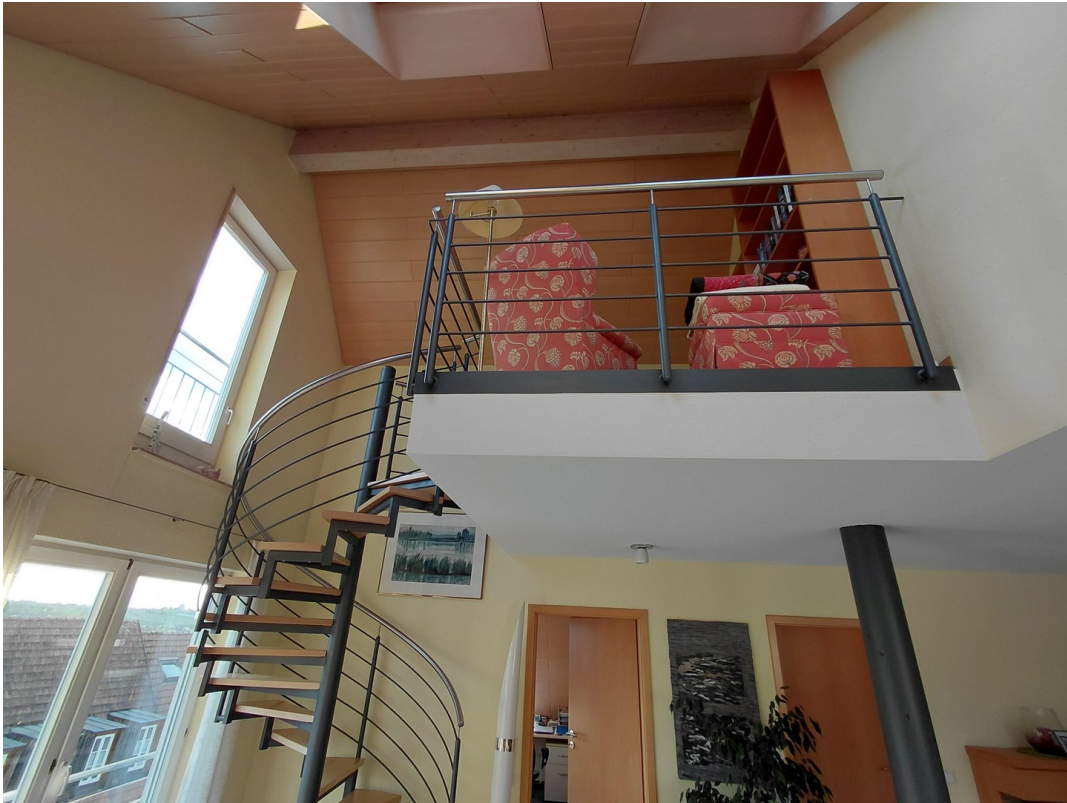
Blick zur Empore