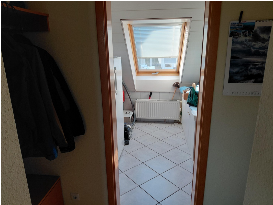
Garderobe / Abstellraum