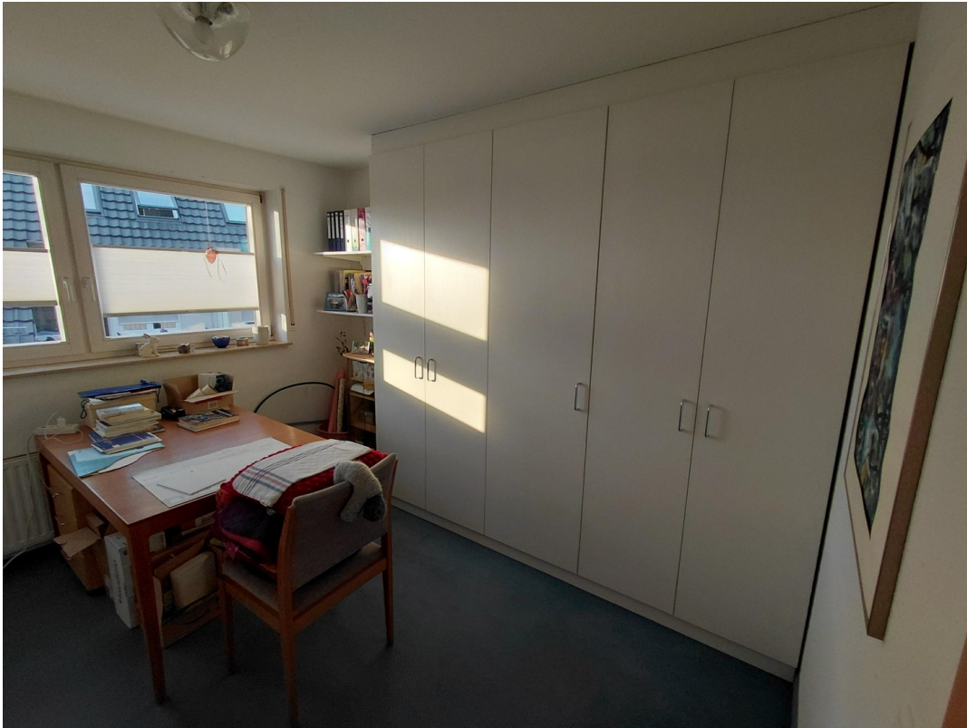
Arbeitszimmer / SZ 2