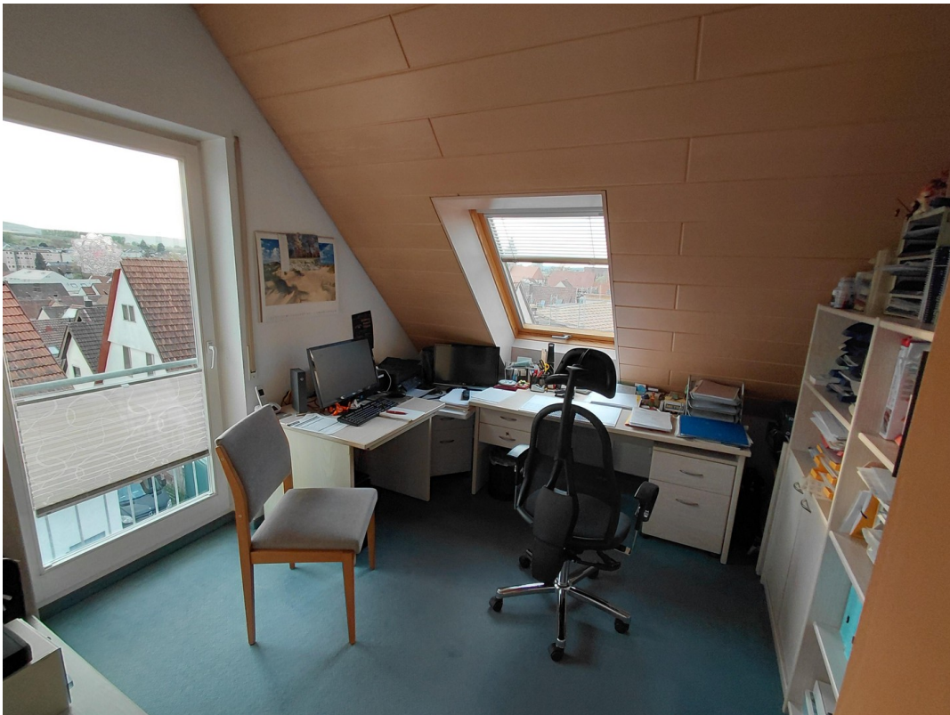
Büro / SZ 3