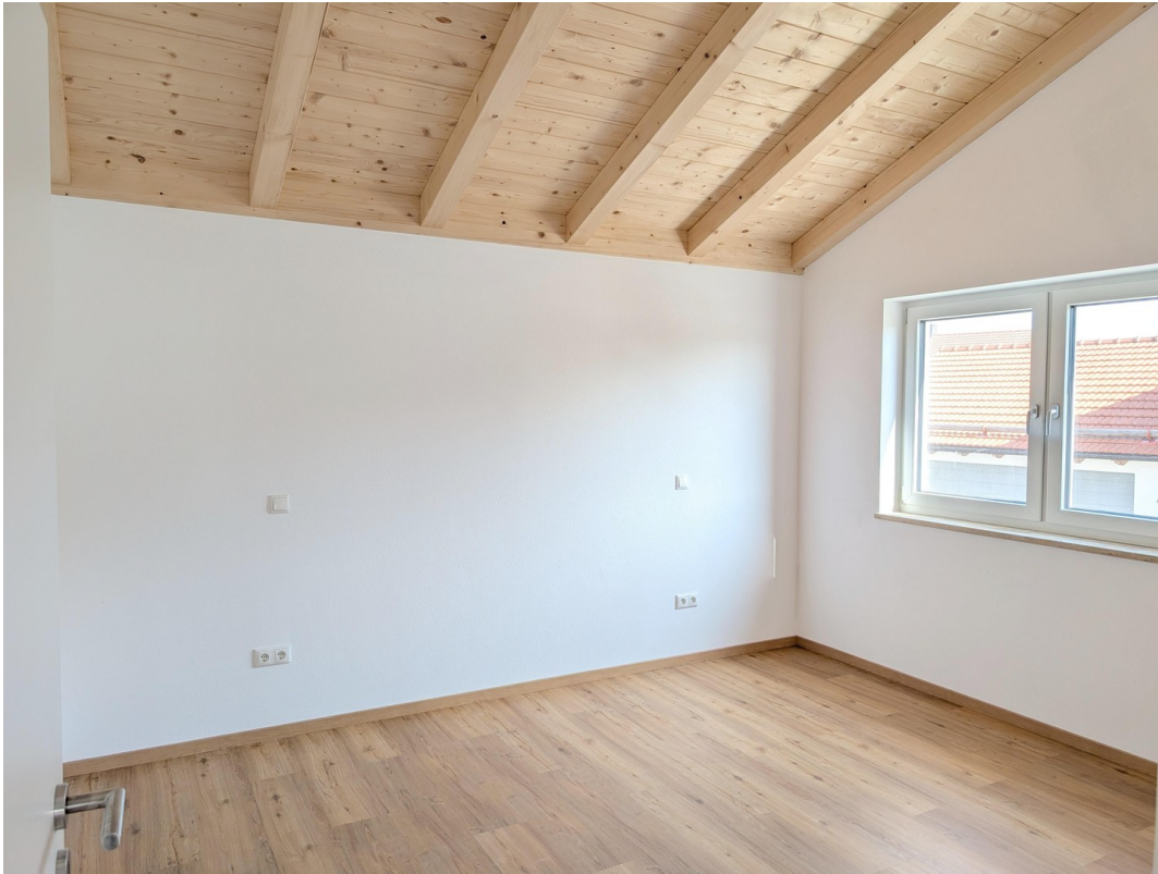
DG - Schlafzimmer