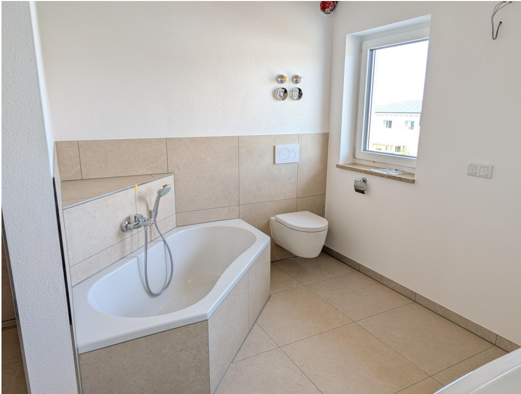
Bad - Badewanne/Toilette