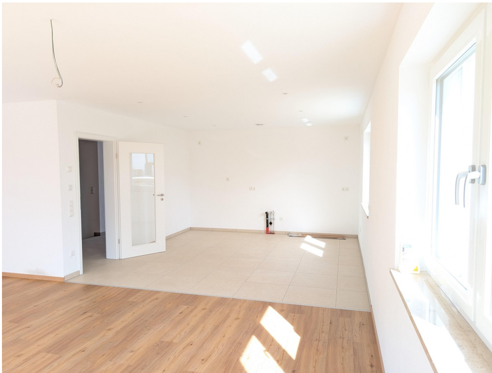
EG - Wohn-Ess-Bereich