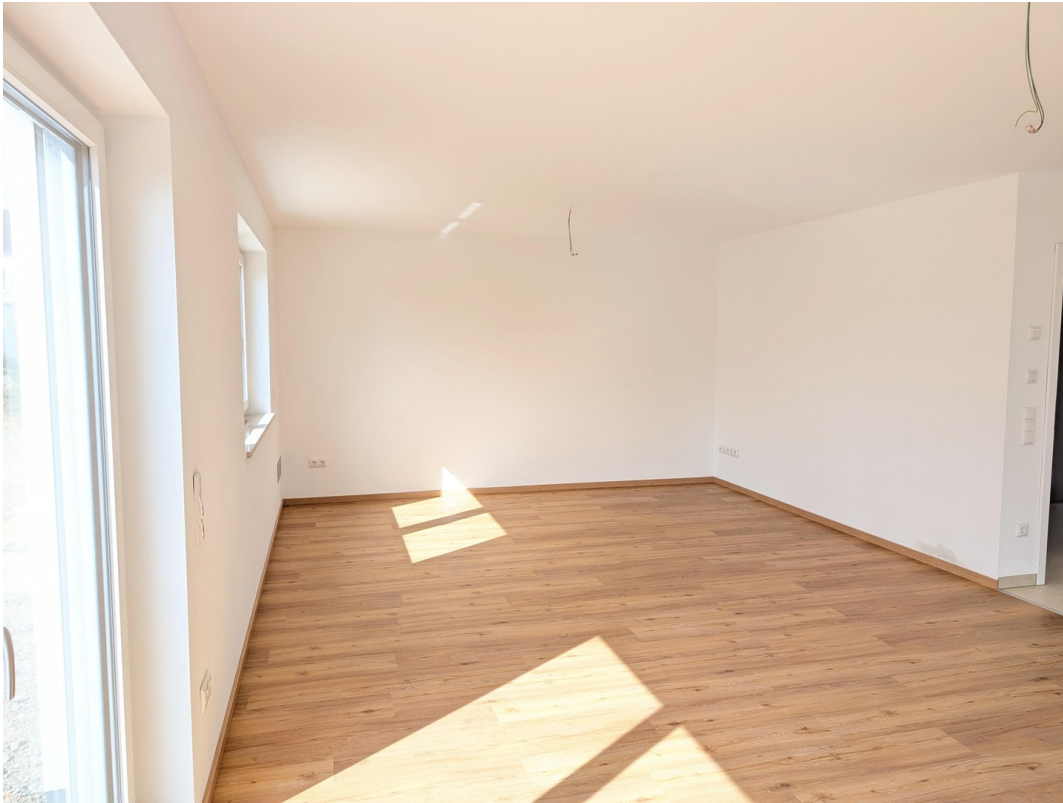
EG - Wohn-Ess-Bereich