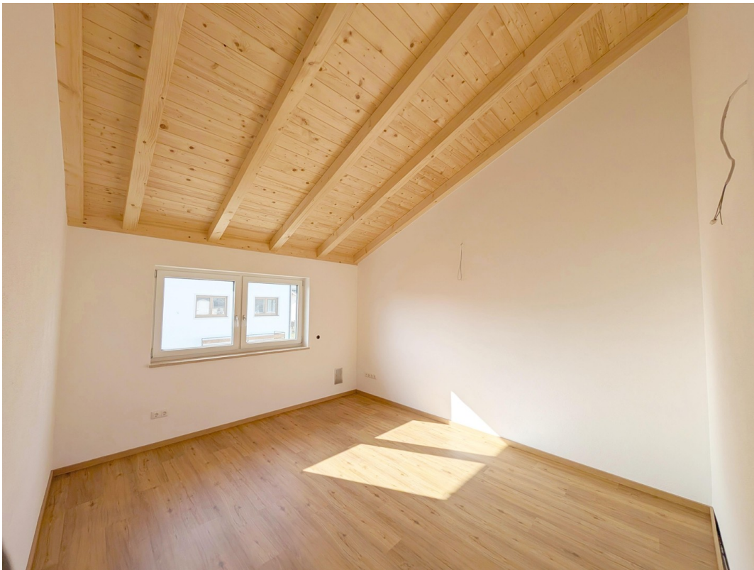
DG - Kinderzimmer - Weitwinkel