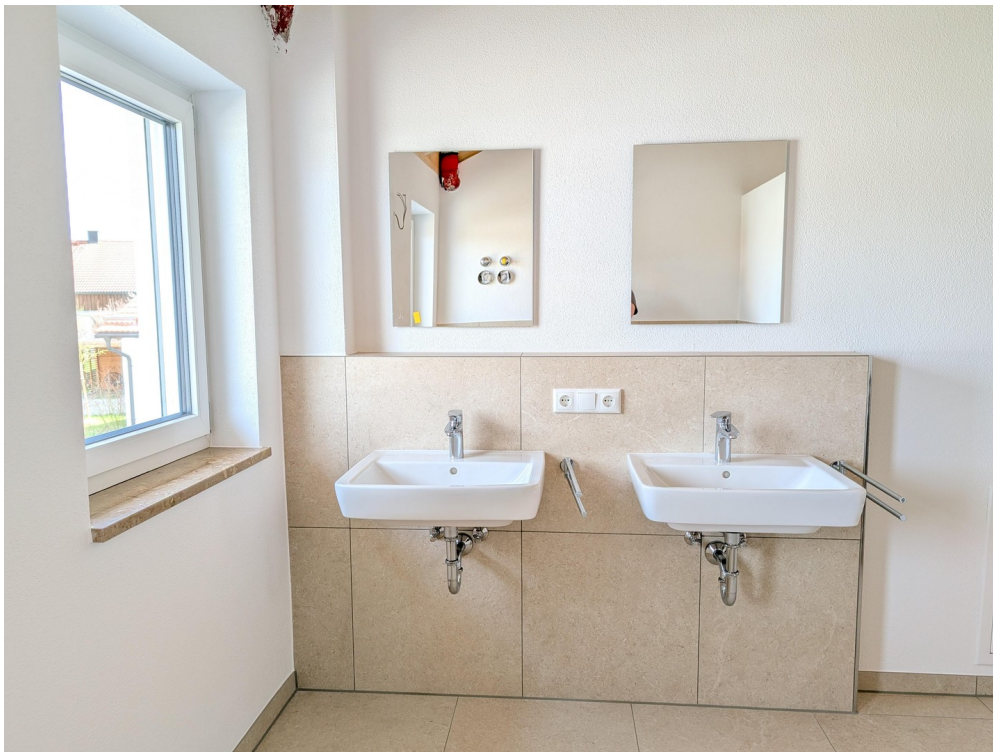
Bad - Waschbecken