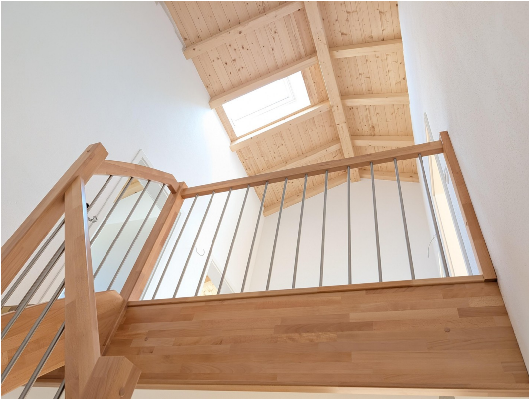
Treppe u. Dachstuhl