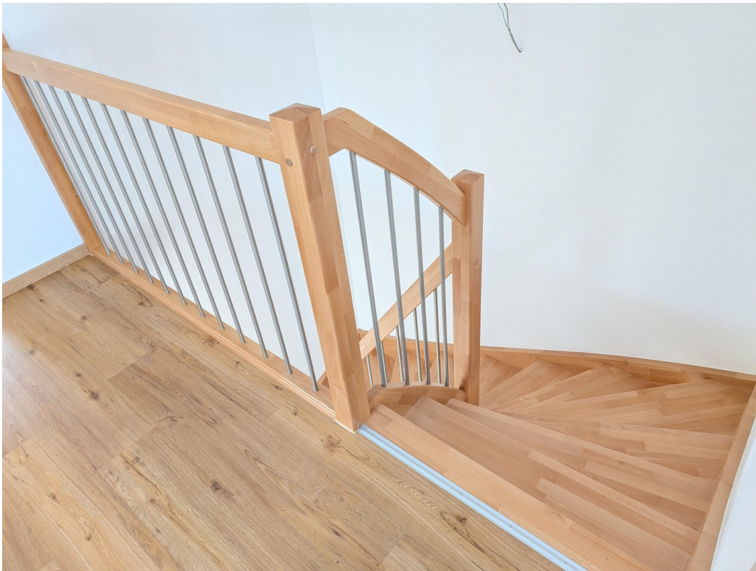
DG - Treppe