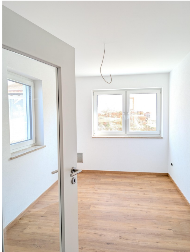
EG - HomeOffice