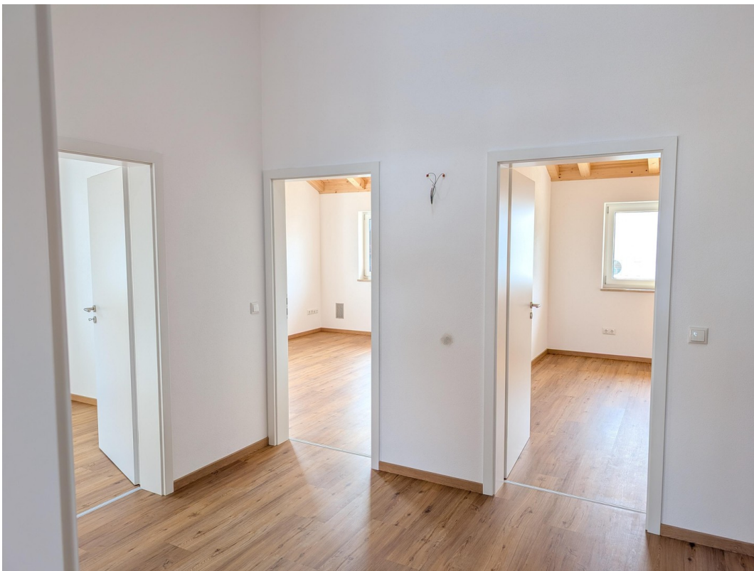
DG - Flur