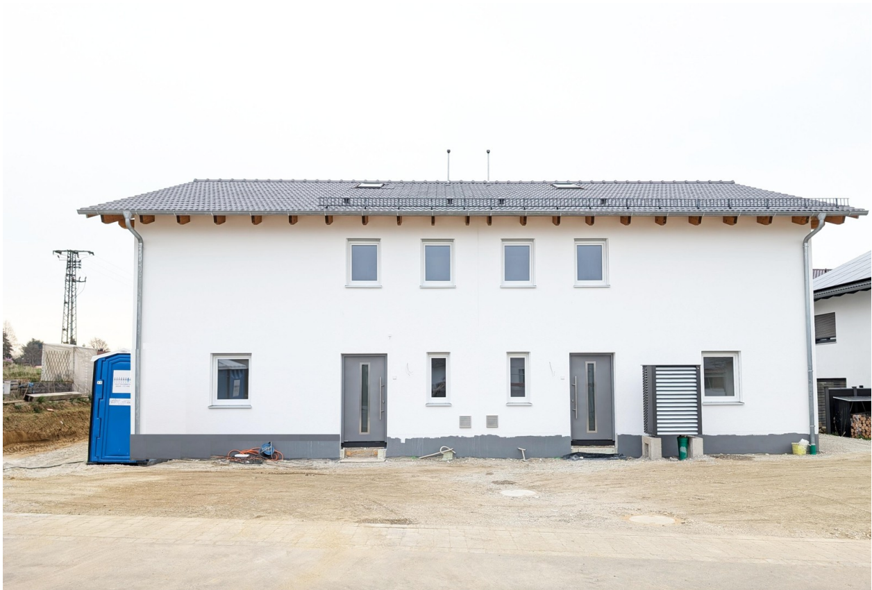
Außen - Eingang