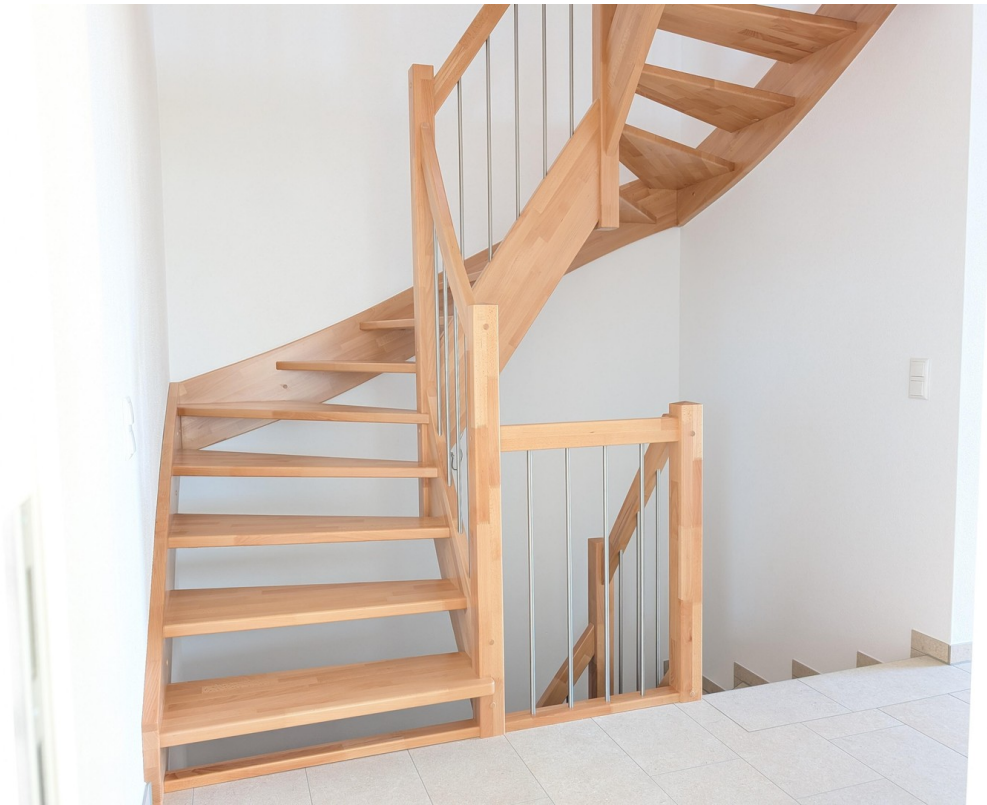
EG - Treppe