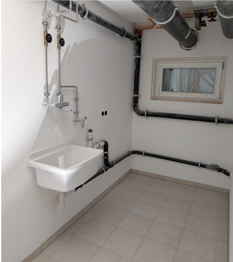
Ausgussbecken - Waschraum