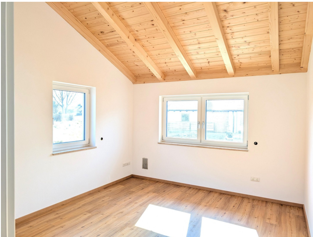
DG - Kinderzimmer