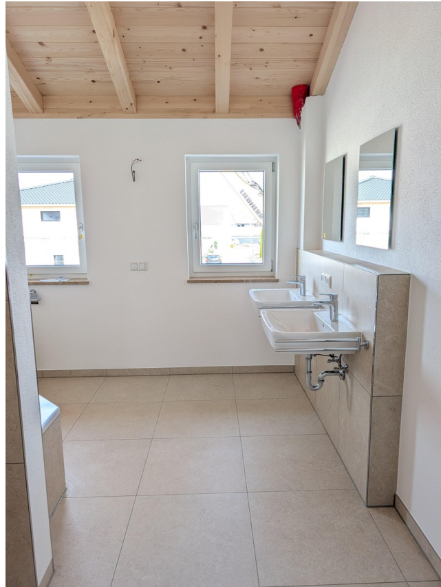
Bad - Waschbecken