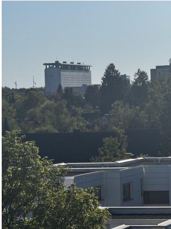
Zoom vom Balkon auf Klinik