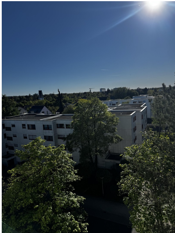
Blick vom Fenster