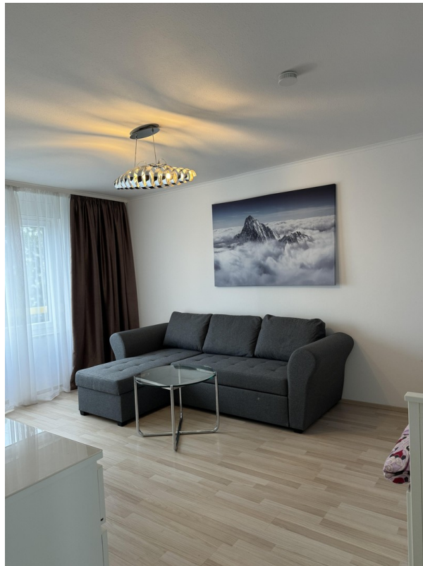
Wohn - und Schlafzimmer