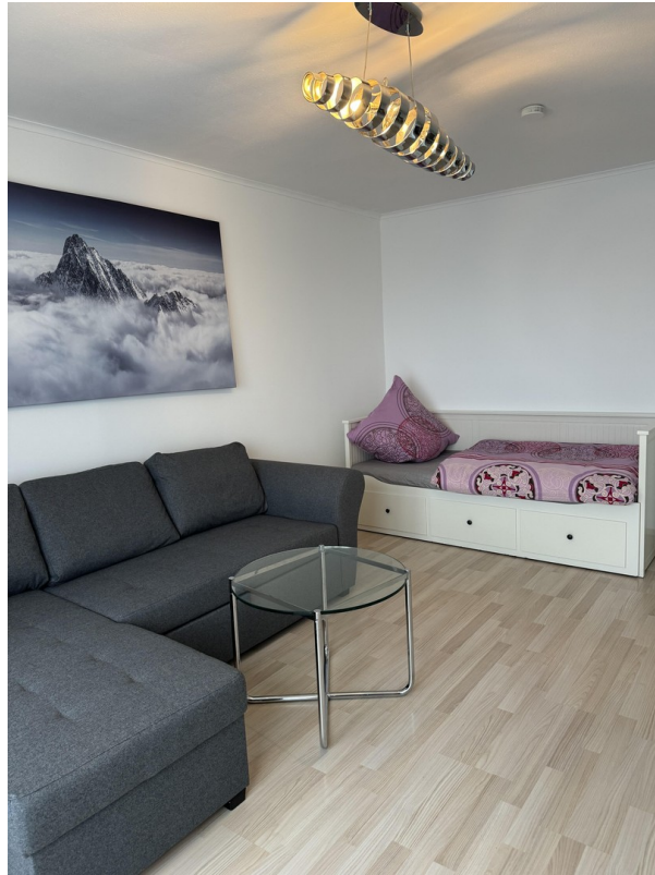
Wohn- und Schlafzimmer