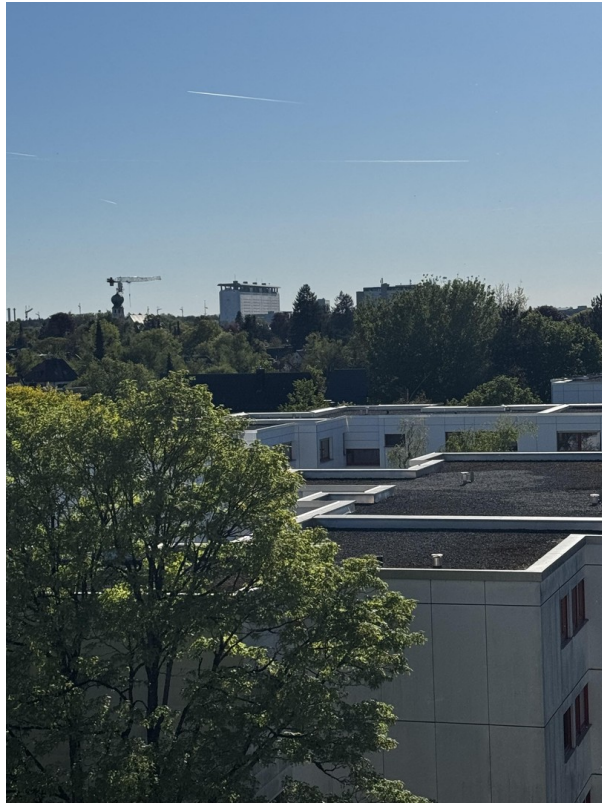
Blick vom Balkon aufs Klinikum