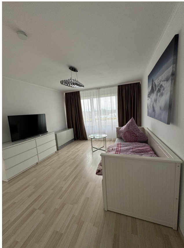
Wohn - und Schlafzimmer