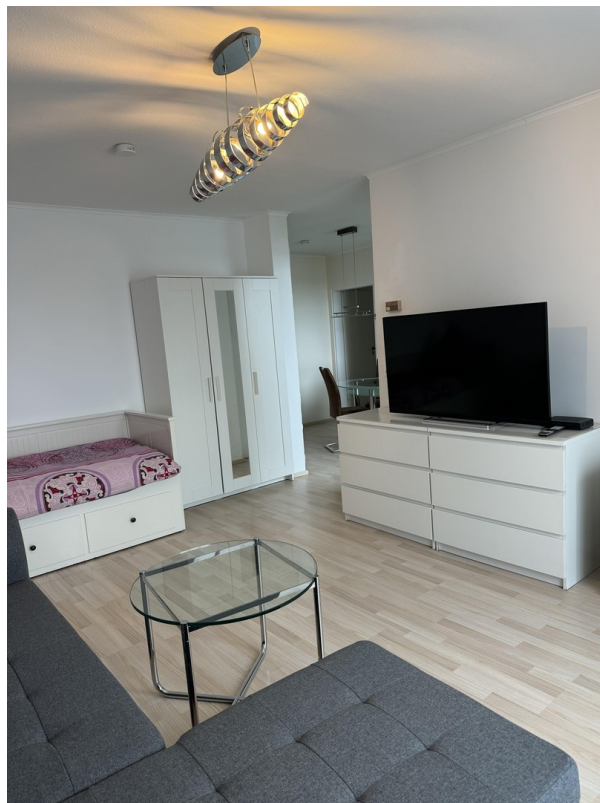
Wohn - und Schlafzimmer