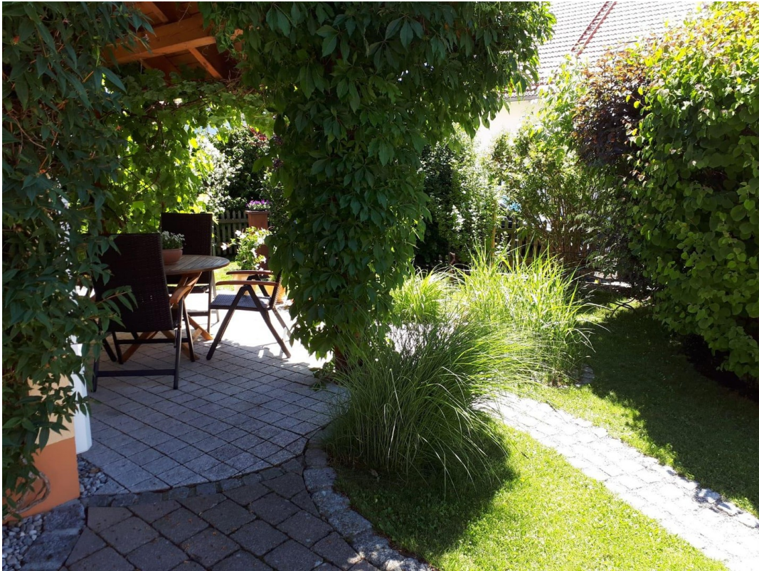
Terrasse vor dem Haus