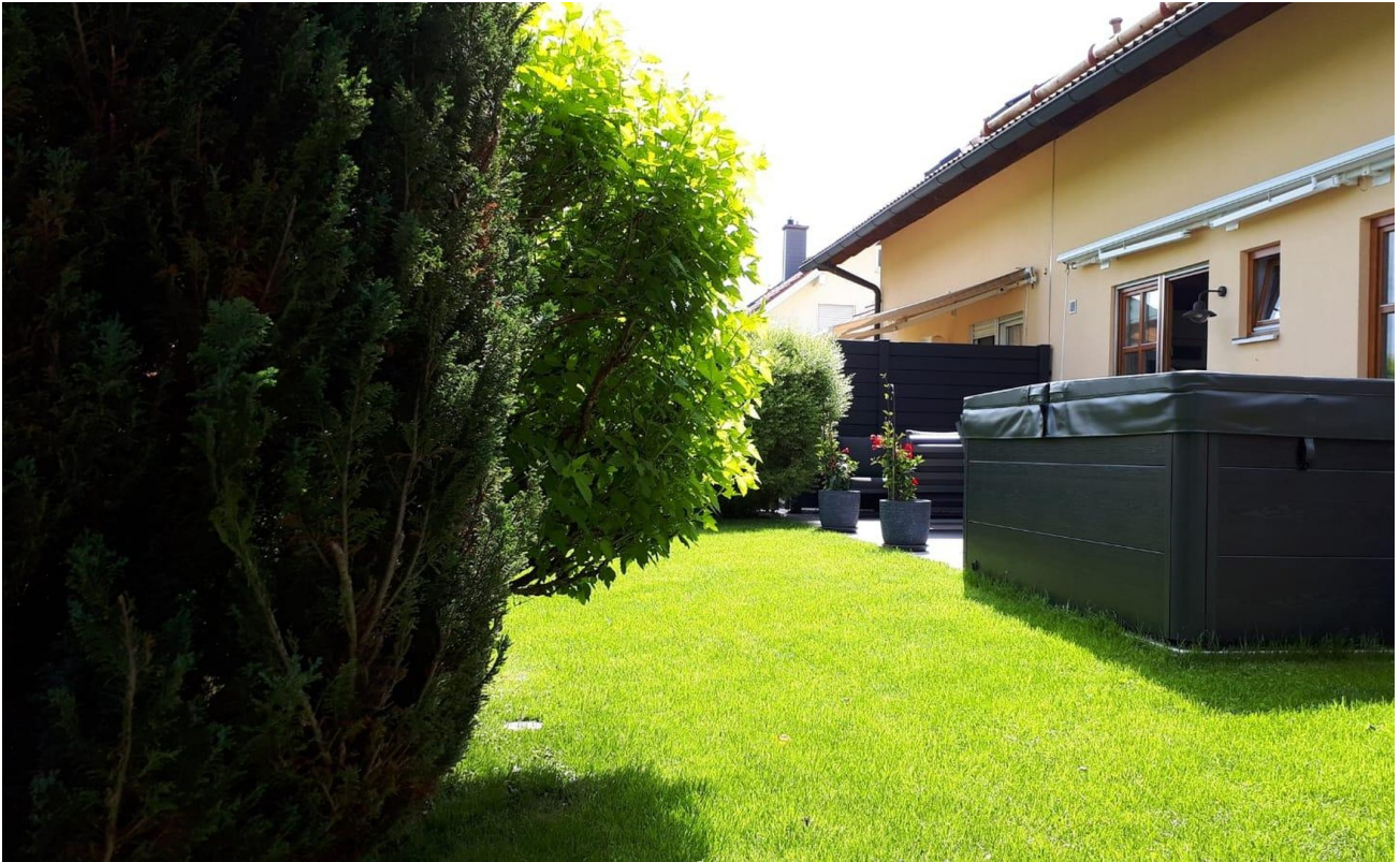
Terrasse hinter dem Haus