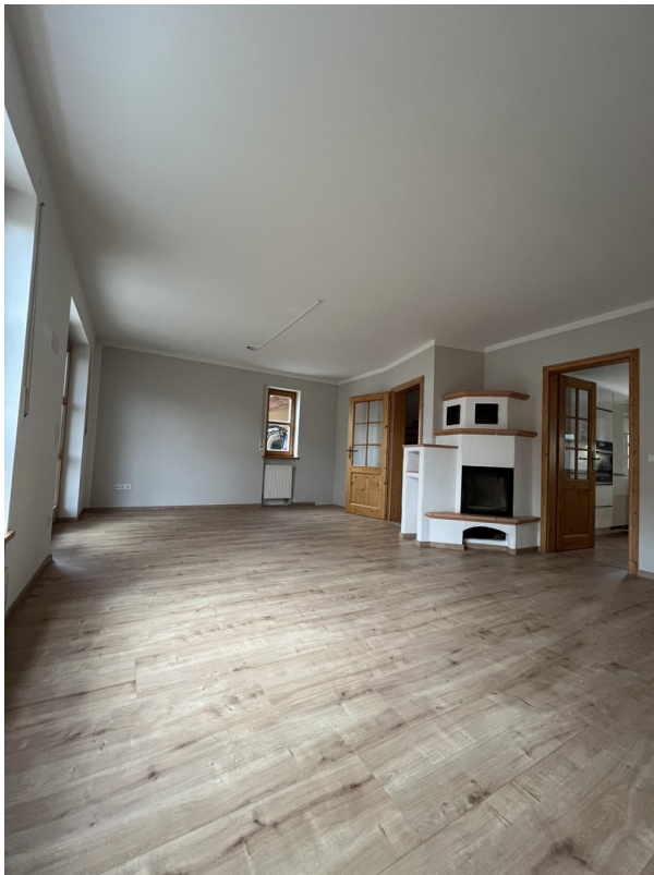
Wohnzimmer mit Kaminofen