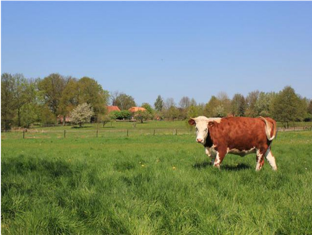
Wiesen, ganz in der Nähe