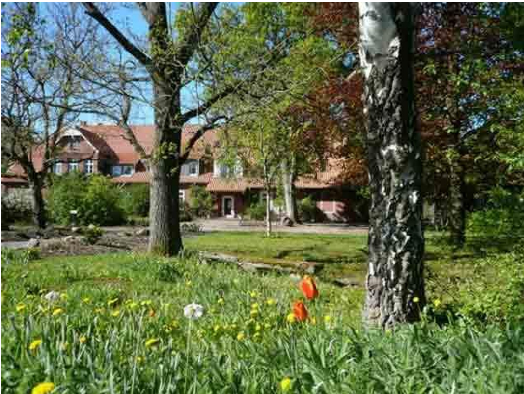
Hofanlage am Ortsrand