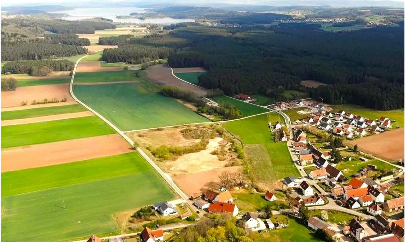
See im Hintergrund