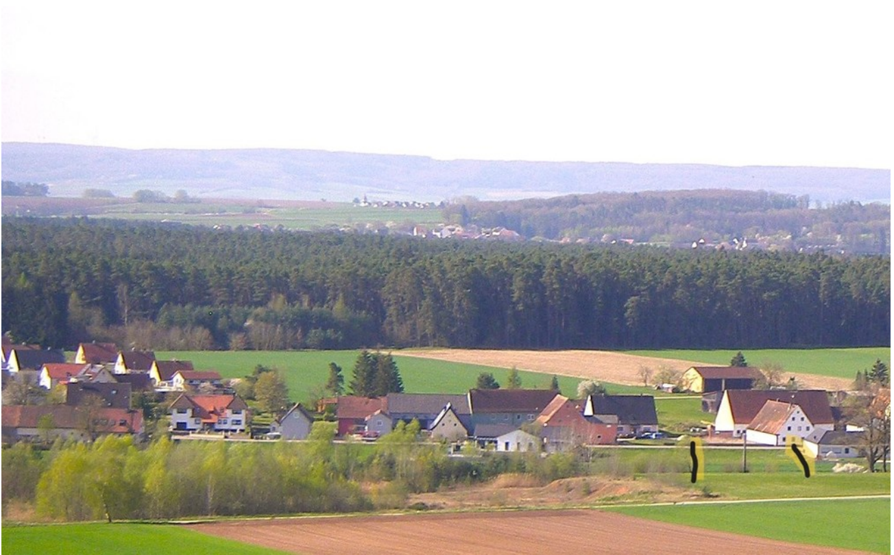
Zwischen Wald und Wiesen