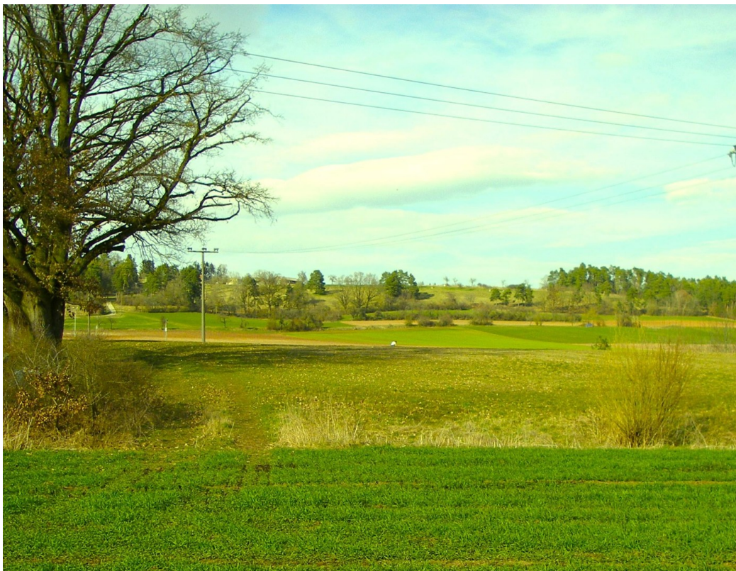
Beste ruhige Lage: Fernblick!