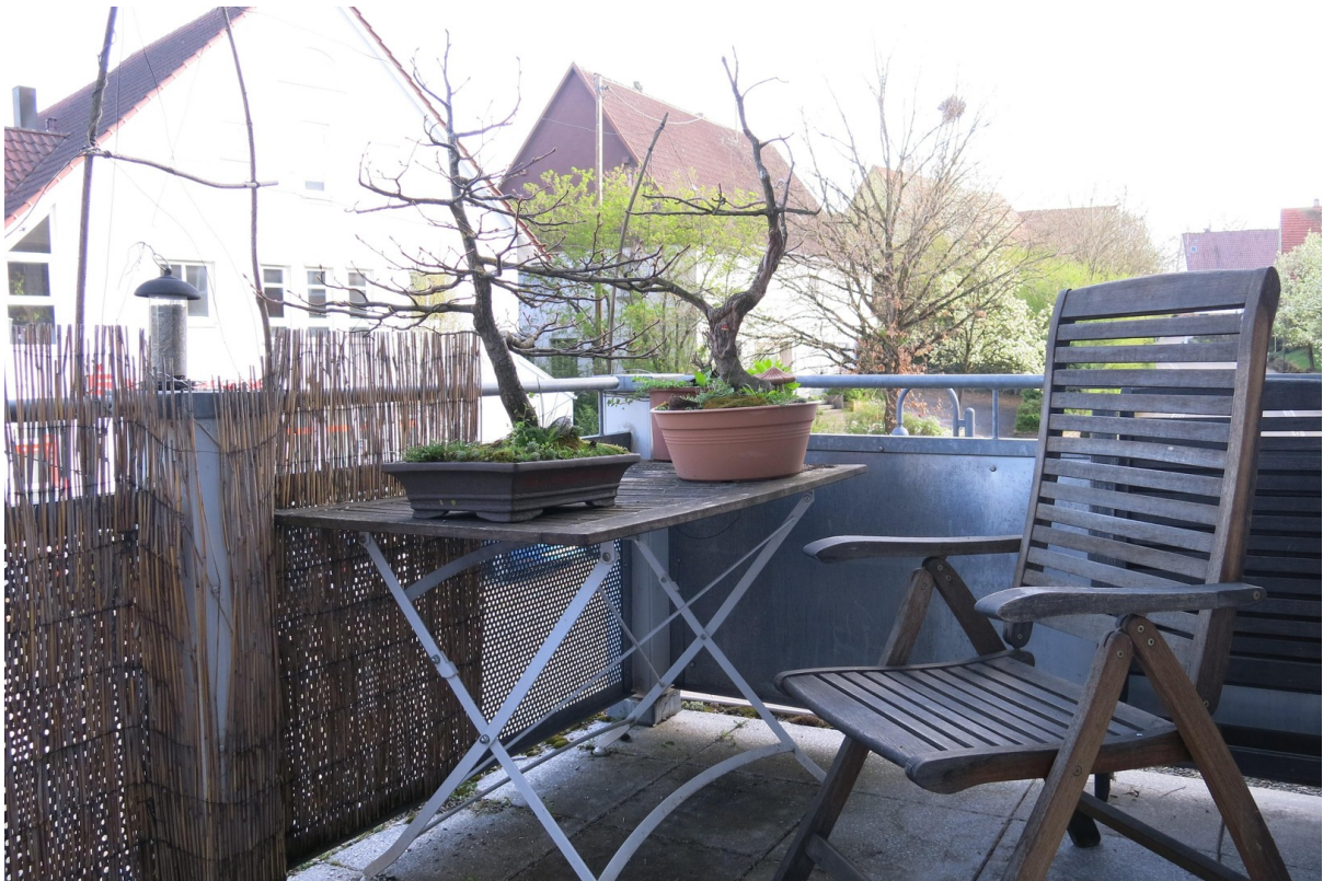
Balkon nach Osten