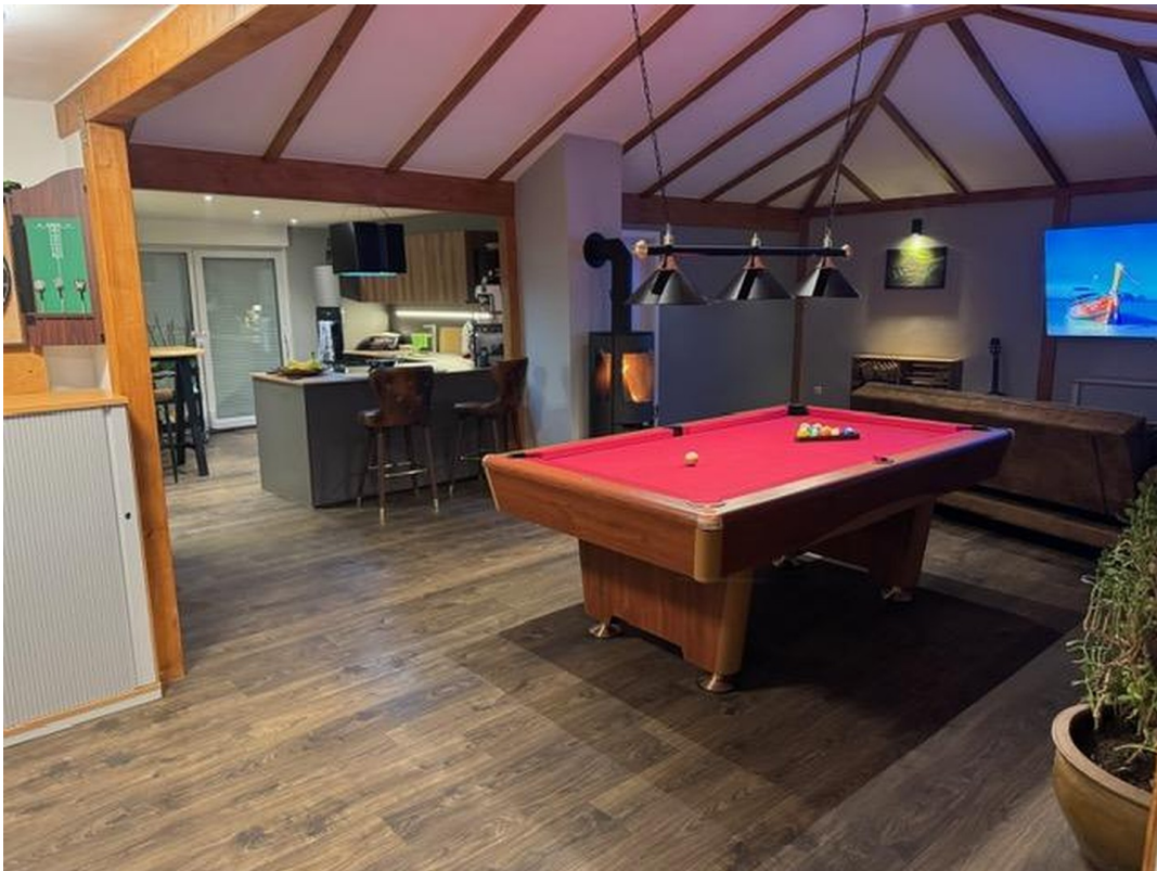
Gemeinschaftszimmer / Küche