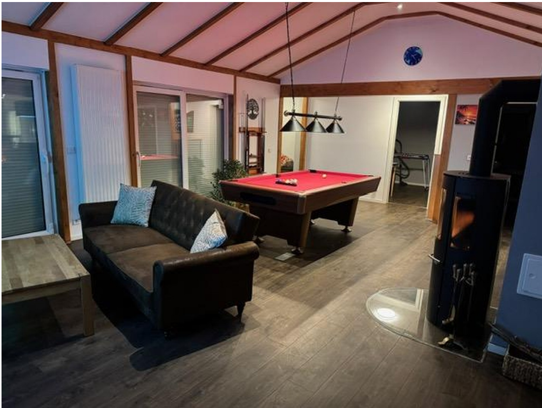
Kamin- und Billardzimmer