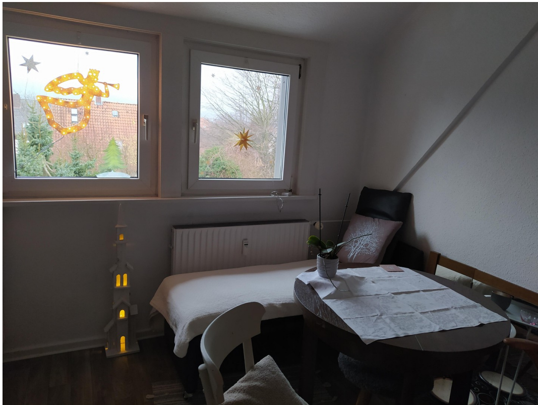
Küche mit Sofa