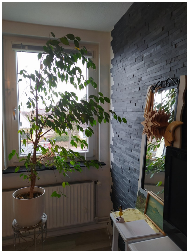
Zimmer Flur hinten eingerichte