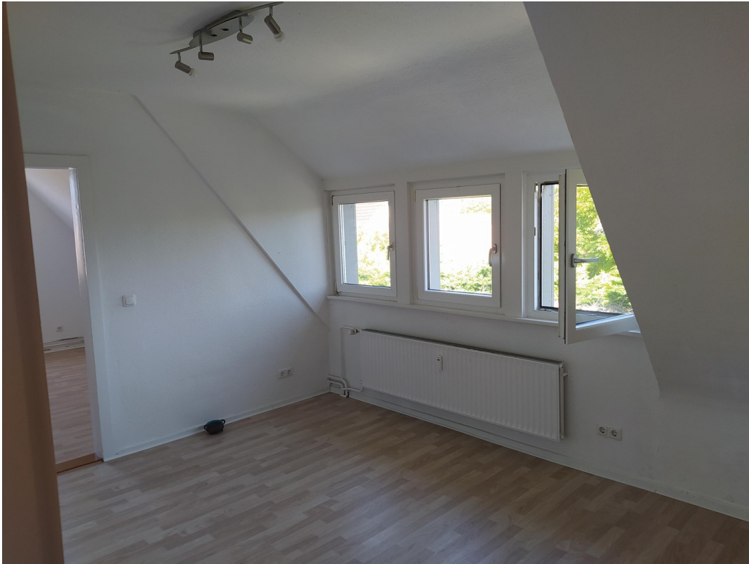
Vorn rechts drei Erkerfenster