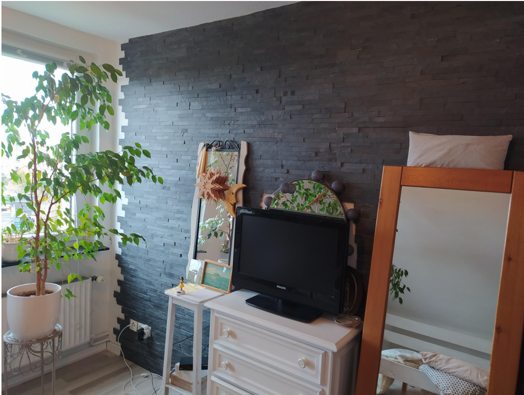
Schieferwand Zimmer hinten