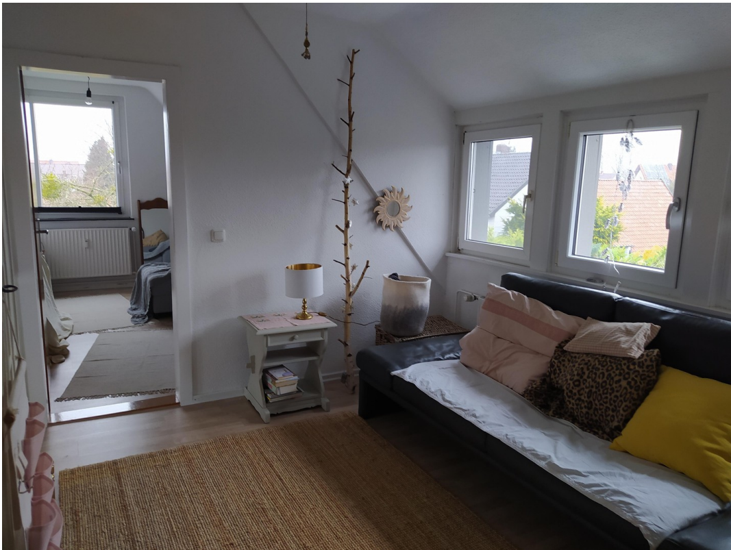
Vorn rechts eingerichtet