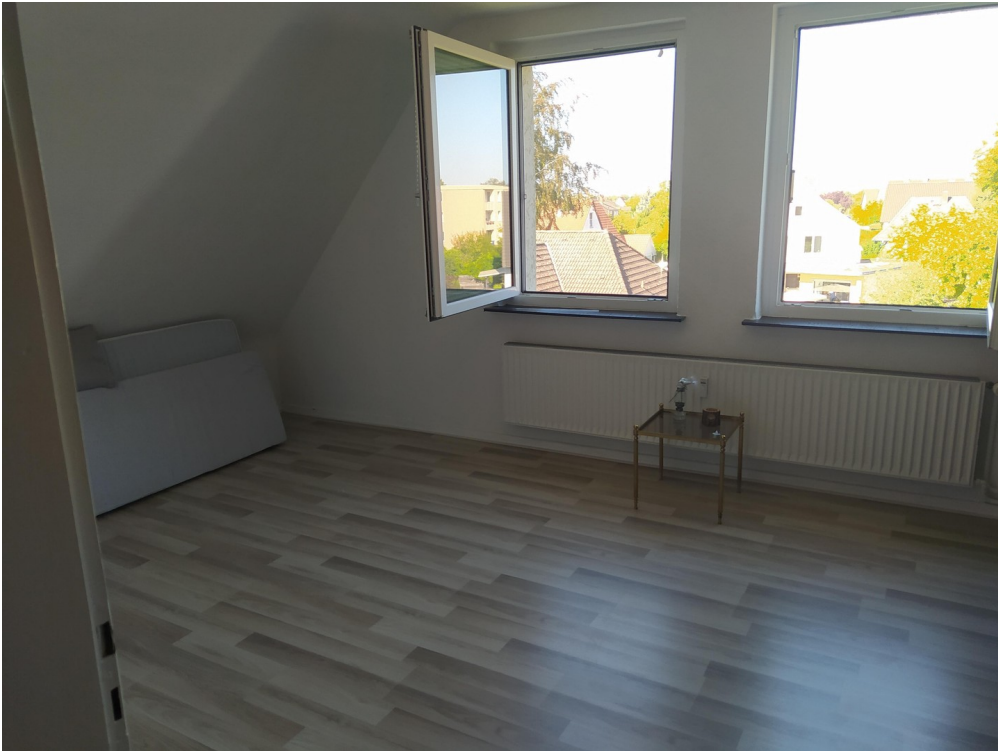
Zimmer Flur hinten