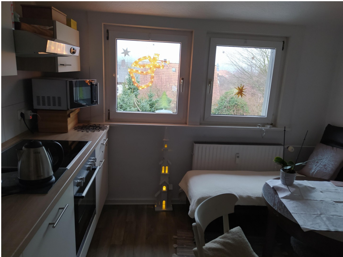
Küche mit Deisterblick