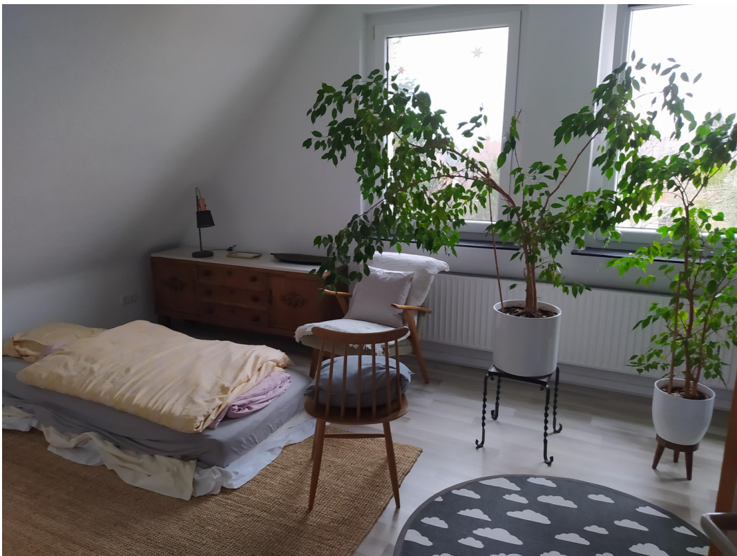
Zimmer hinten eingerichtet