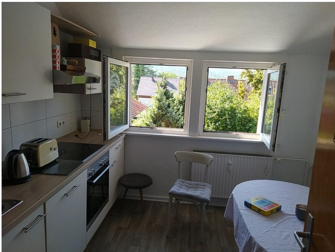
Küche mit Geschirrspülmaschine