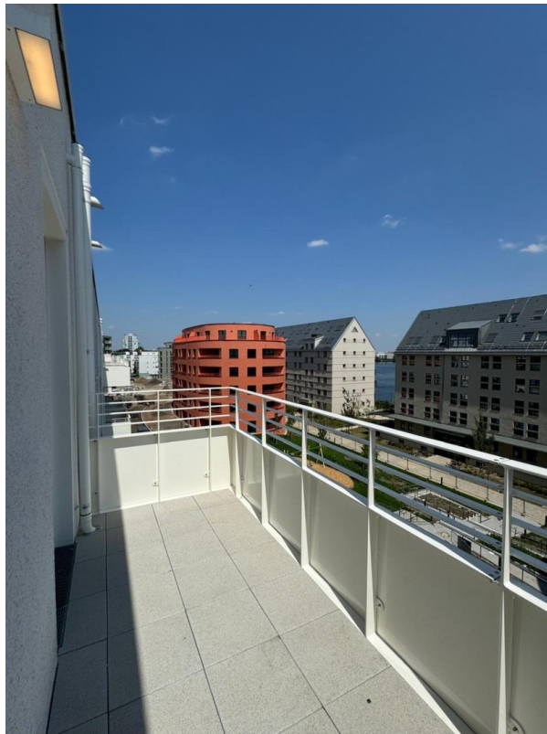
Blick auf die Havel vom Balkon