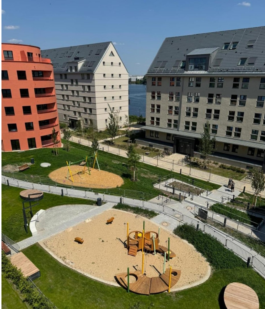
Blick auf die Havel vom Balkon