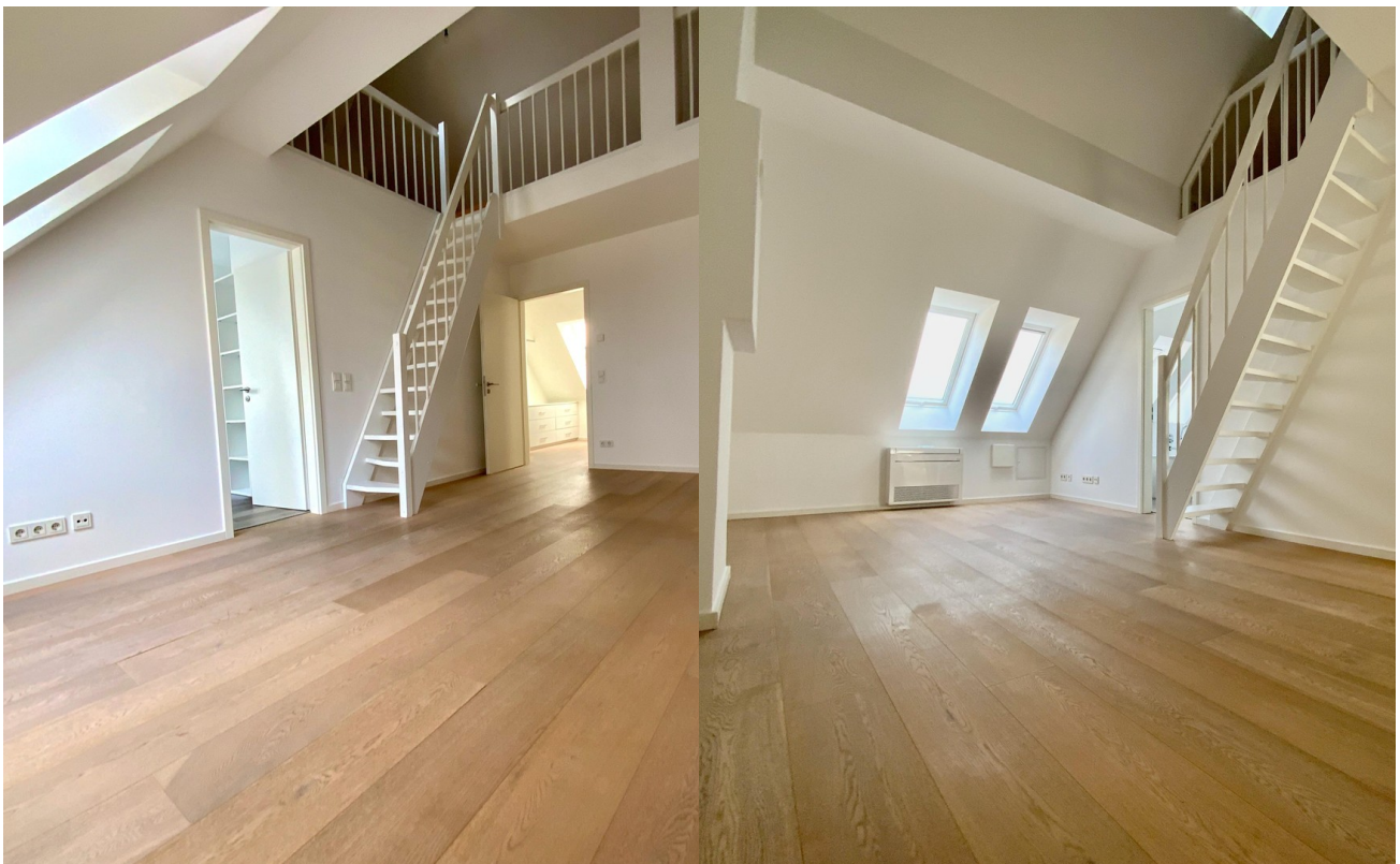
Schlafzimmer mit Emporee