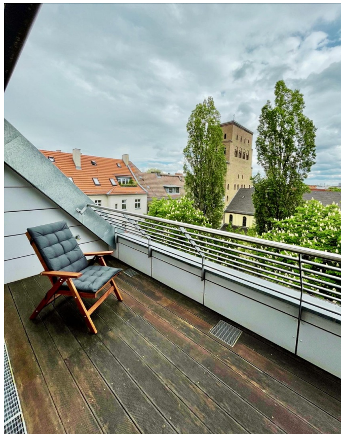
Dachterrasse 10 qm