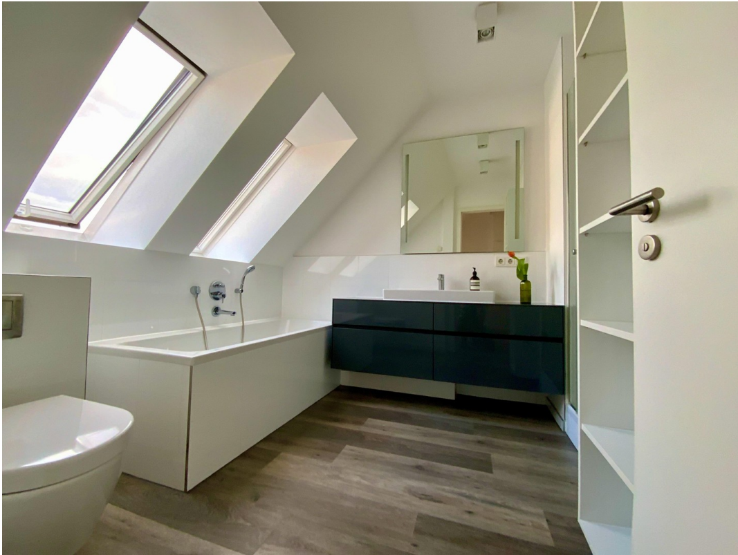
Masterbad mit Wanne und Dusche