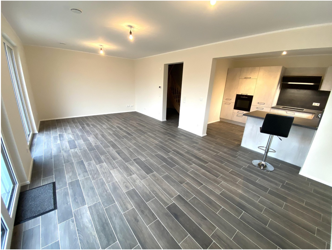
Wohnzimmer Ansicht 1