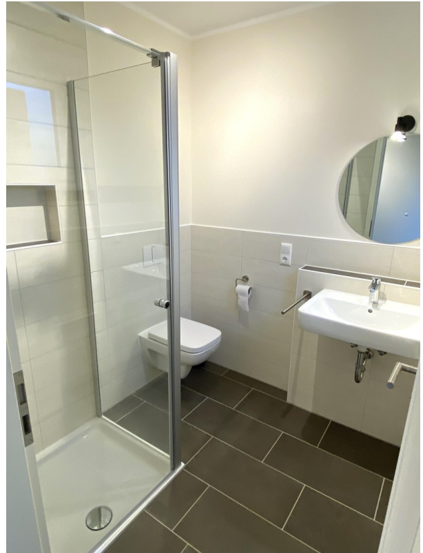
Dusch-WC EG Ansicht 1