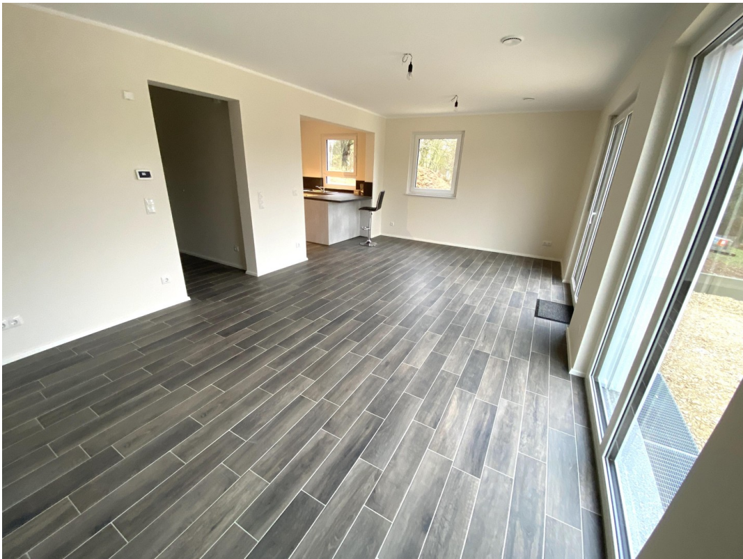
Wohnzimmer Ansicht 2