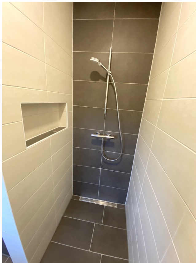
Dusche Badezimmer OG