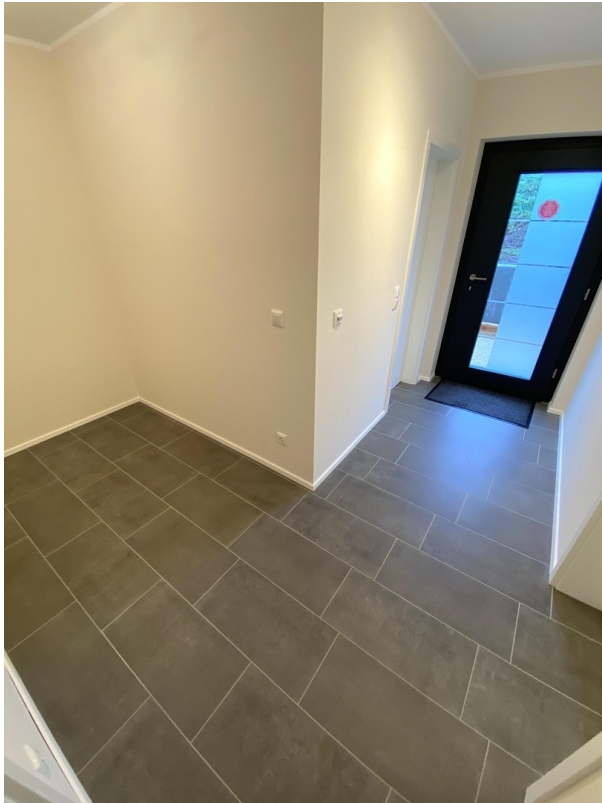
Eingang Flur und Garderobe