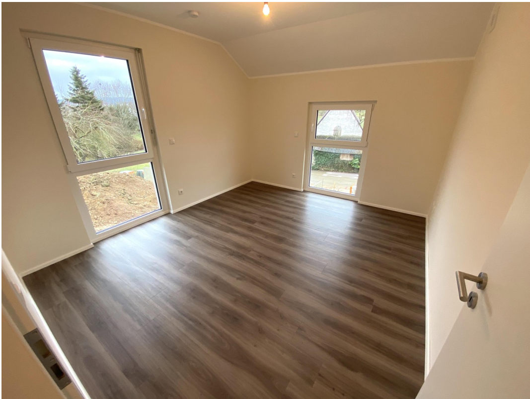
Kinderzimmer 1 OG