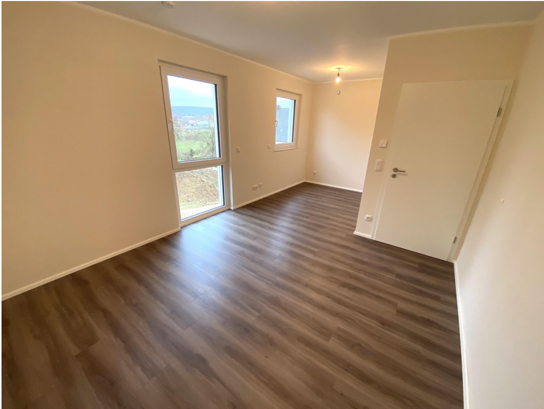
Schlafzimmer mit Ankleide OG