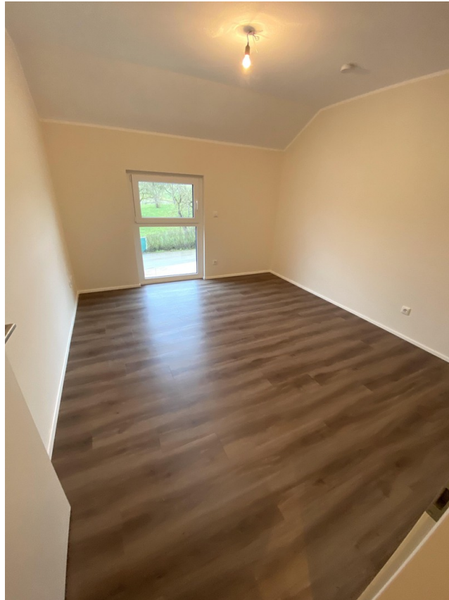
Kinderzimmer 2 OG