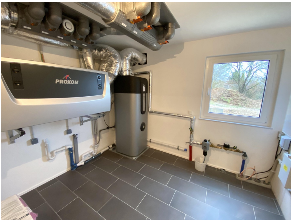
Technik- & Hauswirtschaftsraum