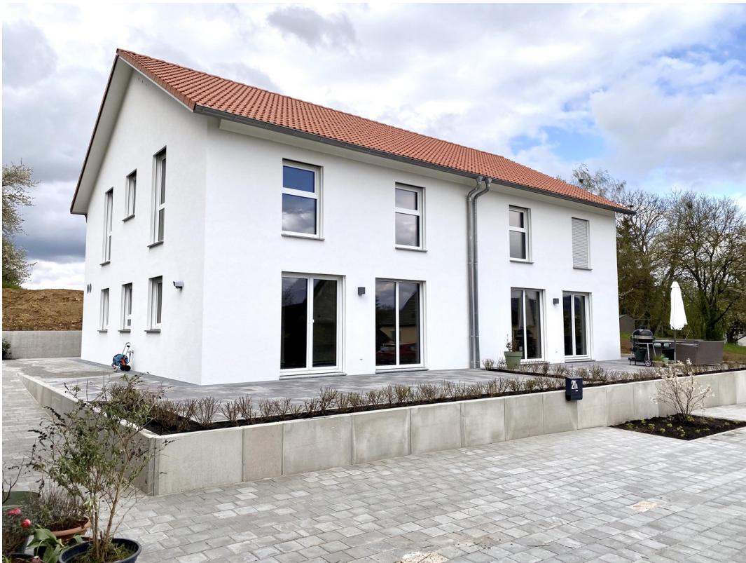
Hausansicht gesamtes Haus