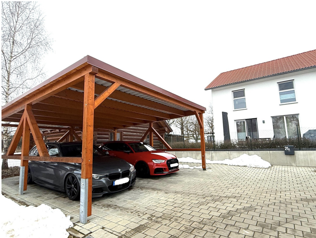
Carport vor dem Haus