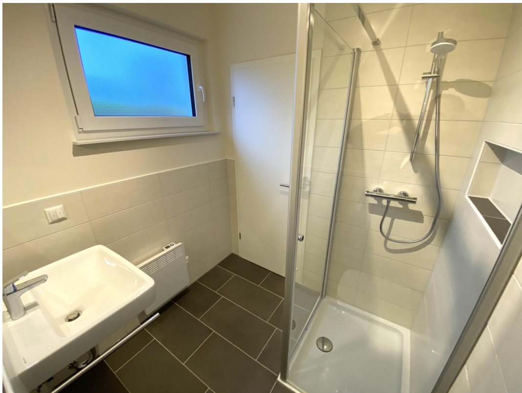
Dusch-WC EG Ansicht 2