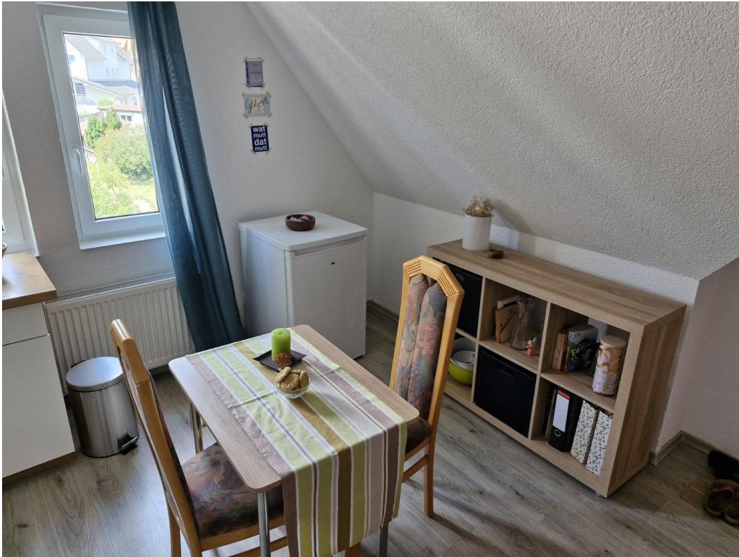
Essbereich in der Küche