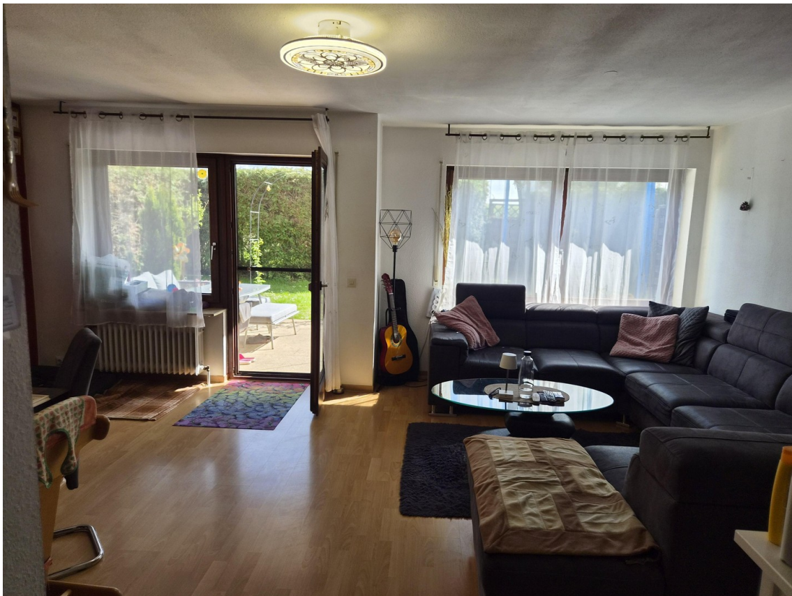
Wohnraum mit Terrassenausgang