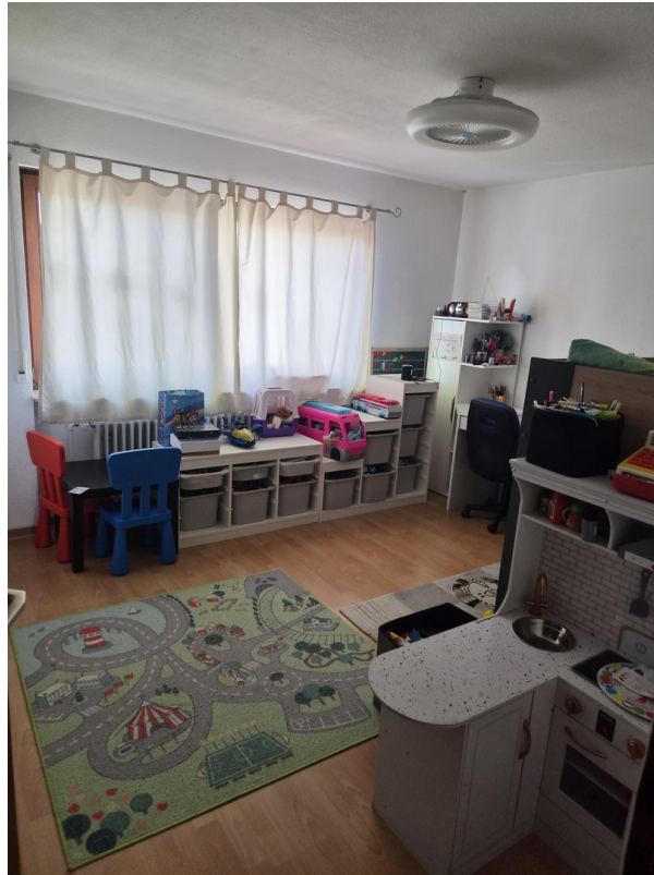
Zimmer nach Norden