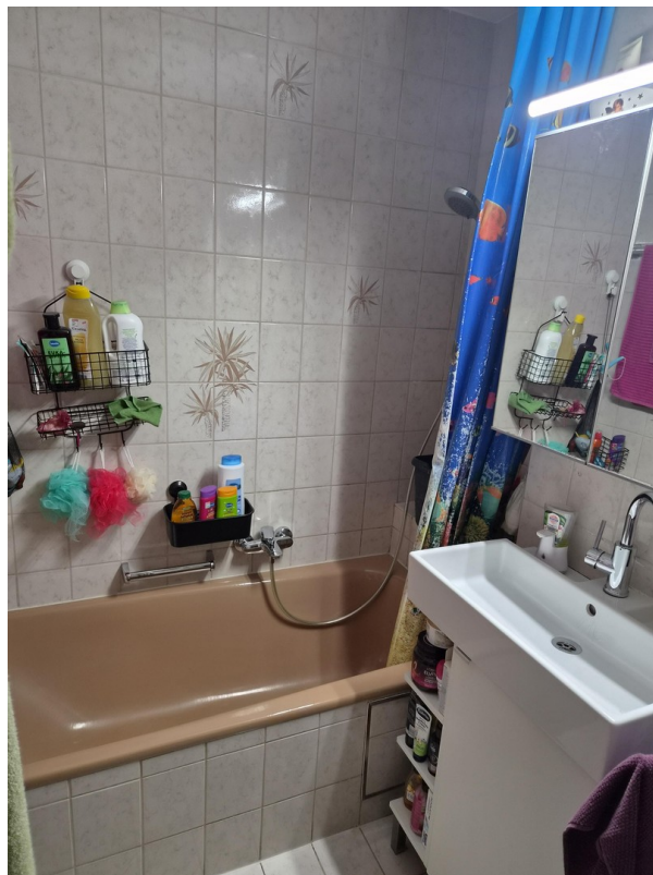
Bad und mit Badewanne