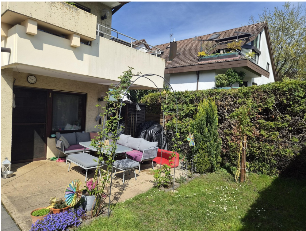
Terrasse mit Garten