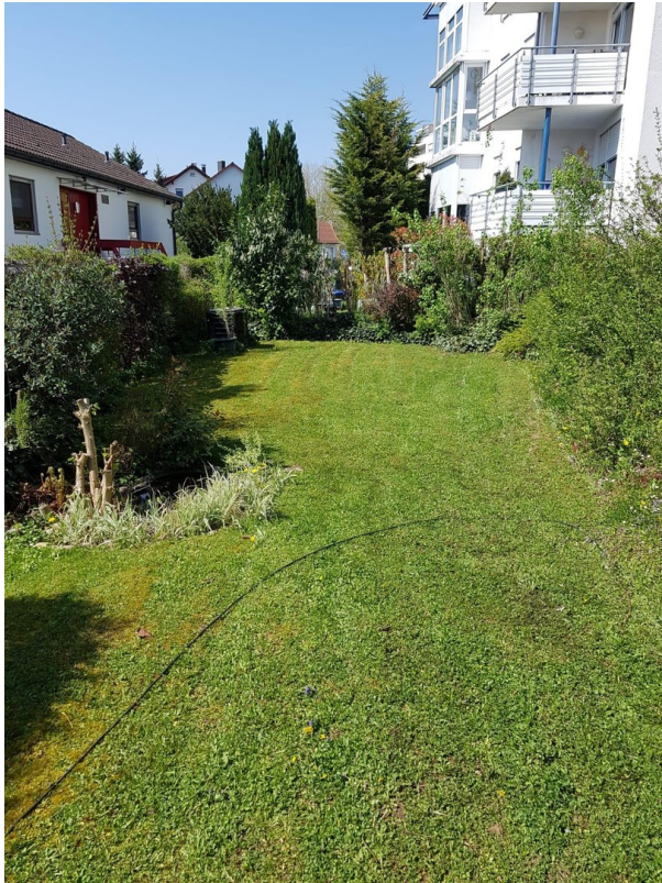
Garten - untere Ebene