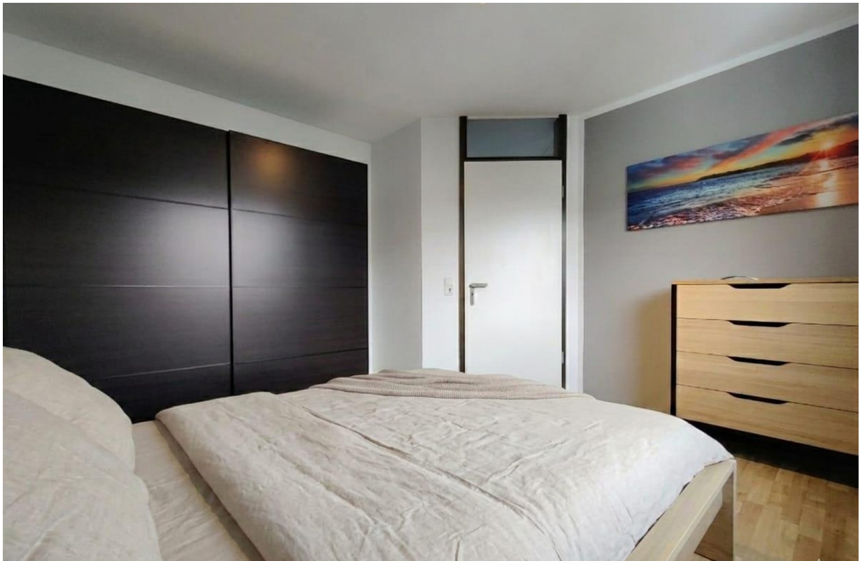
Schlafzimmer (KI bearbeitet)