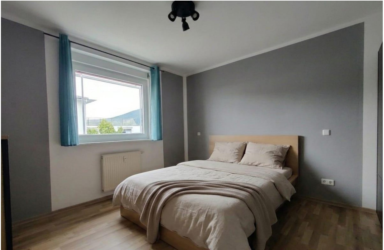
Schlafzimmer (KI bearbeitet)