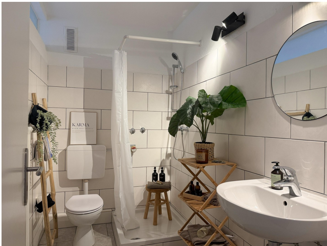
Bad (neue Duschkabine kommt)