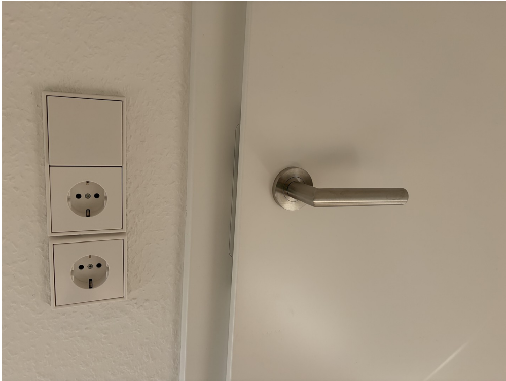
JUNG-Install. / Griffwerk-Gar.