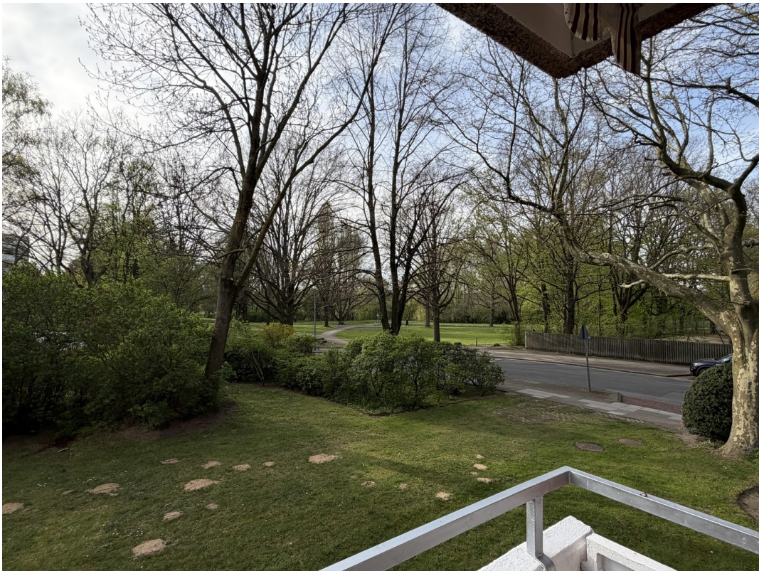
Ausblick ins Grüne