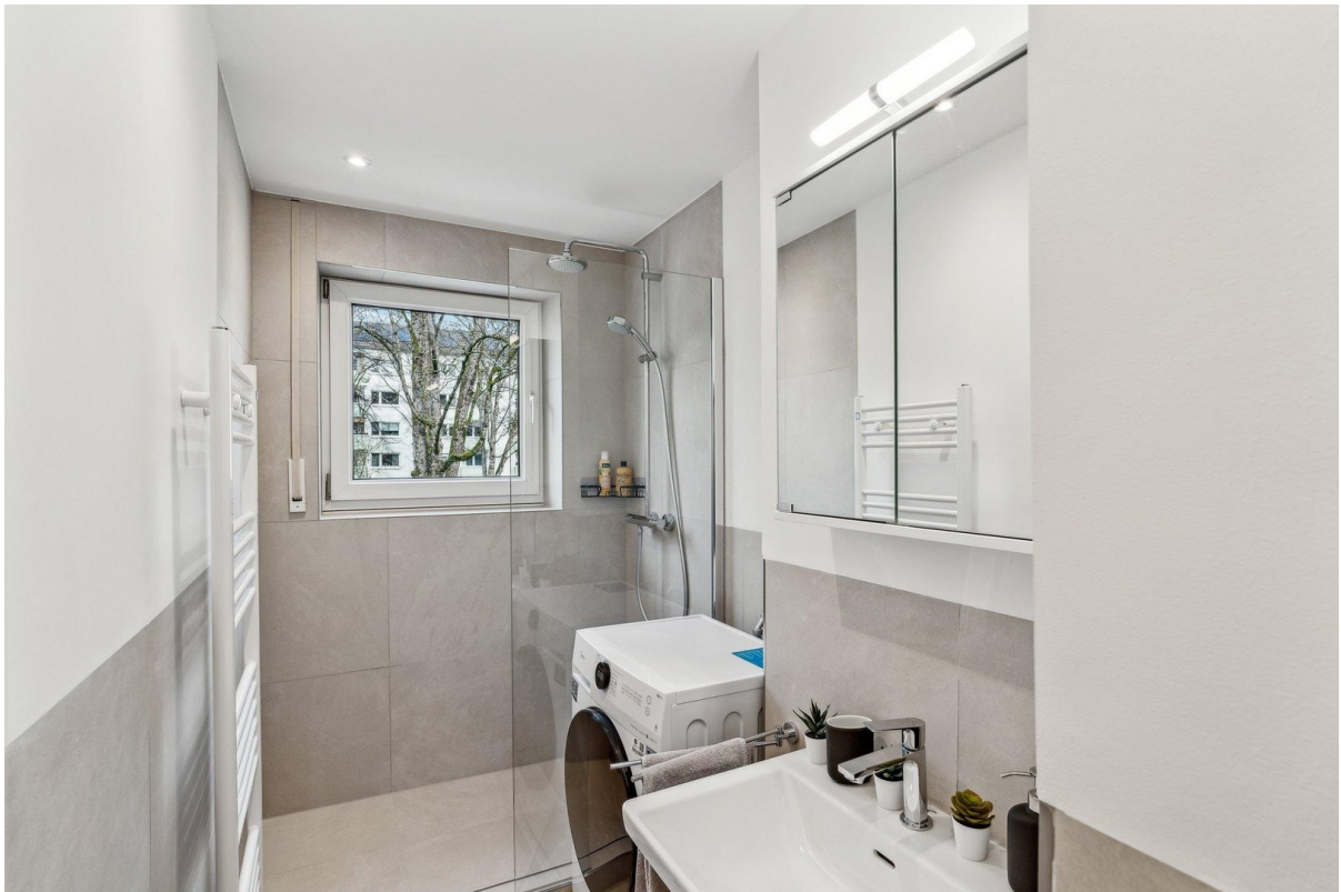
Badezimmer mit Waschtrockner