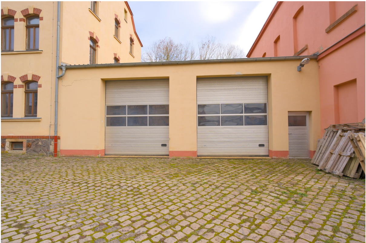
Hof mit weiteren Gebäuden