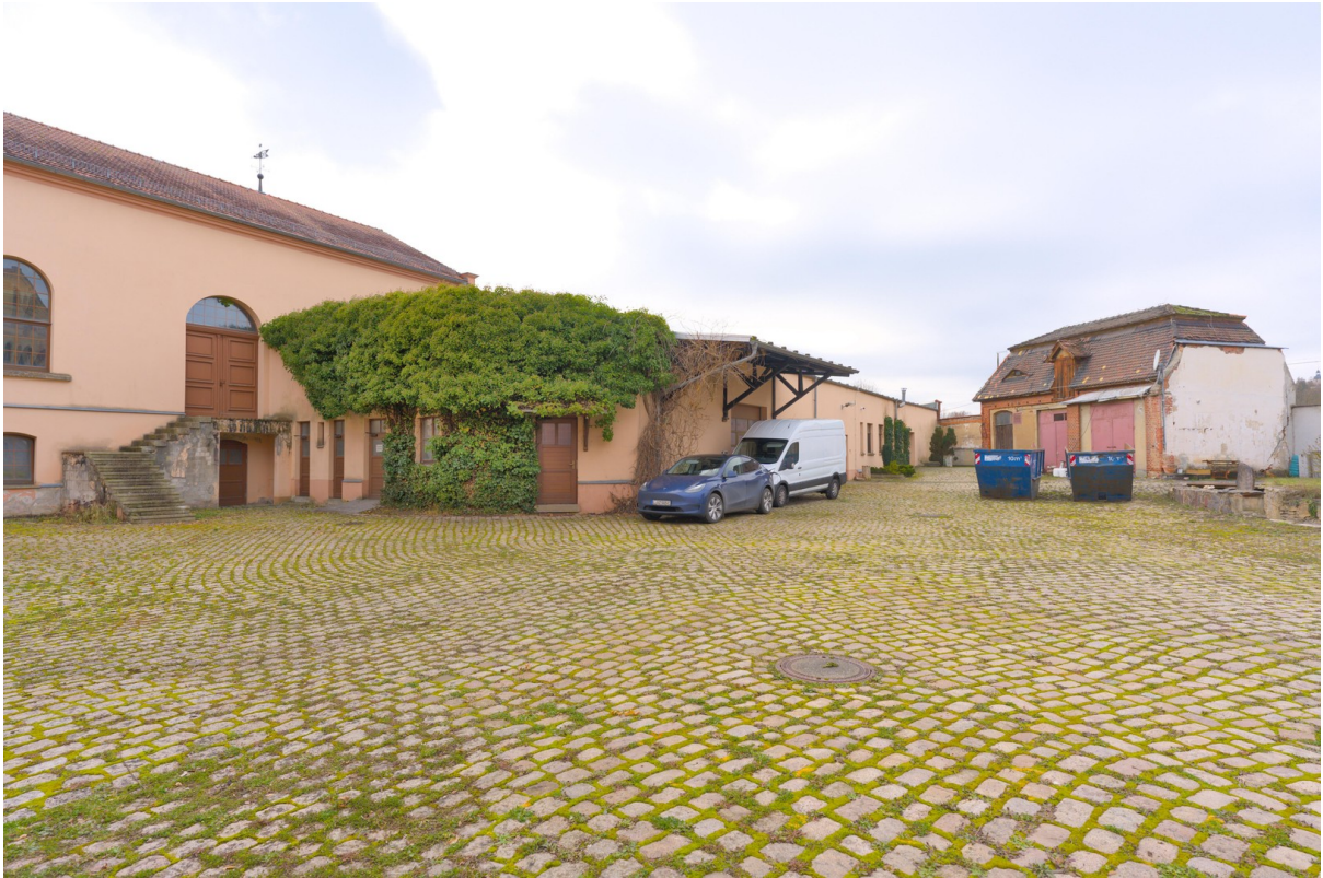
Hof mit weiteren Gebäuden