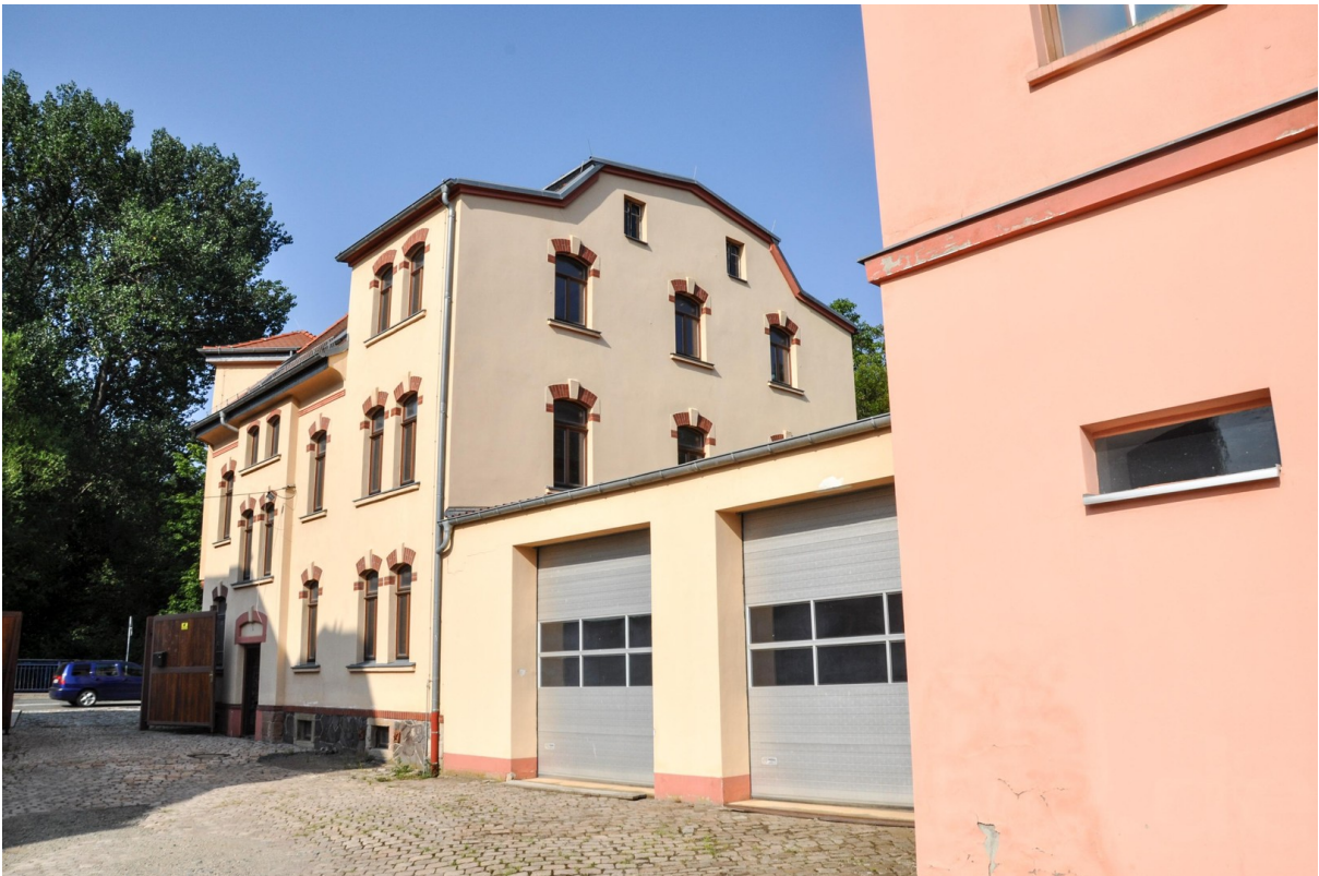
Hof mit weiteren Gebäuden