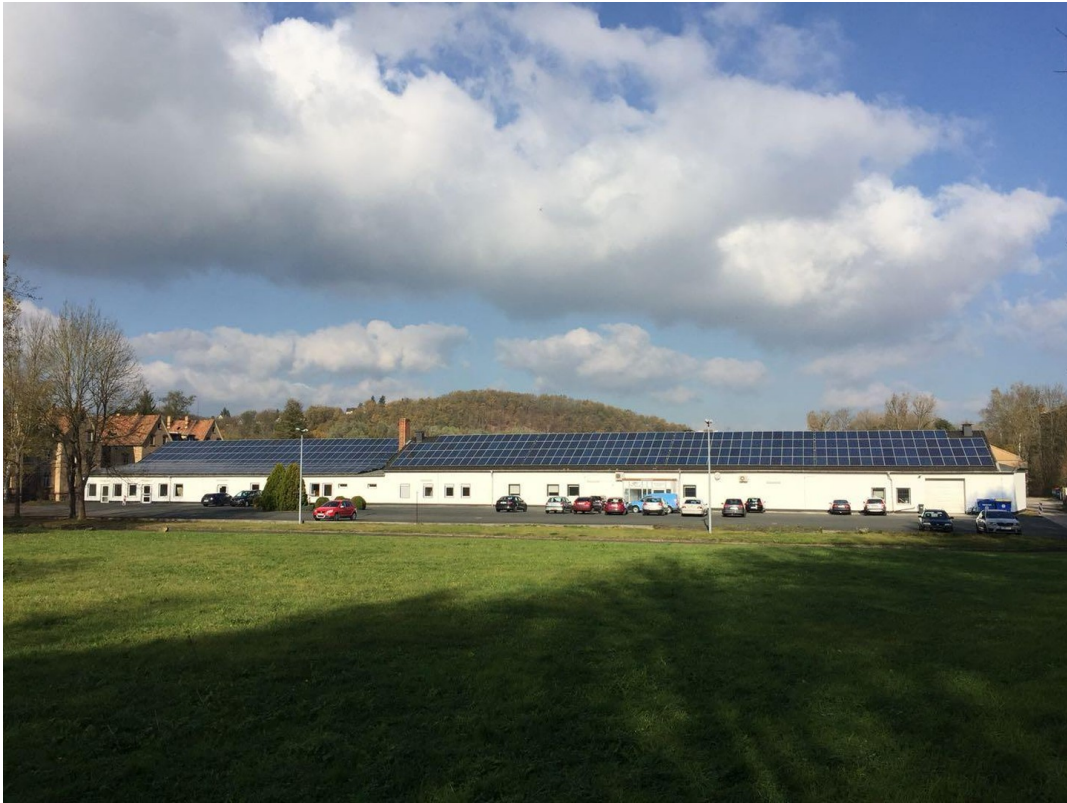
Rückseite mit Parkplatz