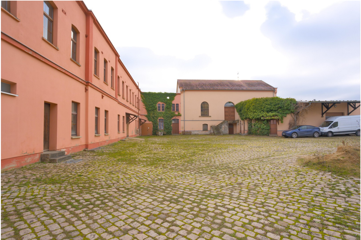
Hof mit weiteren Gebäuden