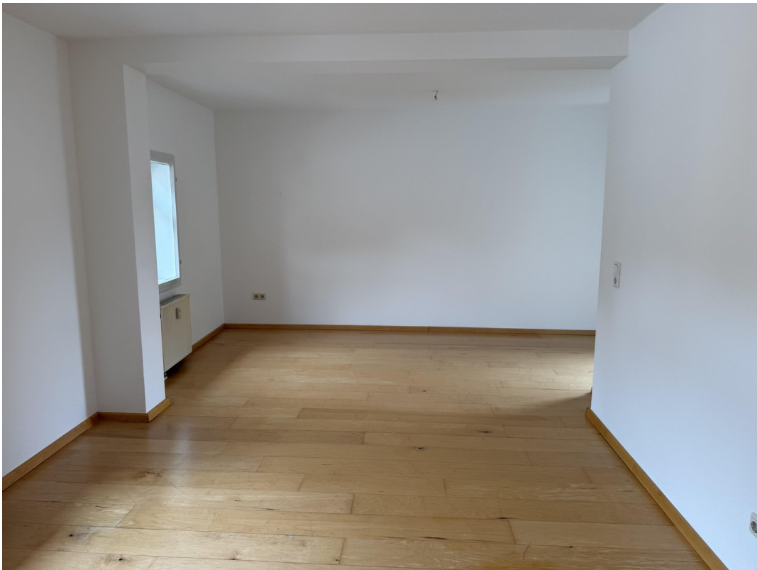
Wohn- / Essbereich