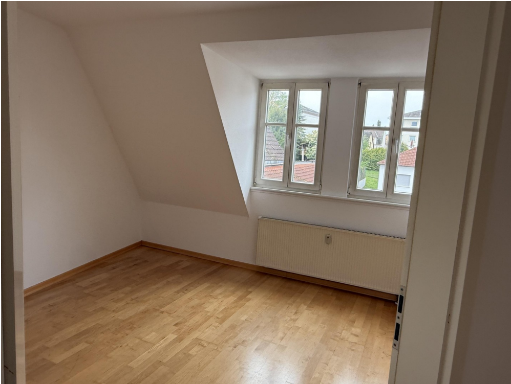
Schlaf / Arbeitszimmer