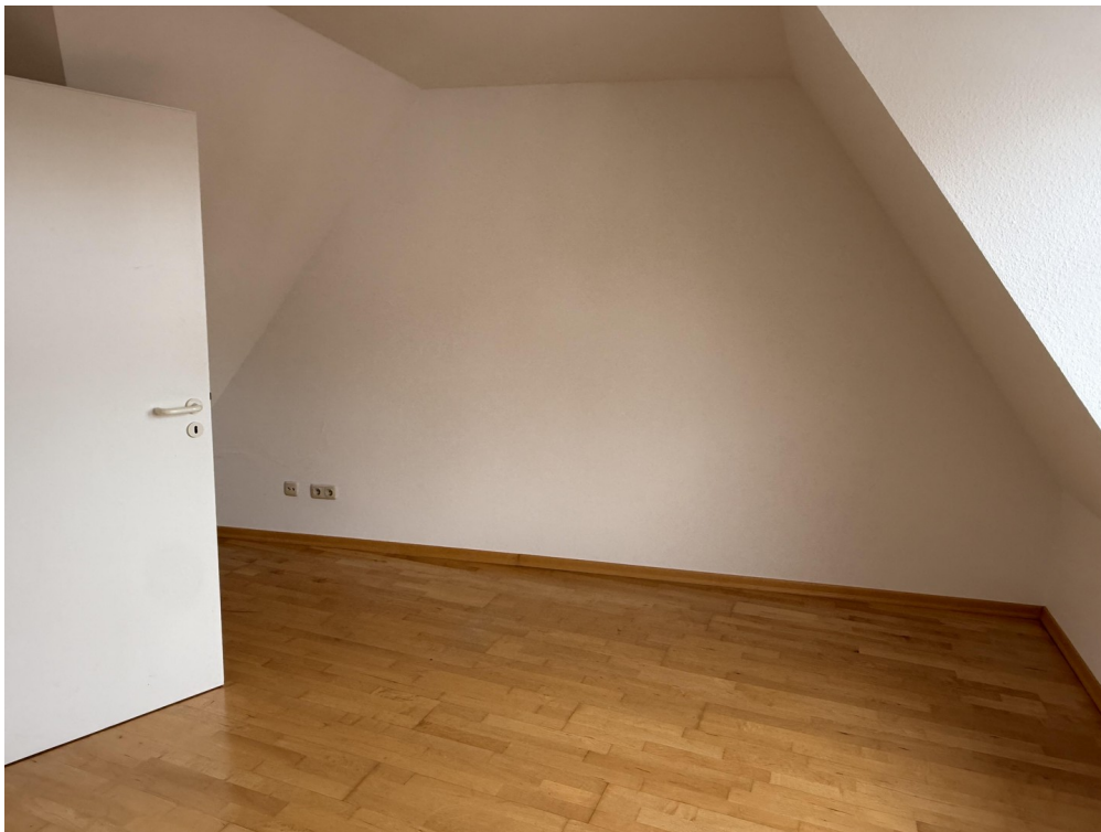
Schlaf / Arbeitszimmer