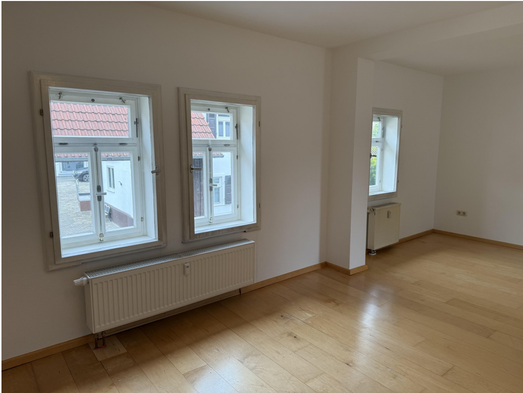
Wohn- / Essbereich