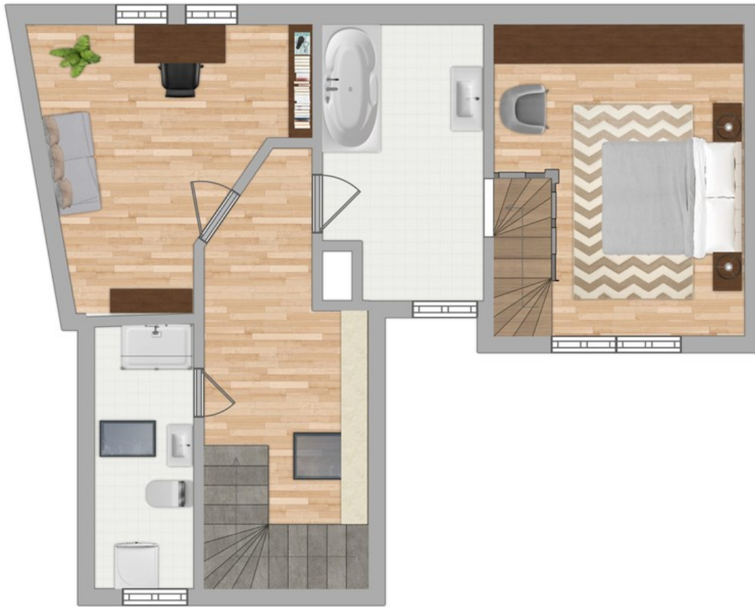
Grundriss 2. OG