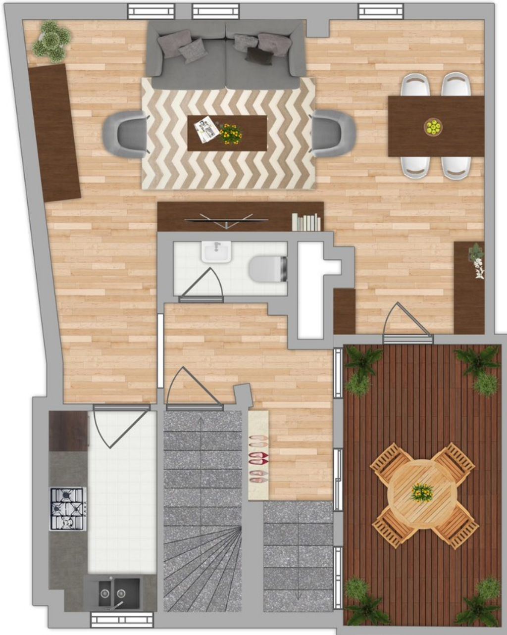
Grundriss 1. OG