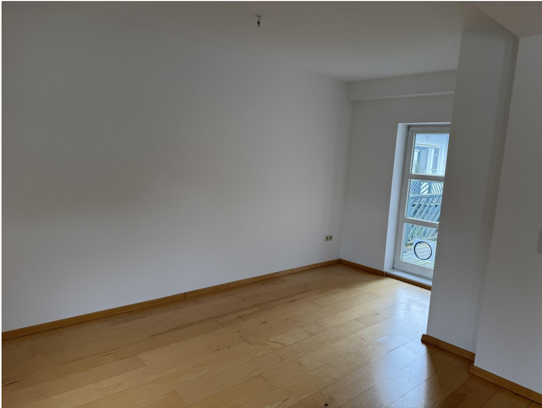
Wohn- / Essbereich