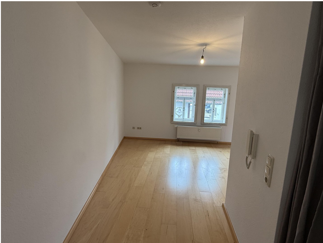
Wohn- / Essbereich