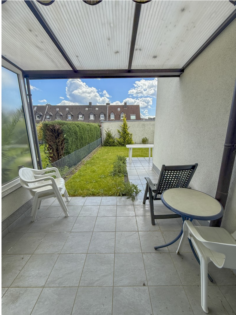
Terrasse am Schlafzimmer