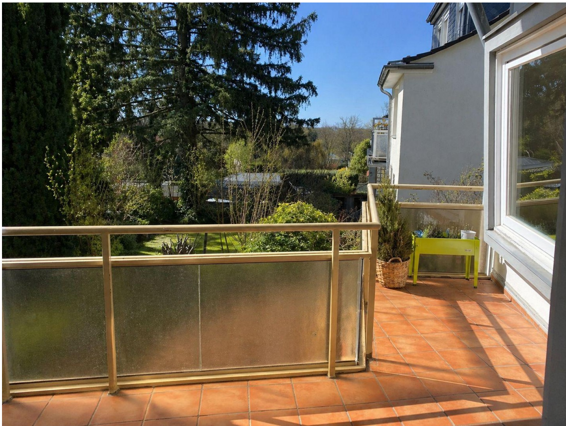
Balkon mit Blick in den Garten