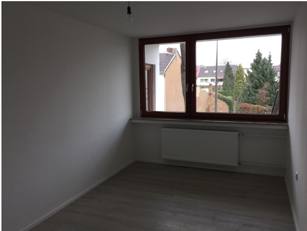
Schlafzimmer Richtung Balkon