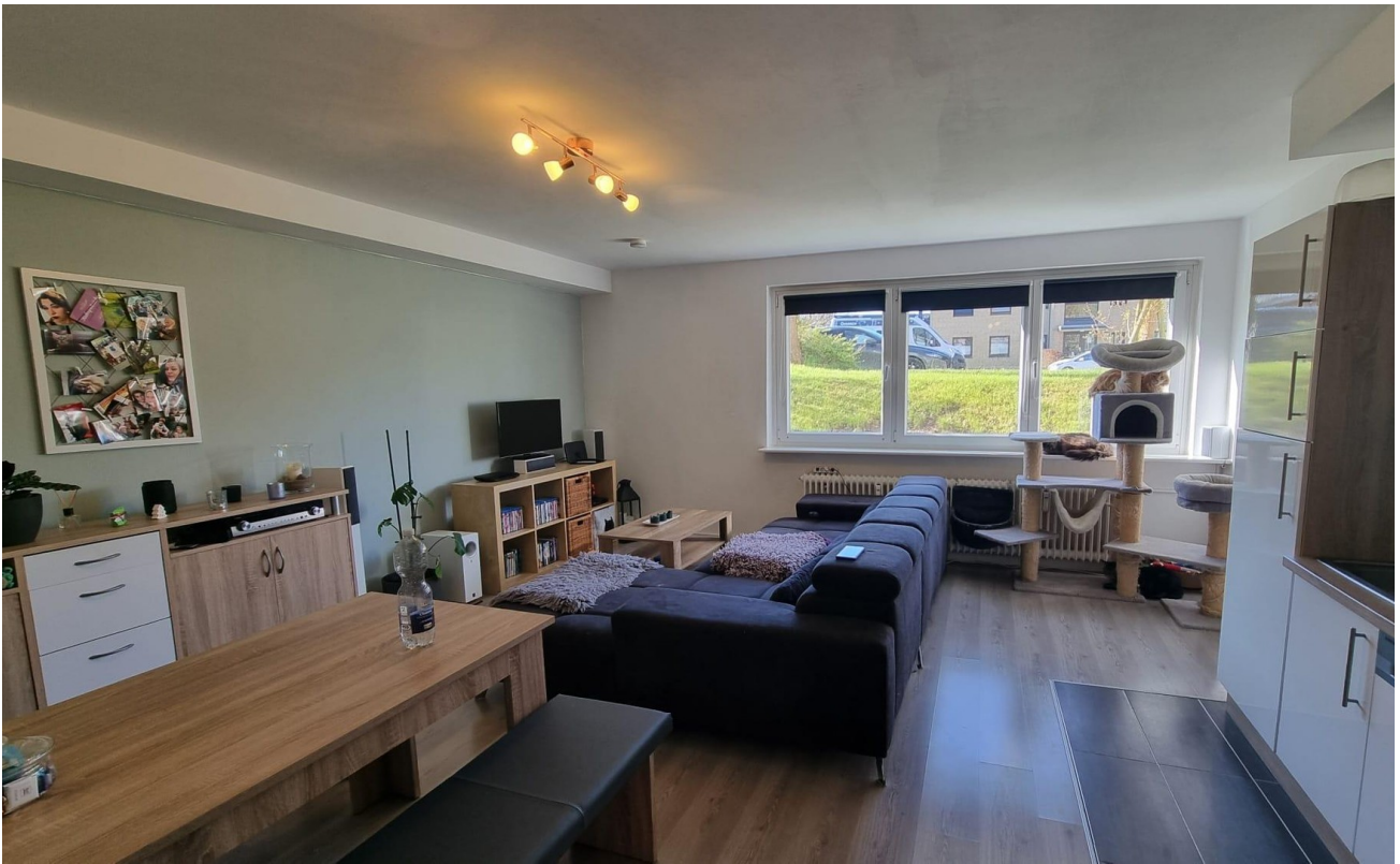
Wohnzimmer mit Küche