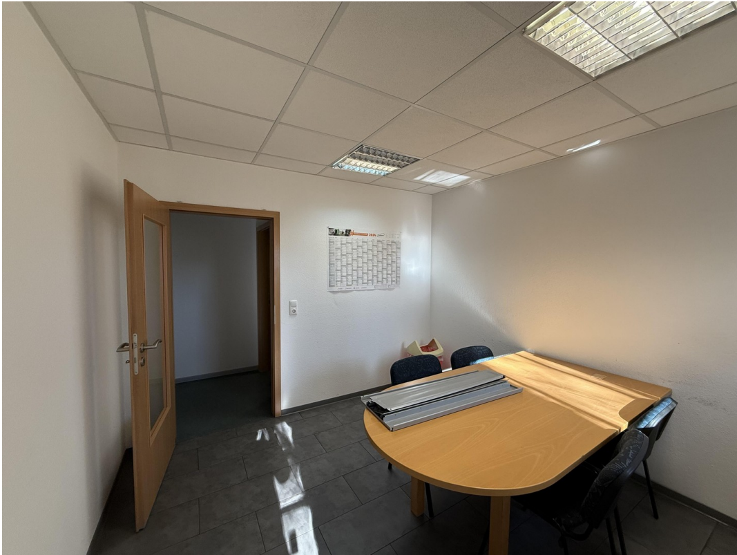
Büro / Pausenraum