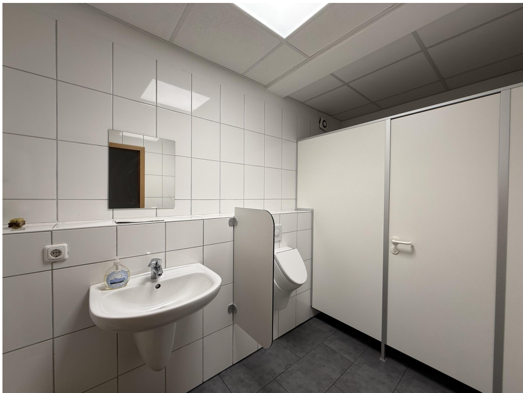
Sanitäre Anlagen / WC