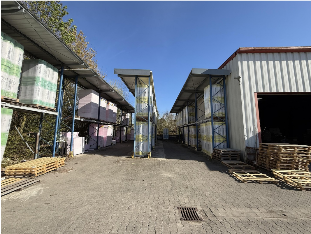
Hoffläche / Freigelände