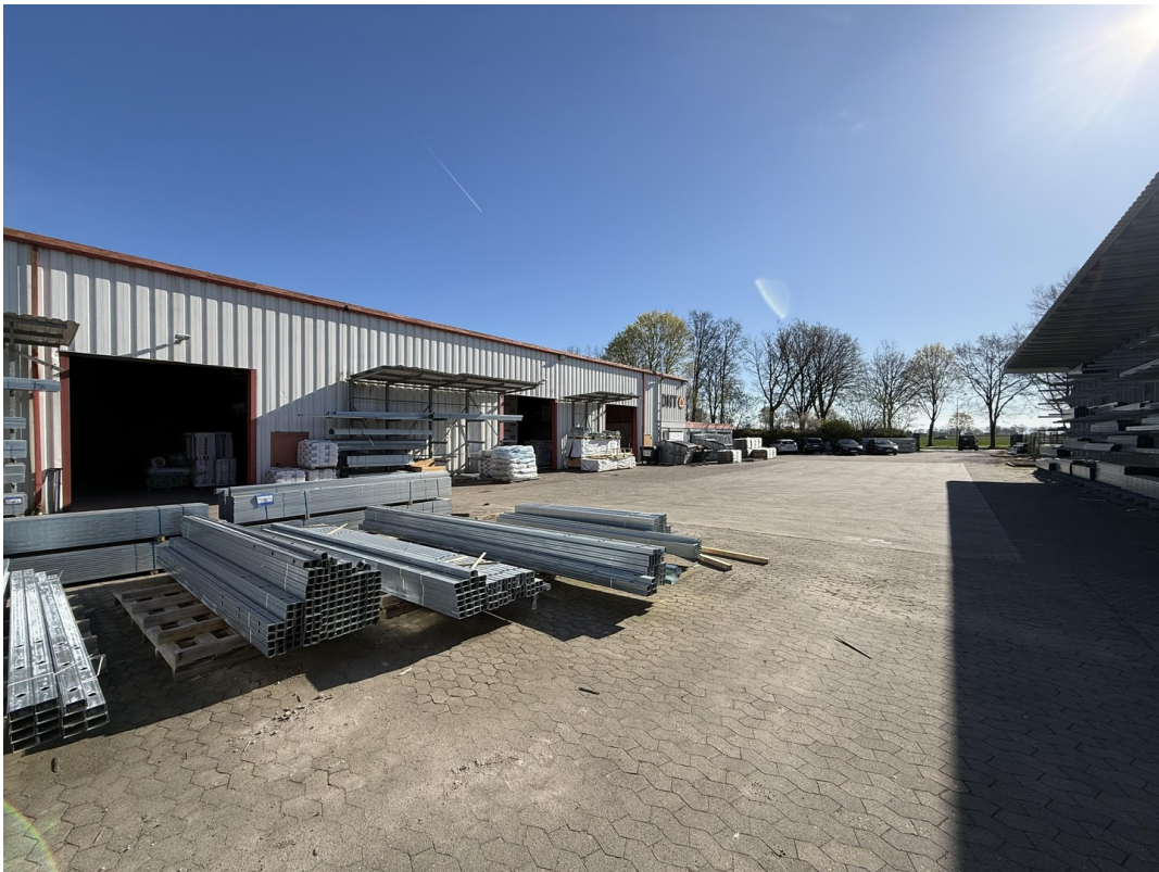
Hoffläche / Freigelände