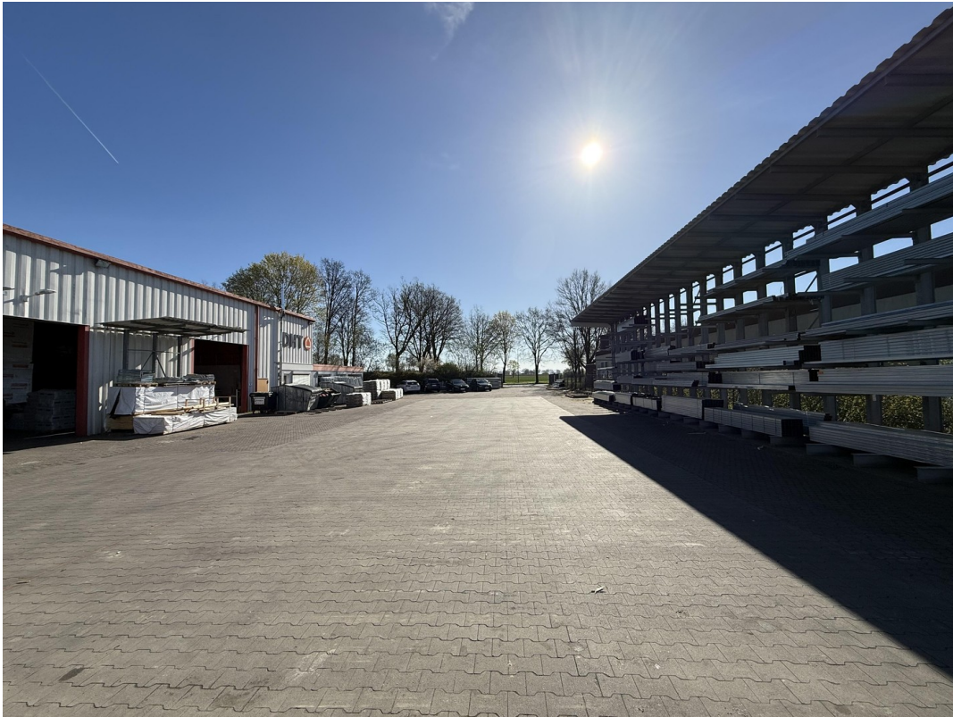
Hoffläche / Freigelände