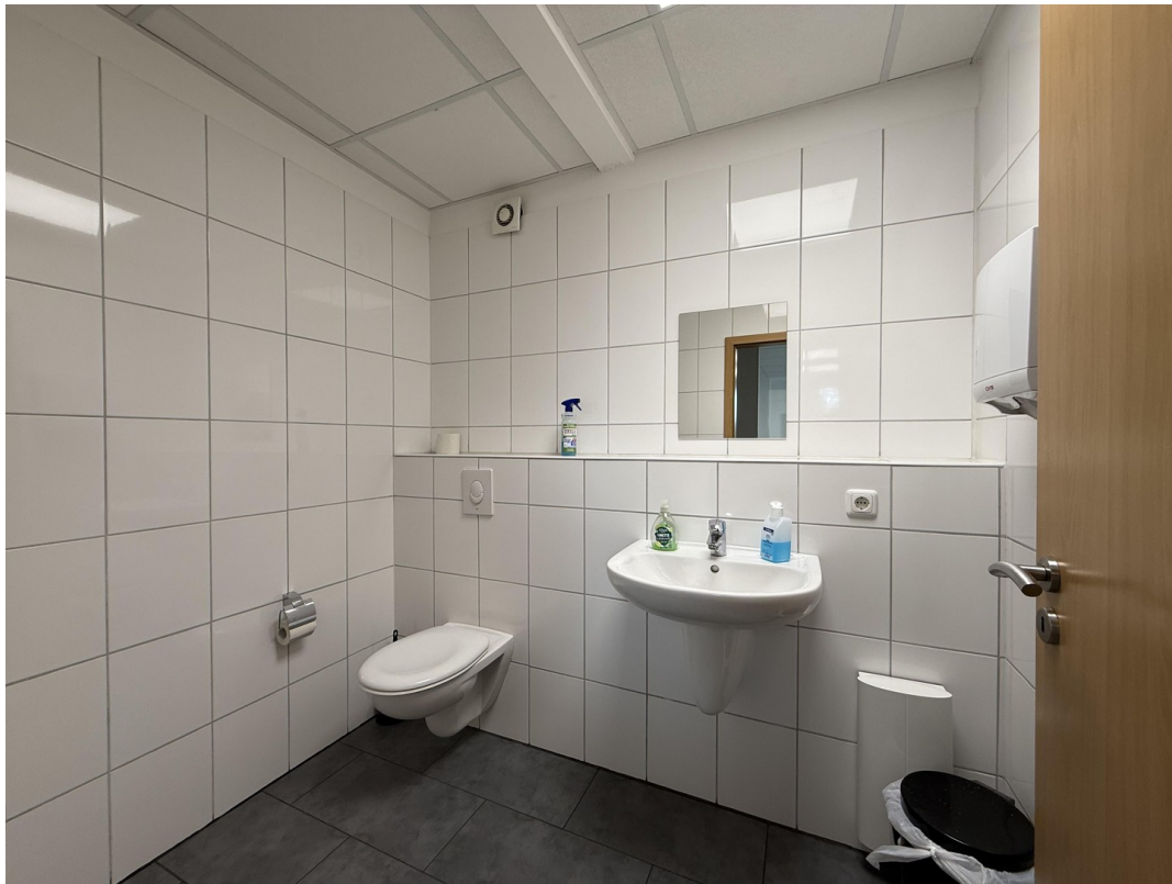
Sanitäre Anlagen / WC