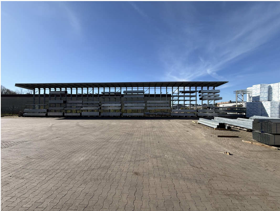
Hoffläche / Freigelände