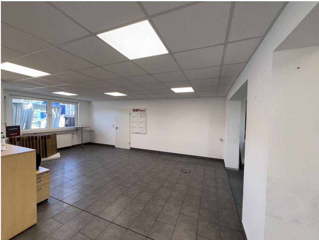
Bürofläche / Kundenempfang