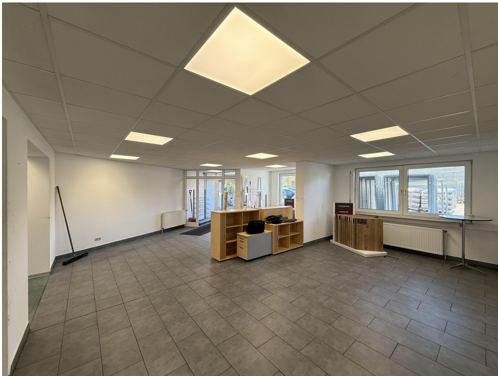
Bürofläche / Kundenempfang