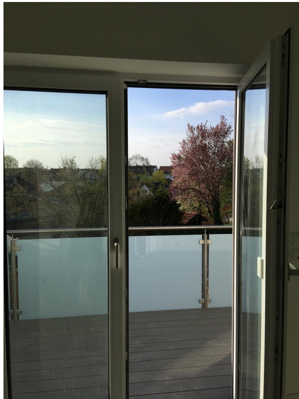
Blick zum Balkon