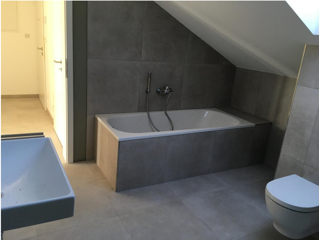
Badezimmer m. schöner Badewanne