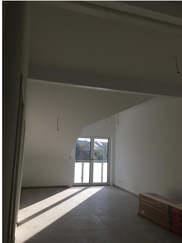
exklusive Zimmerhöhe m. Balken