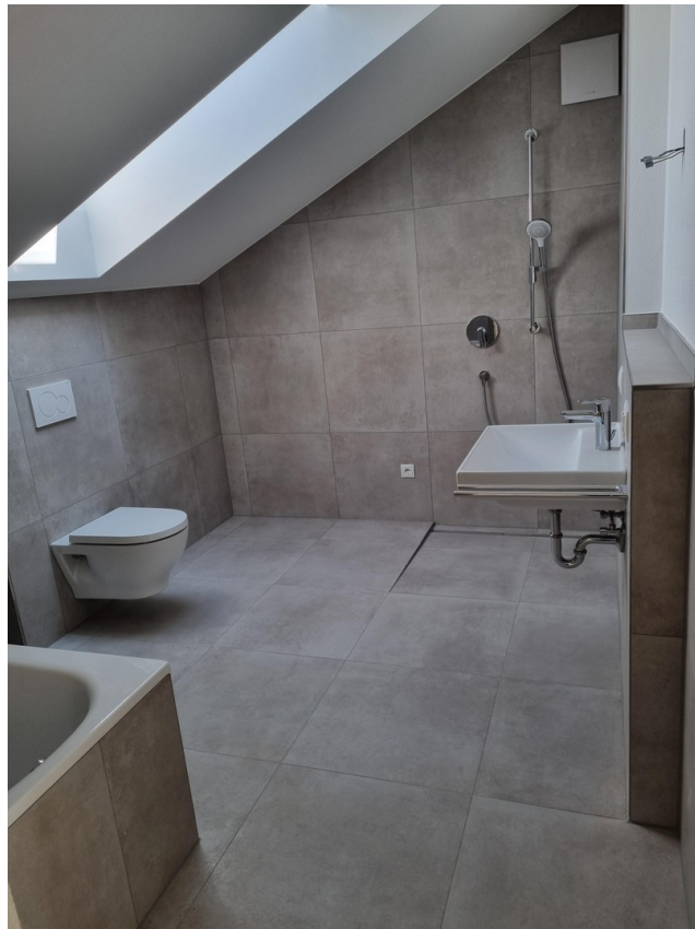
modernes zeitloses Bad