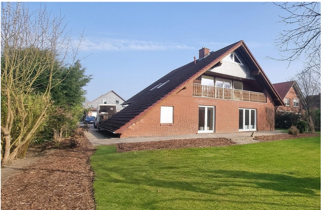
Rückseite mit Garten