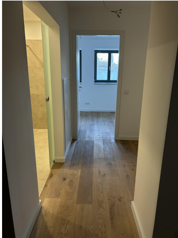
Flur zum 1. Zimmer und Bad