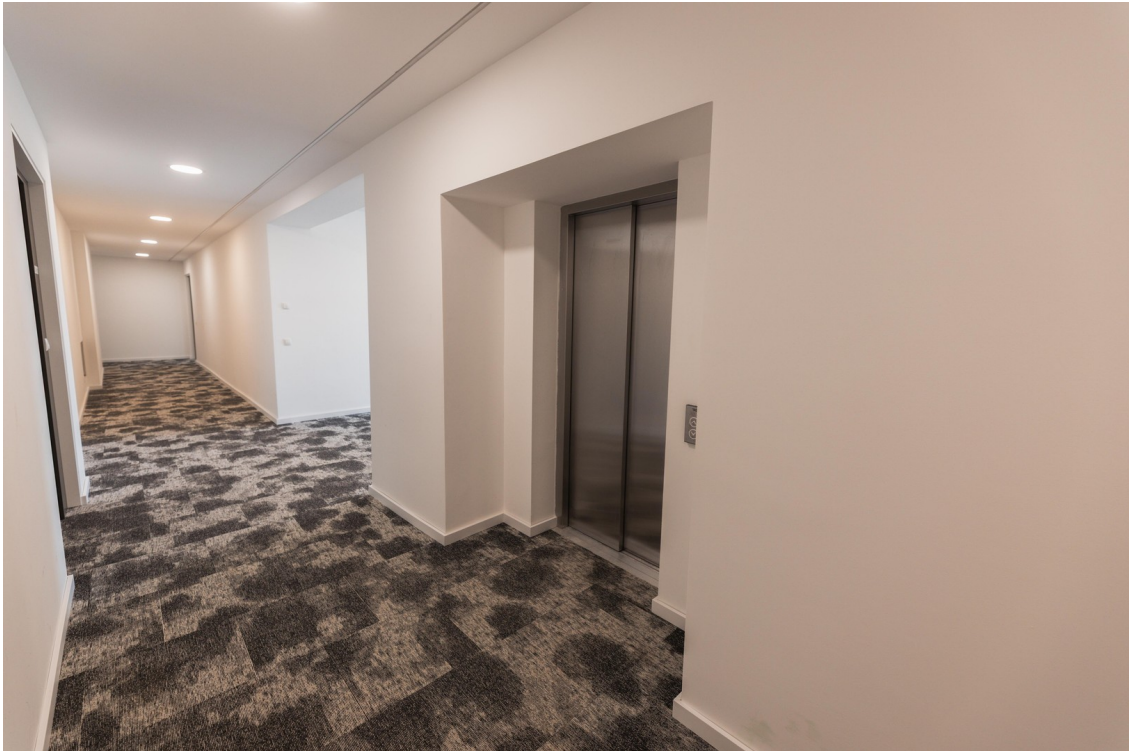
Flur zum Aufzug