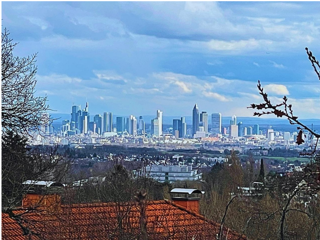
Skylineblick auf FFM