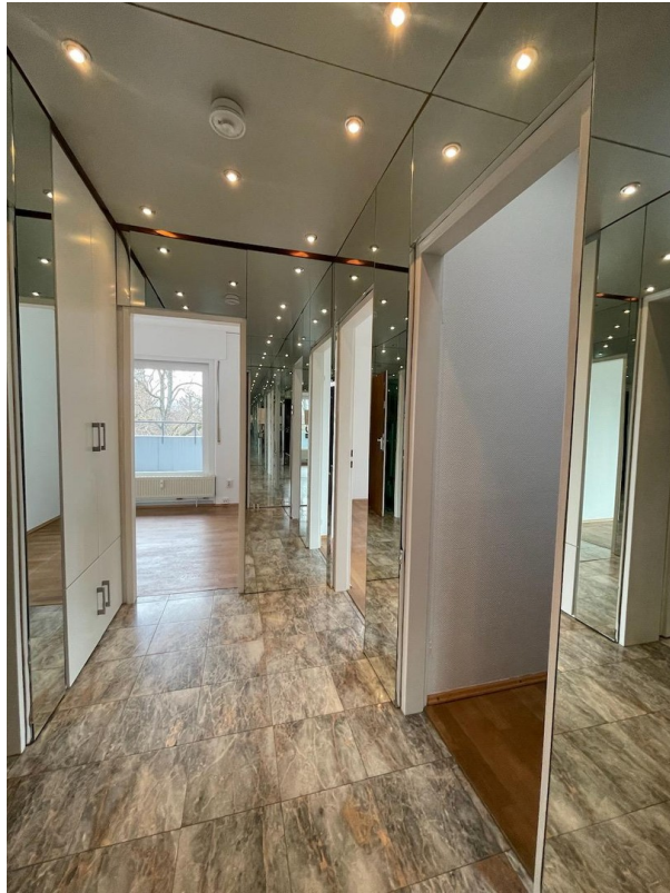
Flur mit Einbauschränk