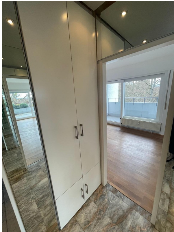
Einbauschränk im Flur