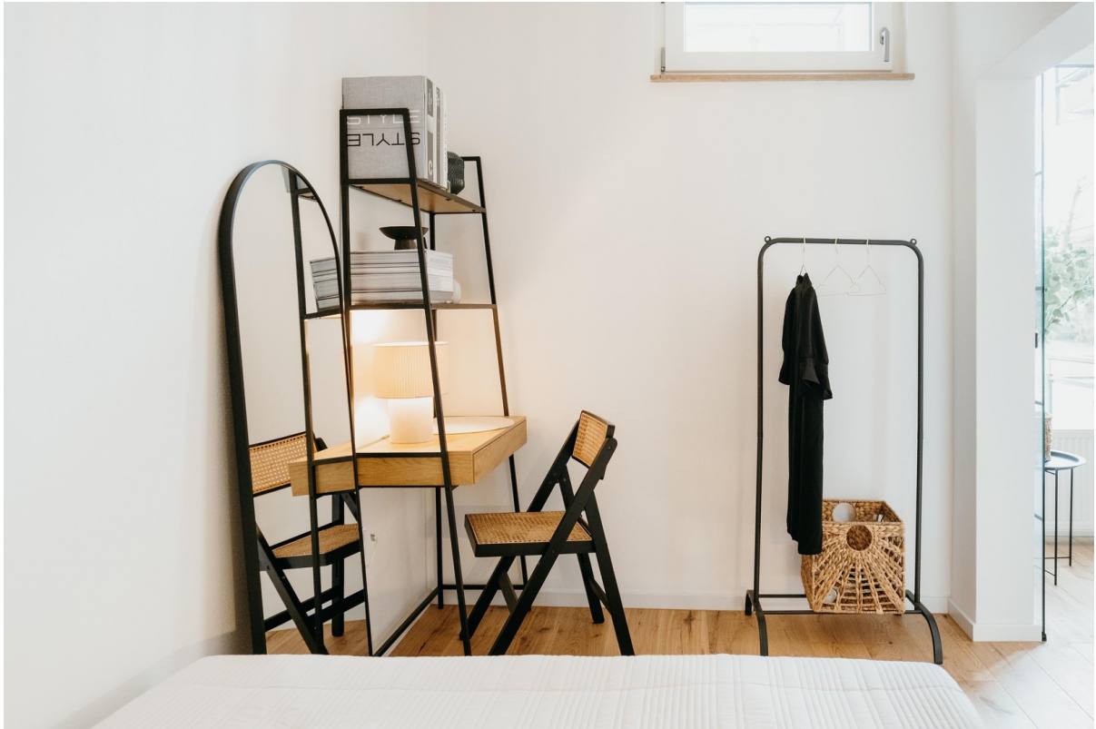
Schlafzimmer m. Arbeitsbereich