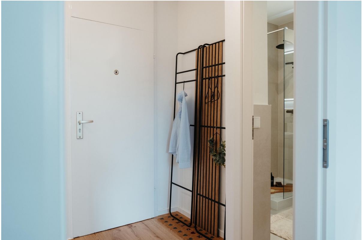
Garderobe im Flur