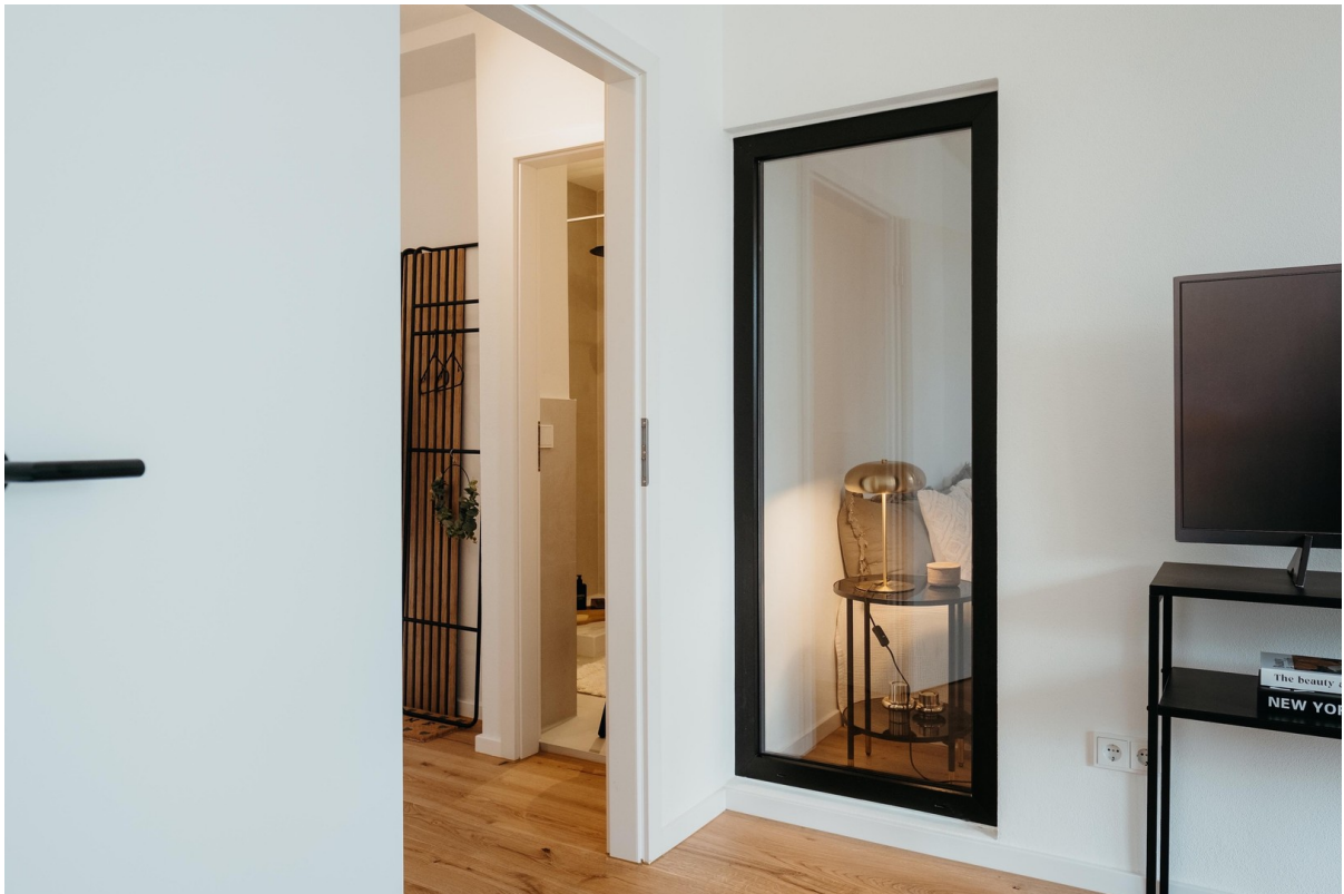
Innenraumfenster im Loft-Stil