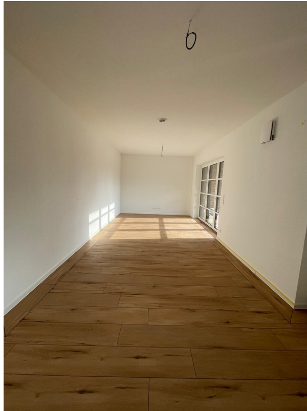
offener Wohn.-/ Essbereich