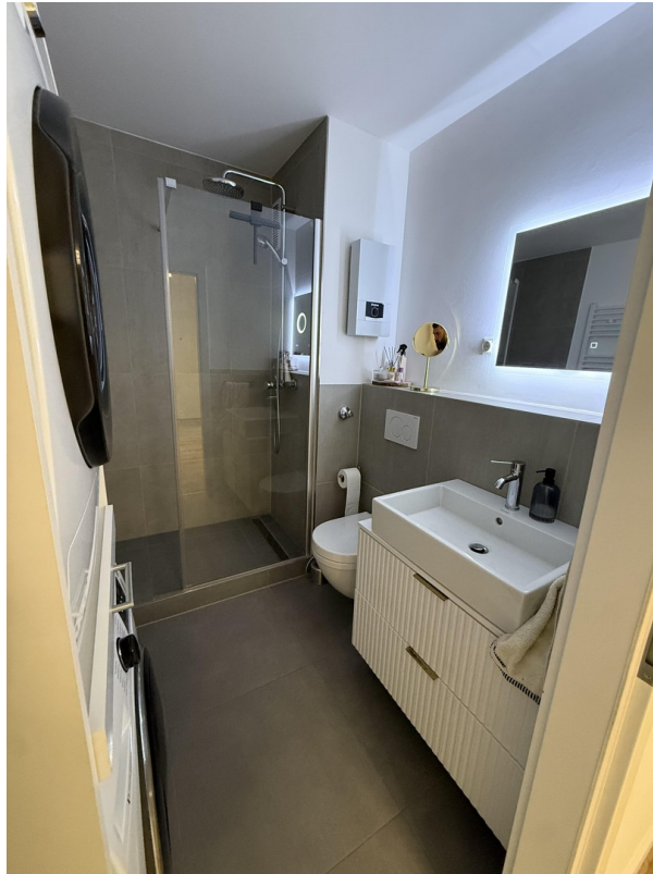
Dusch-Bad untere Etage