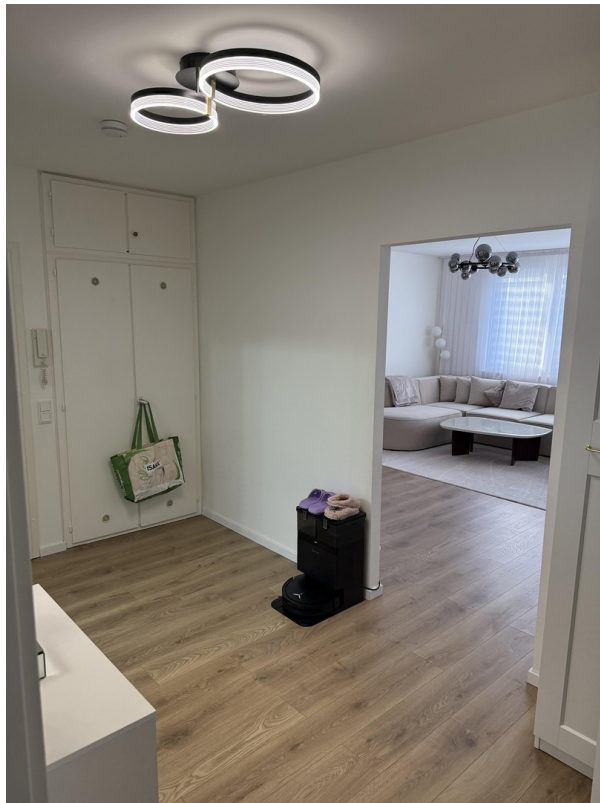
Flur & Einbaunische