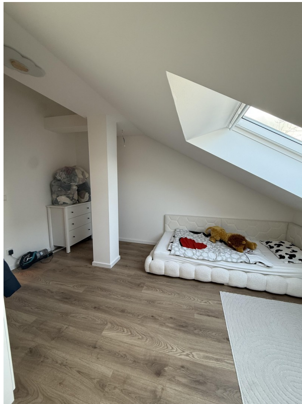
Zimmer 1 - obere Etage