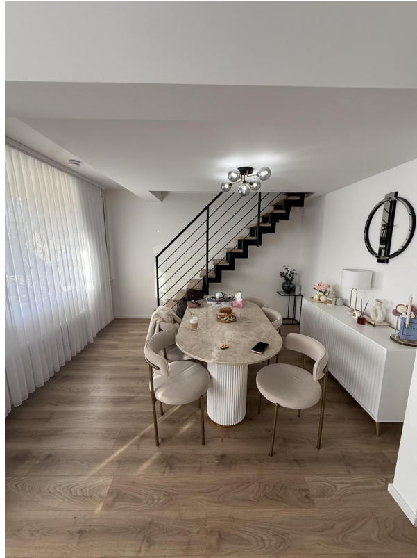
Essbereich & Treppenaufgang