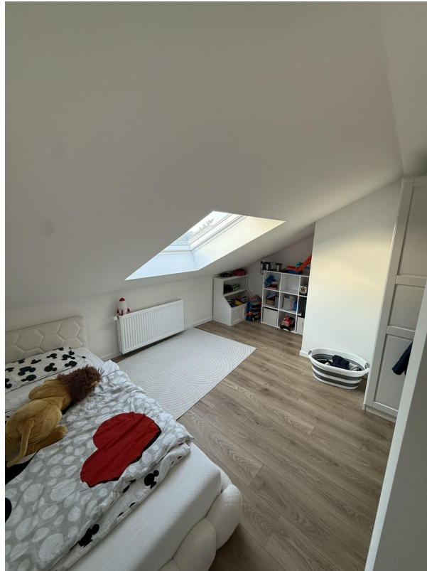
Zimmer 1 - obere Etage