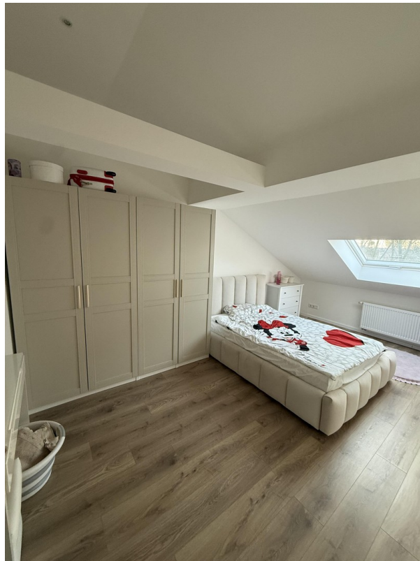
Zimmer 3 - obere Etage