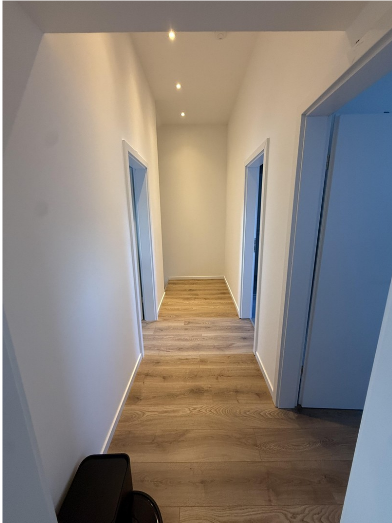
Flur obere Etage