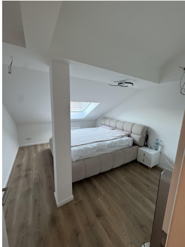
Zimmer 2 - obere Etage