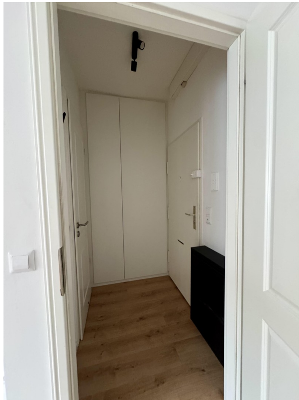
Flur mit Einbauschränk