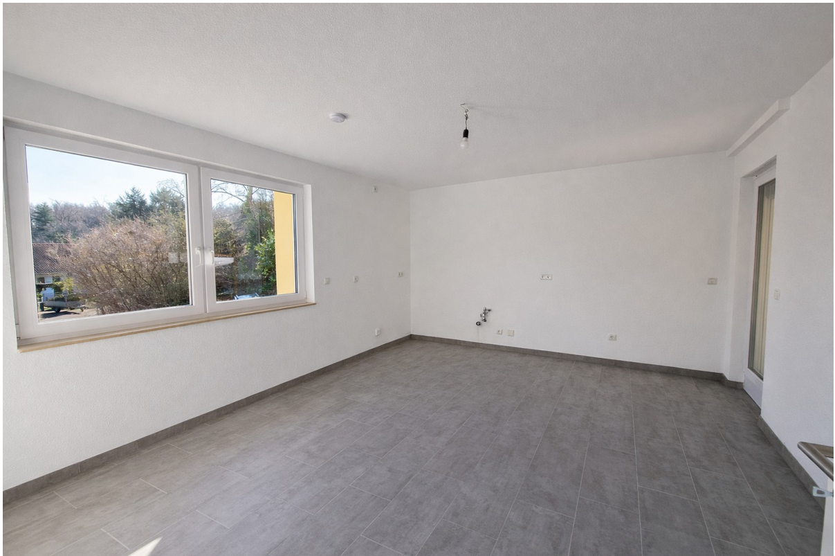
Große Küche mit Balkonzugang