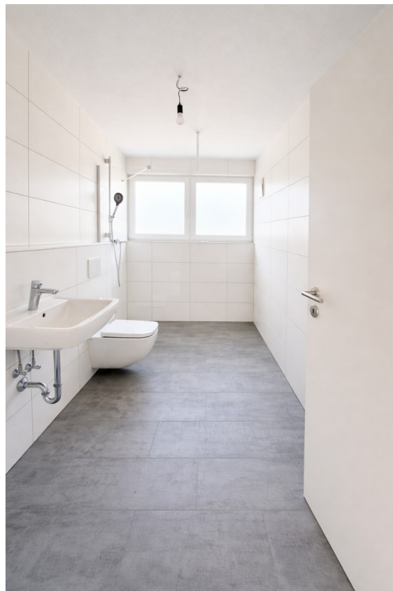
Helles, modernes Badezimmer