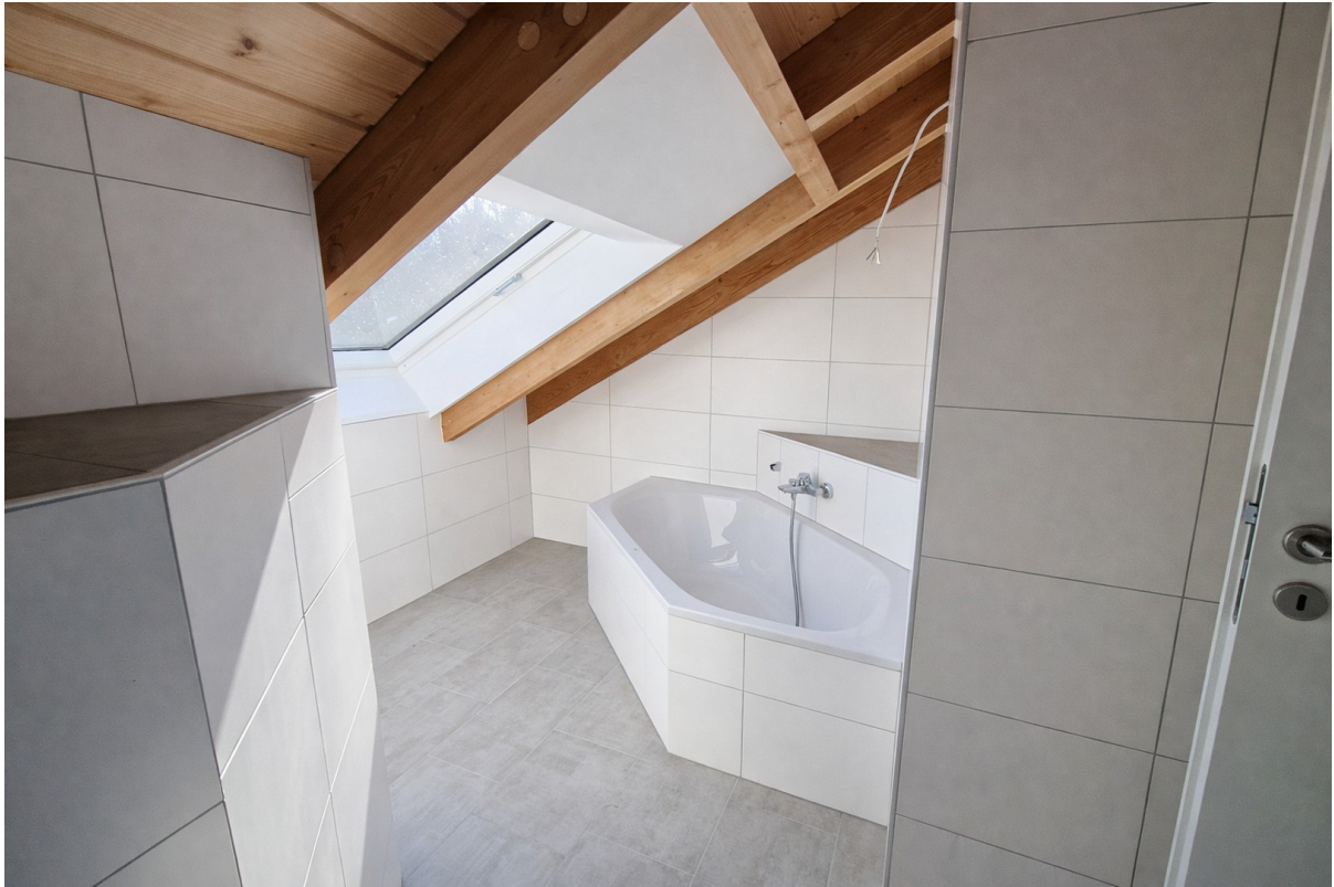
Helles Bad im DG mit Badewanne