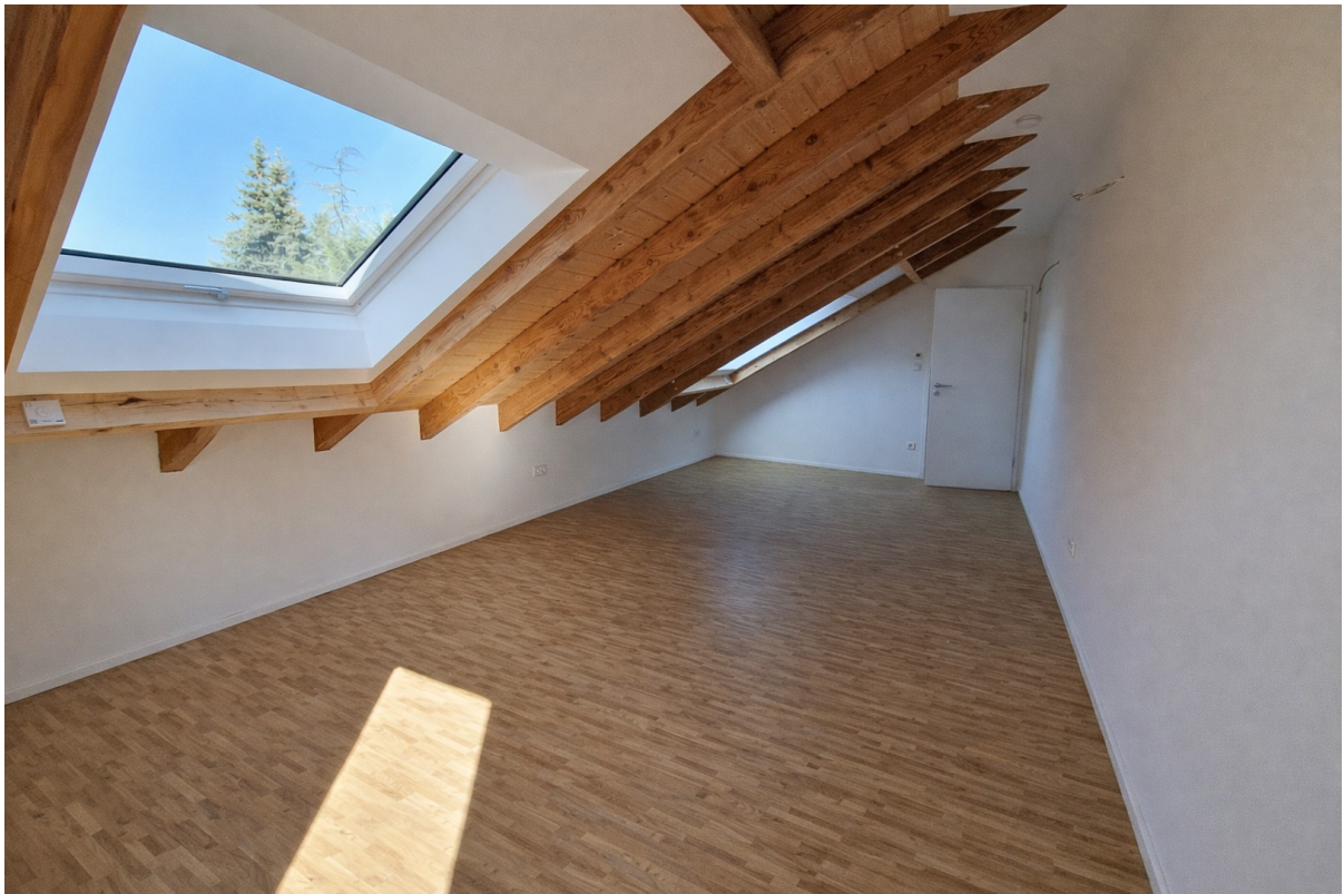
Großes Dachzimmer 2