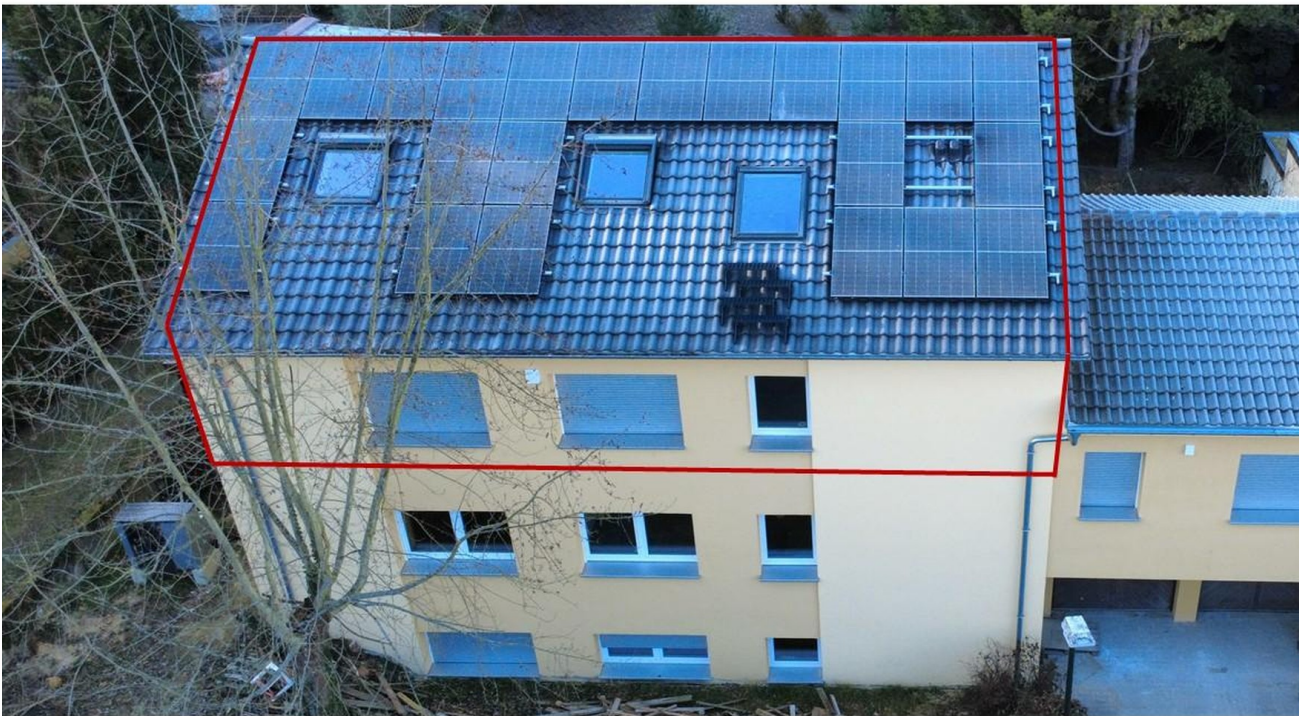
Lage der Wohnung im Objekt