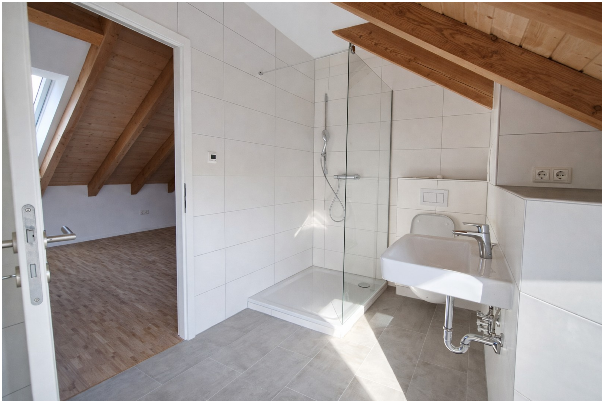
Neues Bad im DG