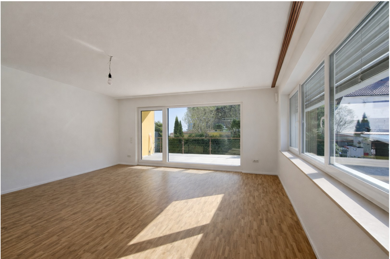
Großer Balkon nach Süd-West