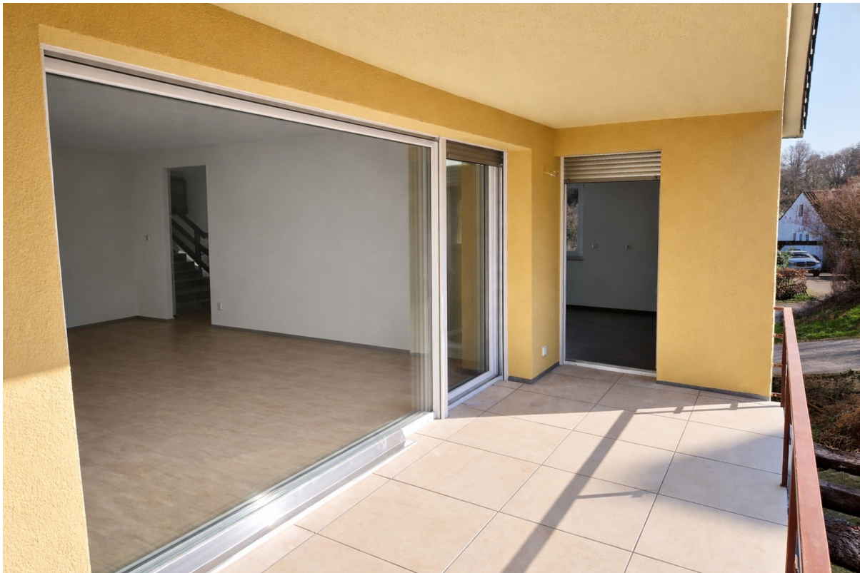
Großer Balkon nach Süd-West