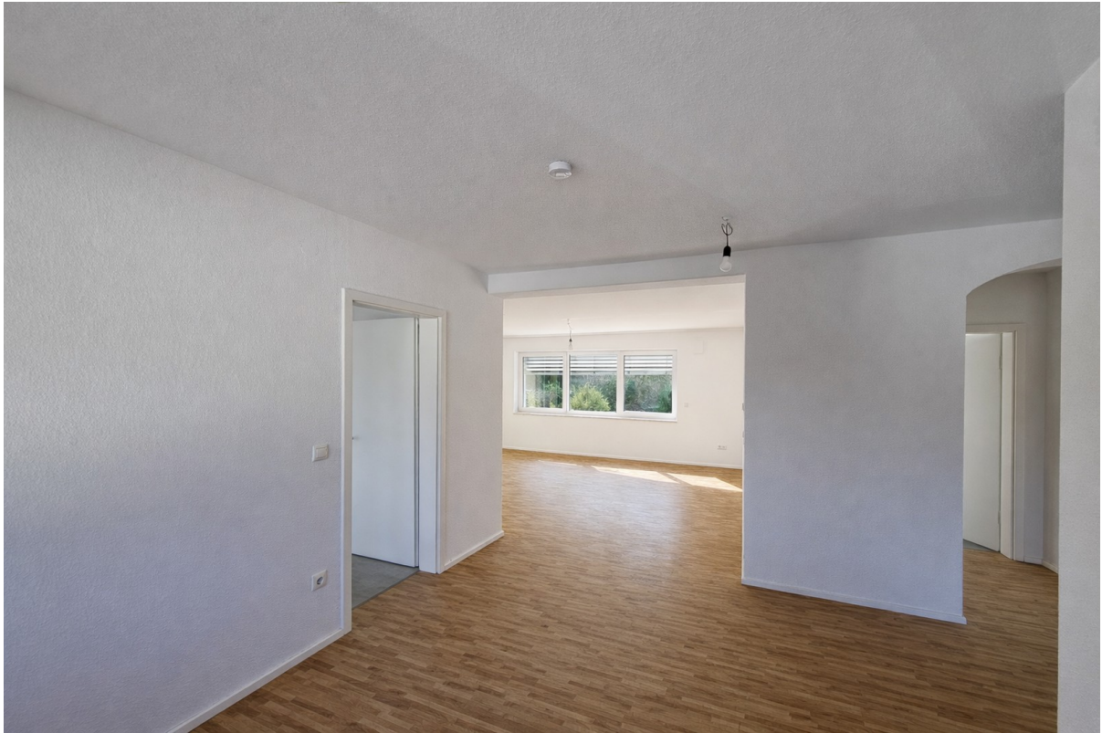
Großzügiger Wohn- Essbereich