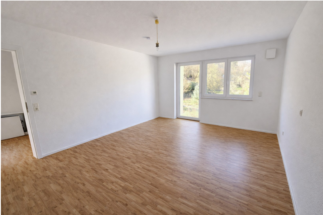
Schlafzimmer mit Gartenblick