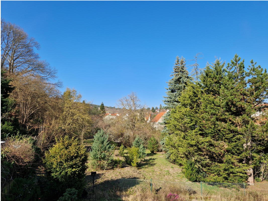
Blick aus dem WZ/Balko