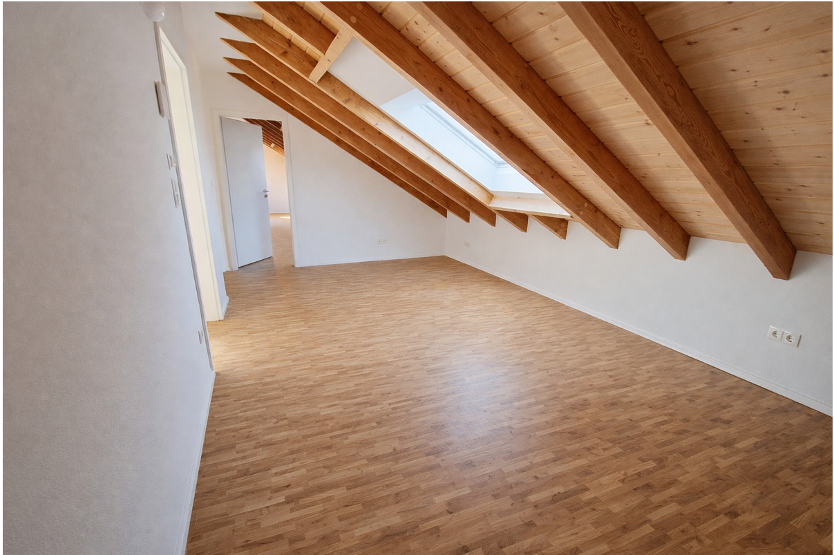
Großes Dachzimmer 1