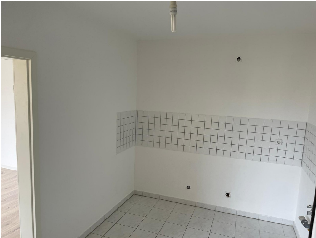
Küche 1 (ohne Küche)