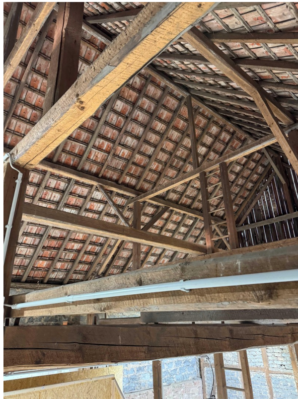
Dach, hohe Lagerfläche