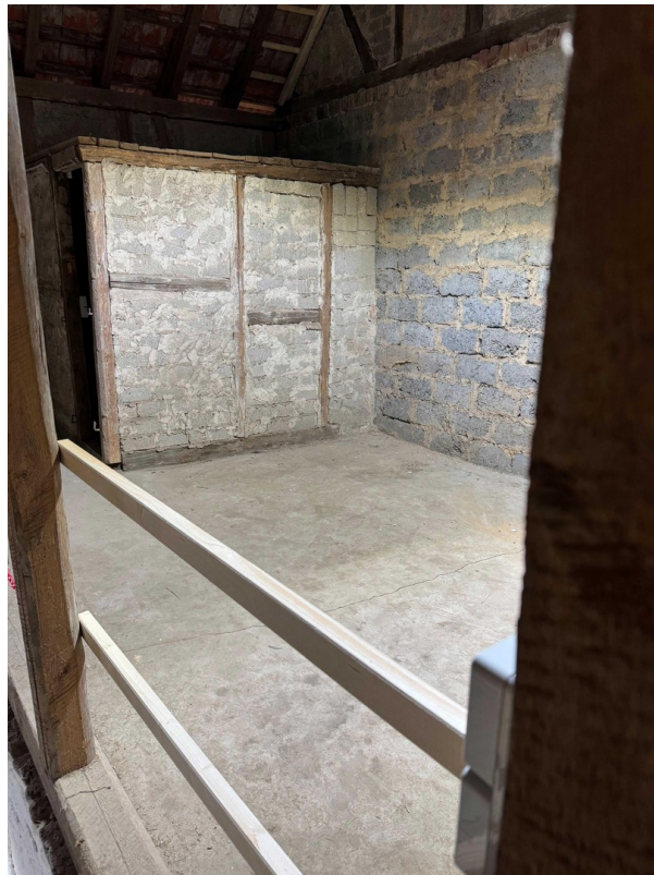
Linker Lagerbereich n. vorne