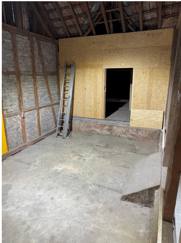
Rechter Lagerbereich n. vorne