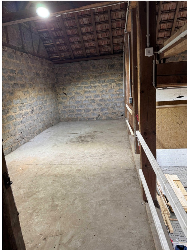
Linker Lagerbereich n. hinten