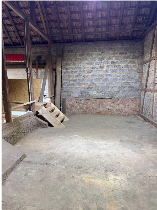
Rechter Lagerbereich n. hinten