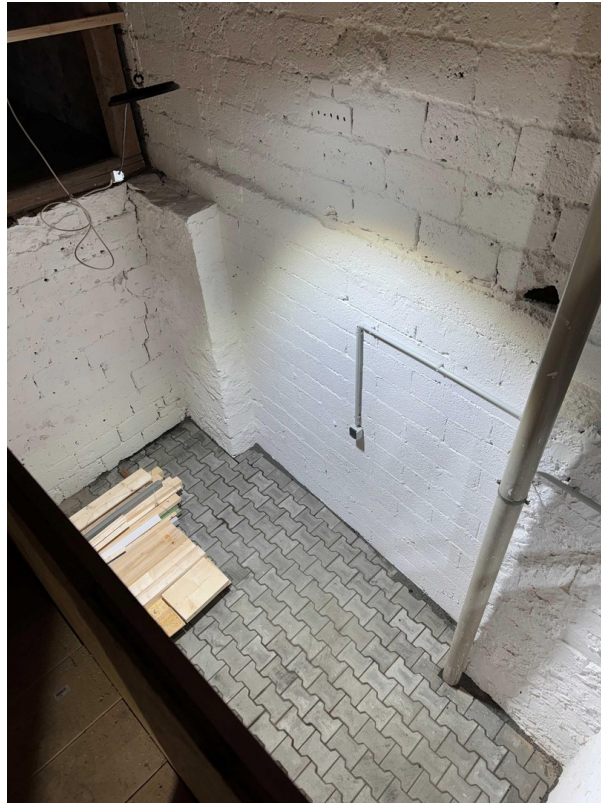
Blick vom Übergang nach unten