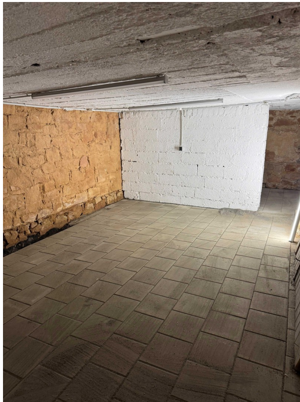
Keller groß Eingang