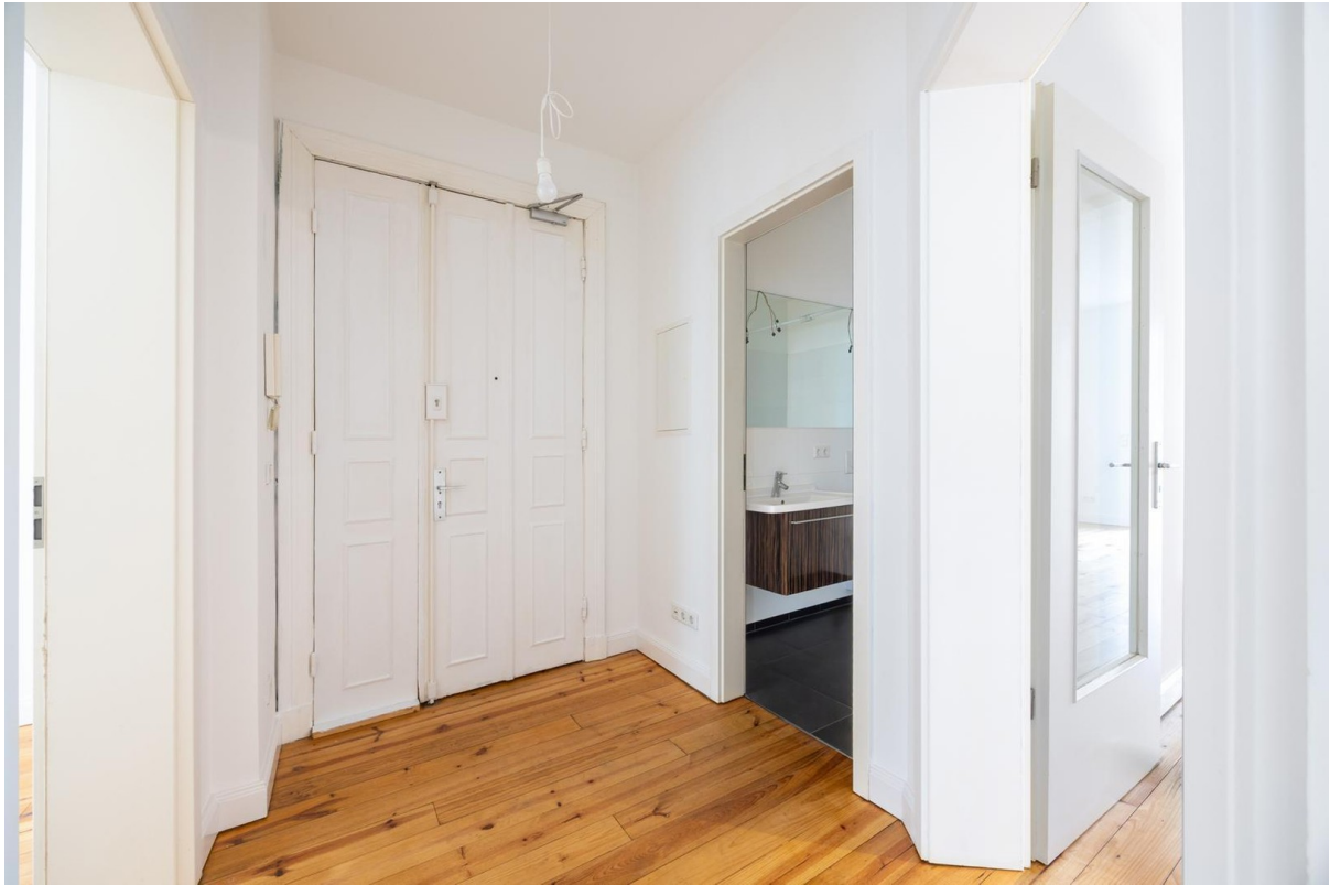
Flur Richtung Ausgang