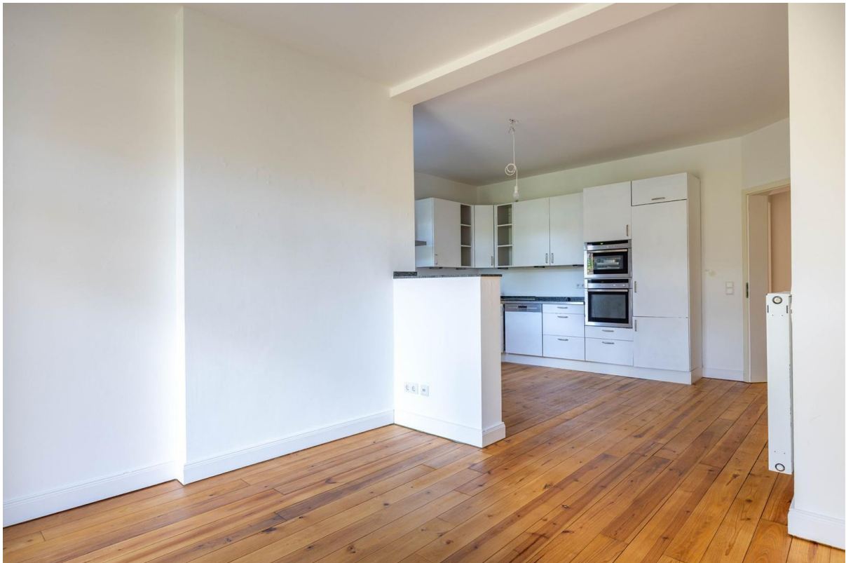
blick in die Küche