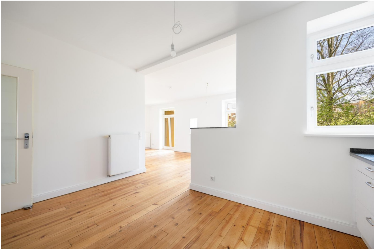
Blick aus Küche ins Wohnzimmer