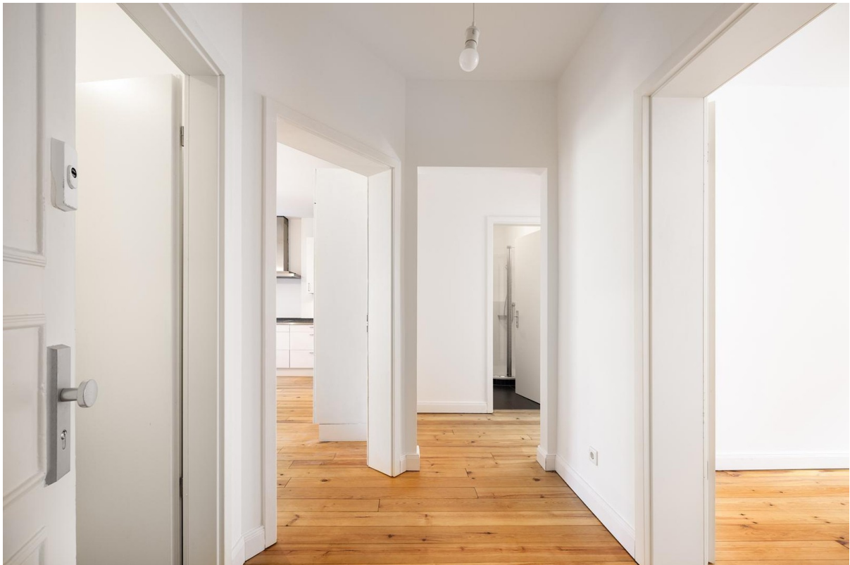
Flur ab Eingang