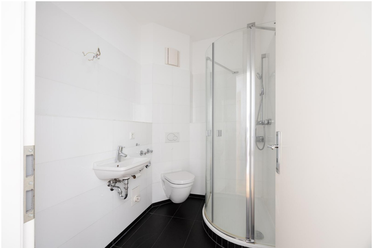
Bad 2 mit Dusche