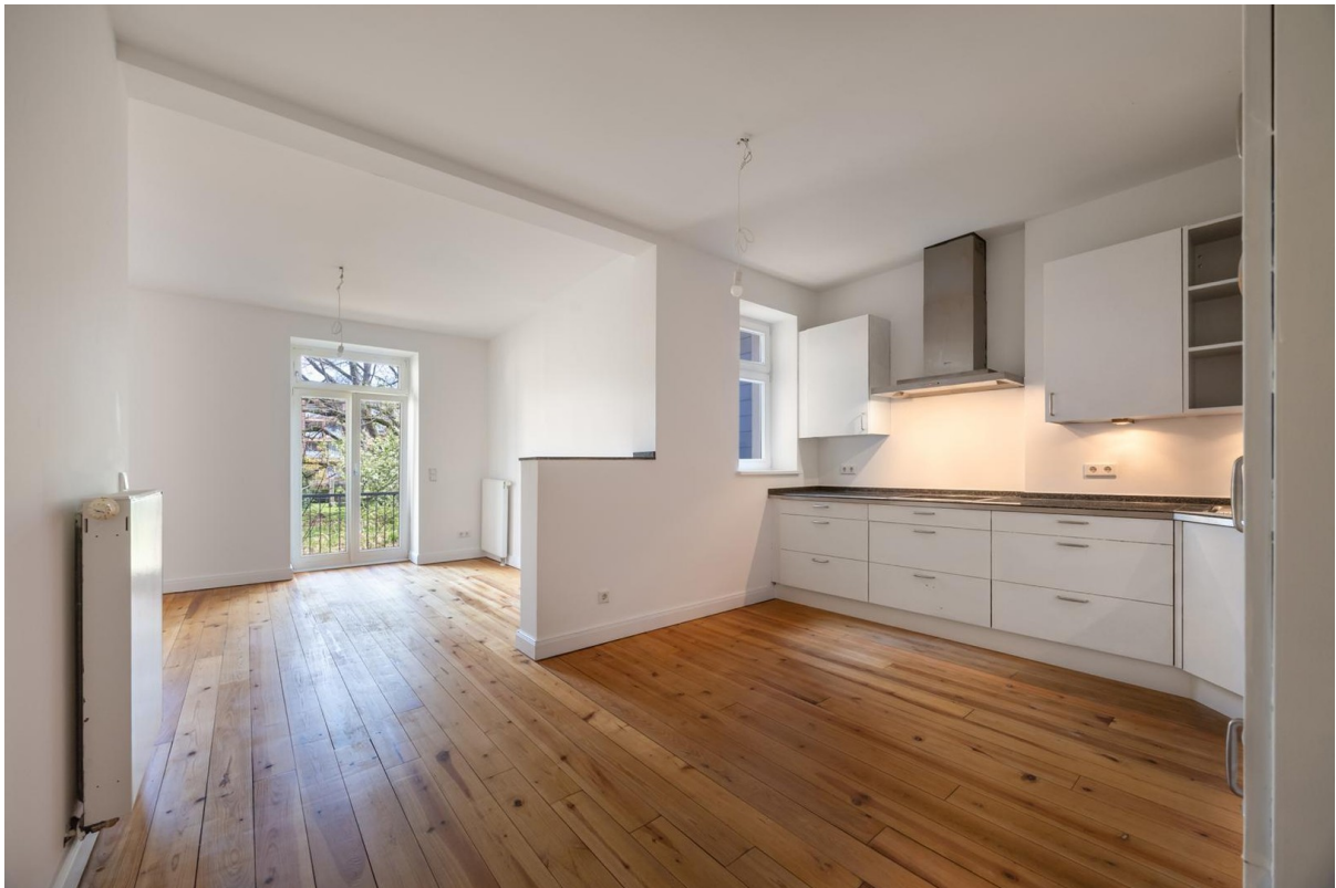
Blick ins Wohnzimmer