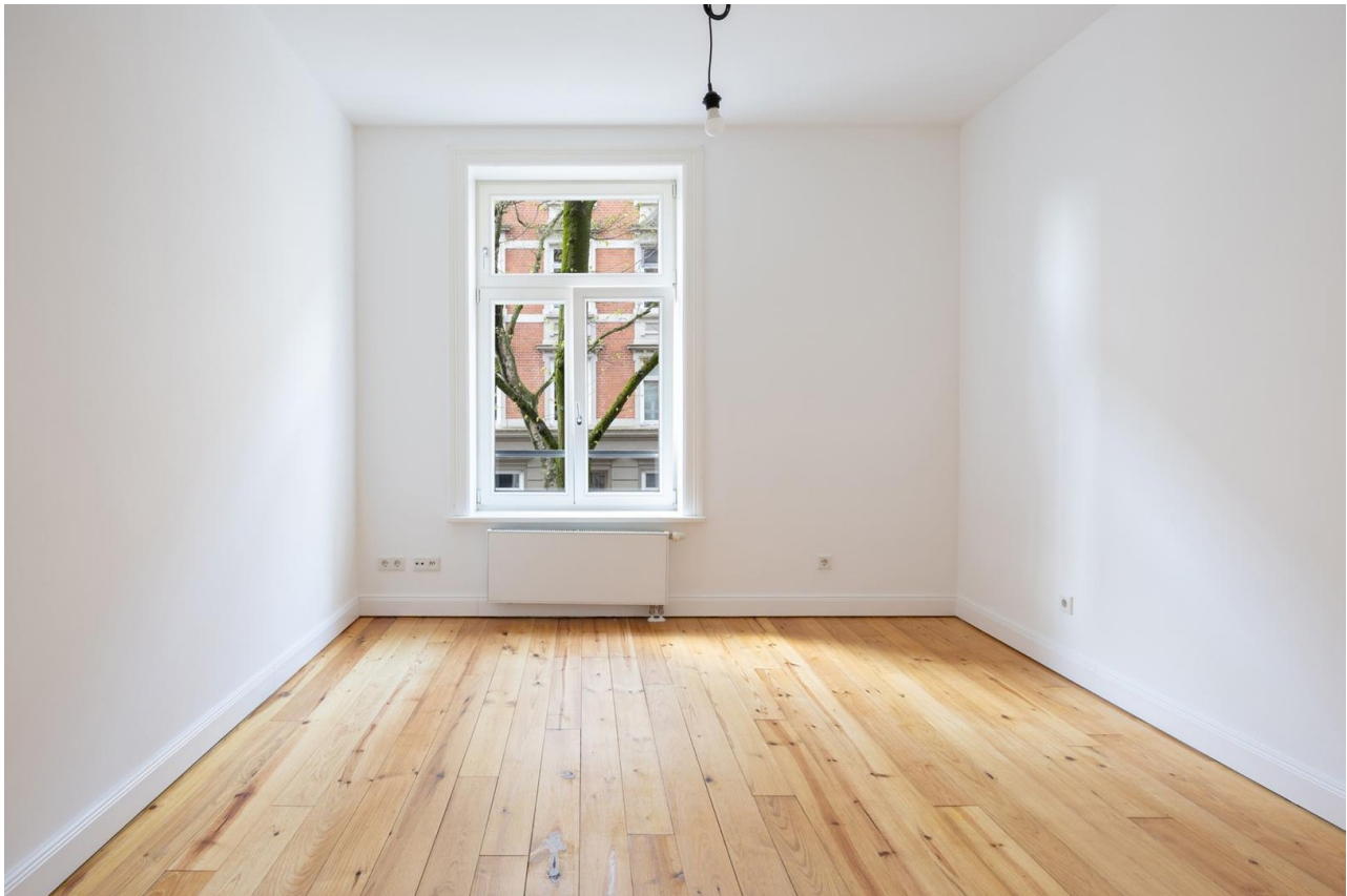
Zimmer 1 rechts