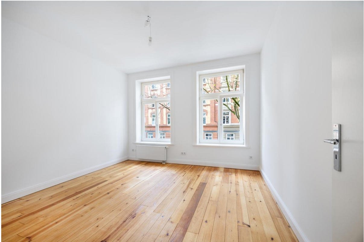
2 Zimmer rechts