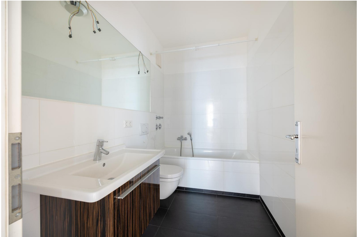
Bad 1 mit Badewanne