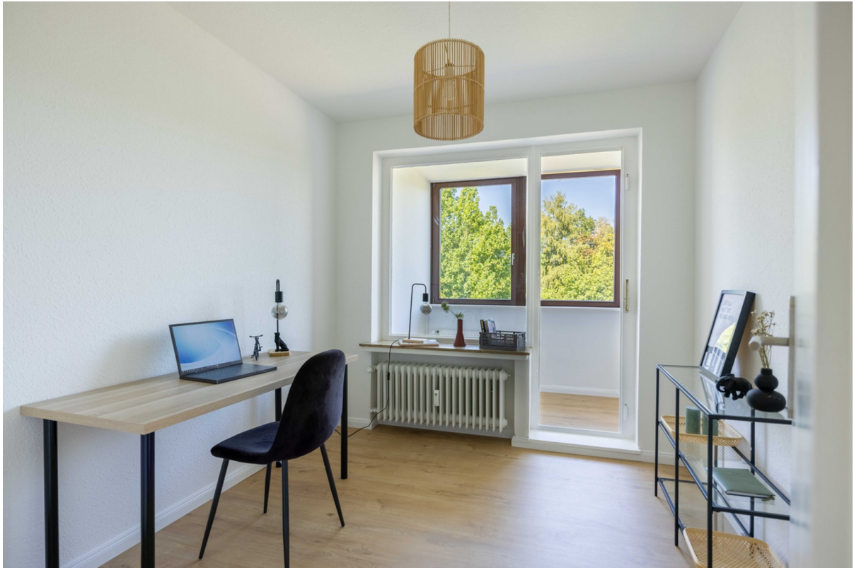
Büro / Kinderzimmer