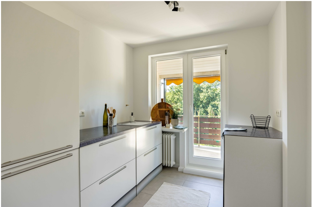
Küche mit Zugang zum Balkon