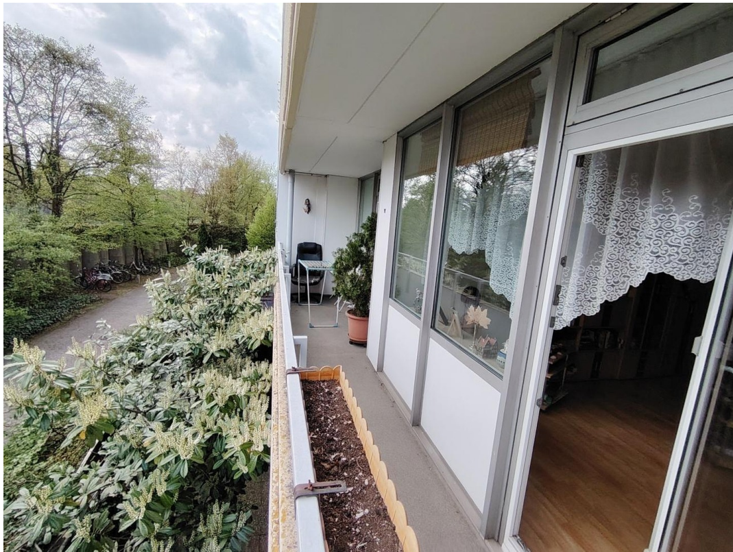
Südbalkon über zwei Zimmer