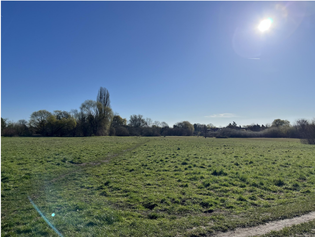
Sonnenaufgang v d Grundstück