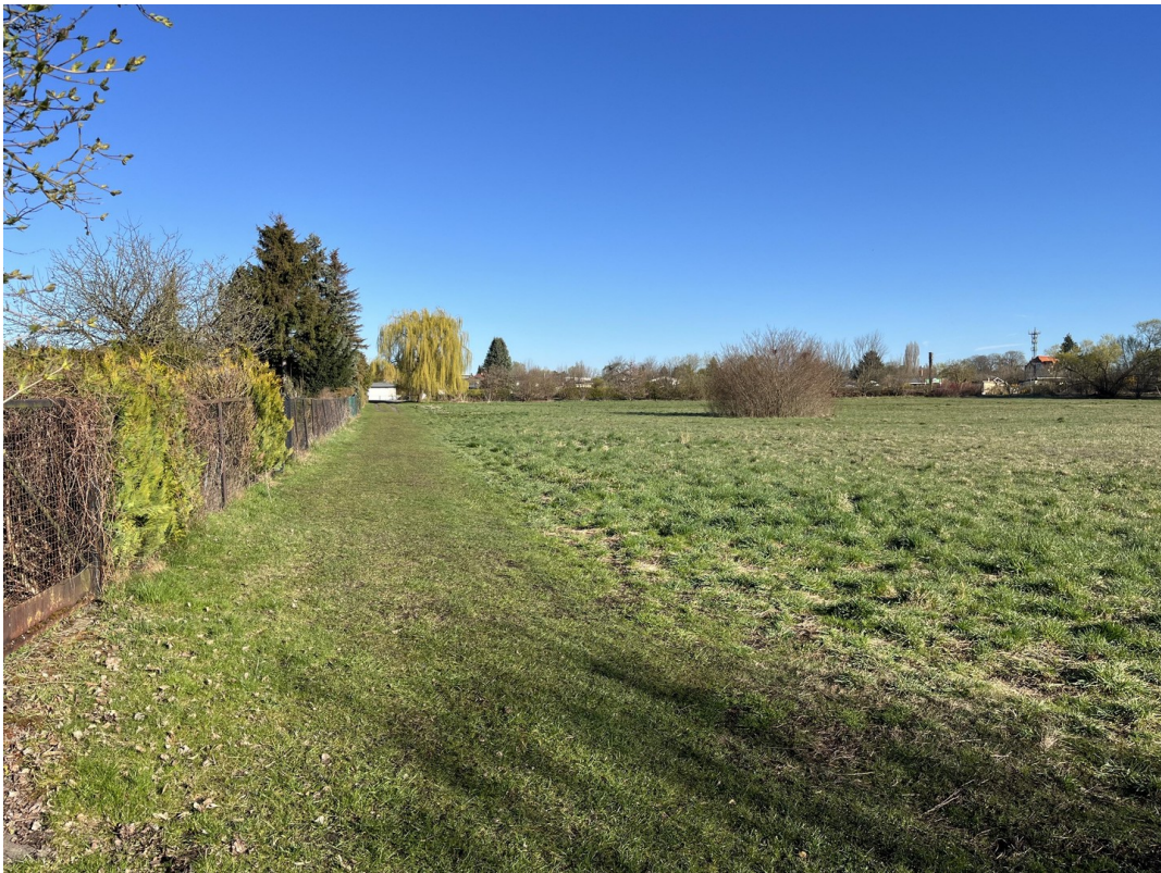
an der Wiese entlang