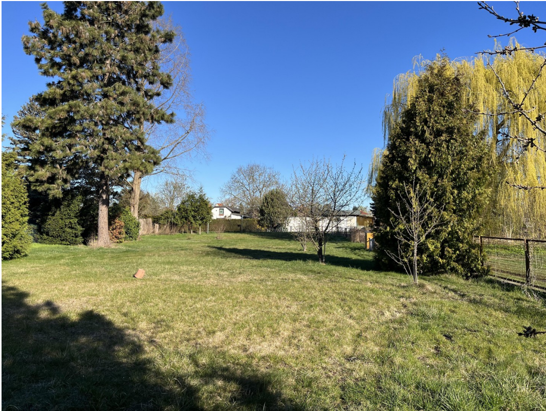
das Grundstück Richtung Westen