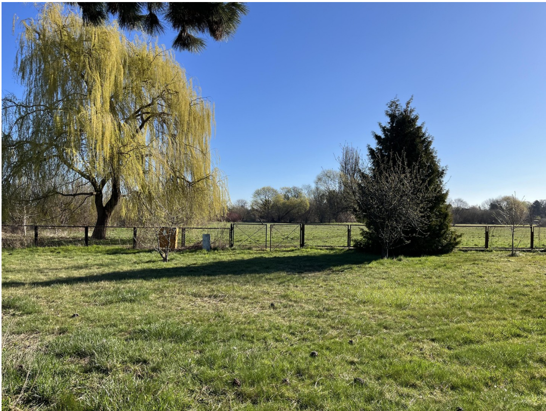
Blick zur Zingerwiese