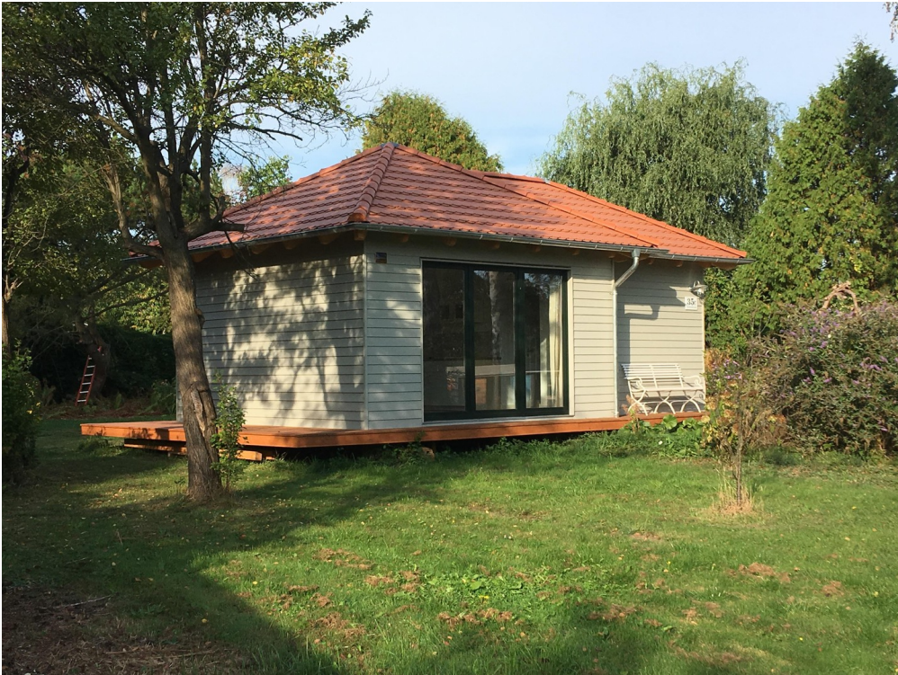
Gartenhaus laut Planung Sommer