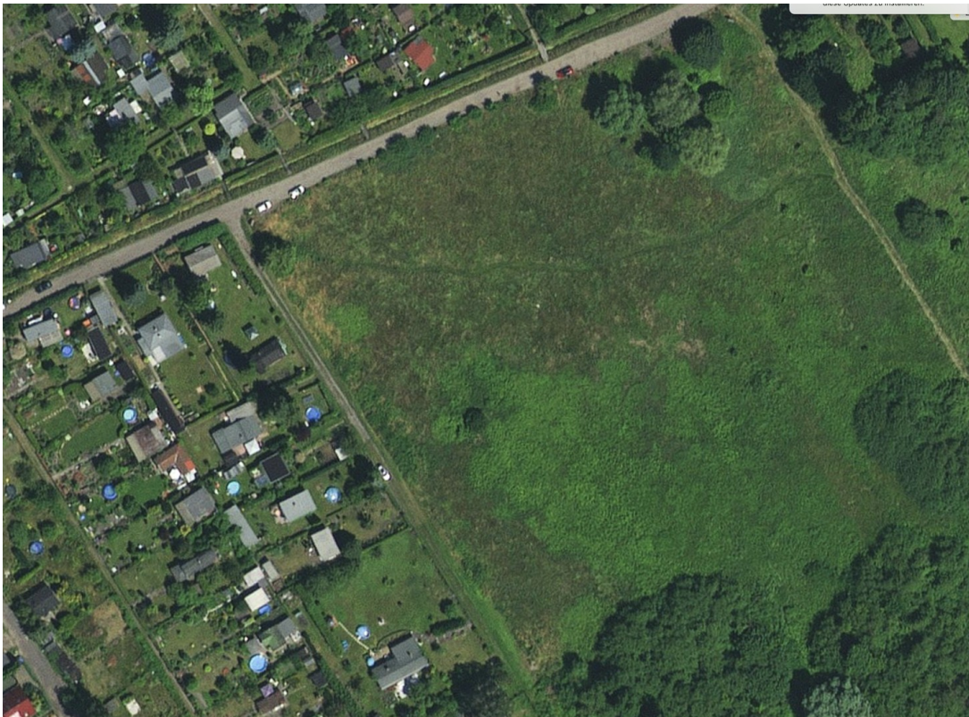
Luftbild auf die Wiese v d Gru