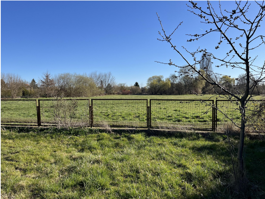
Blick zur Wiese