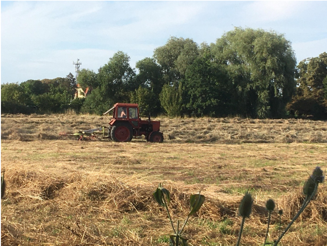
Herbstimpression vor dem Grund