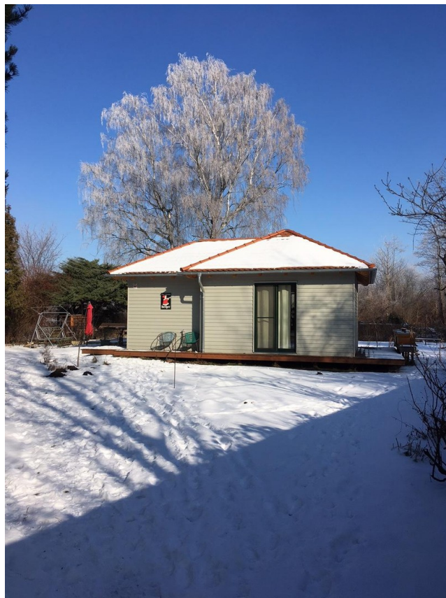
Gartenhaus laut Planung Winter