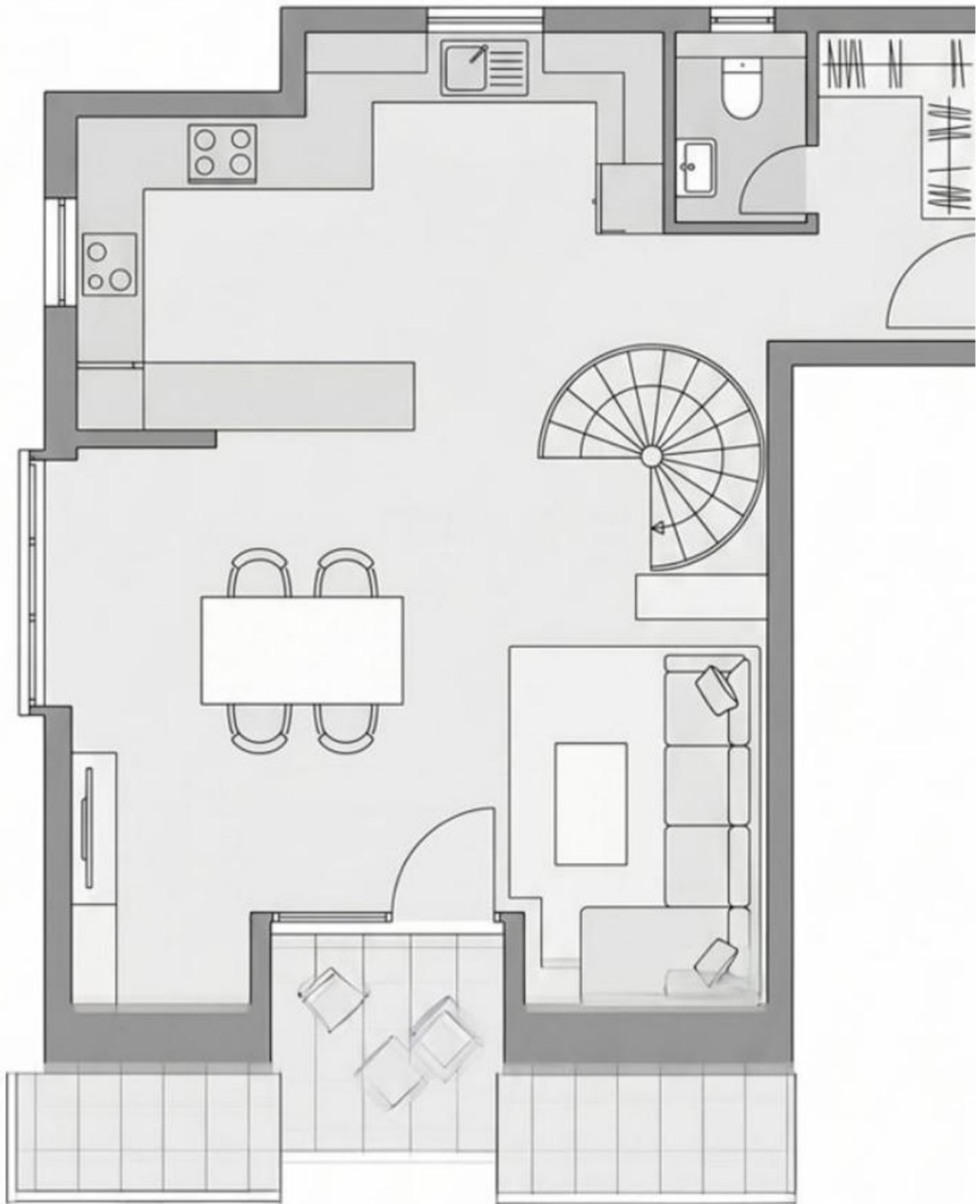
Grundriss untere Etage