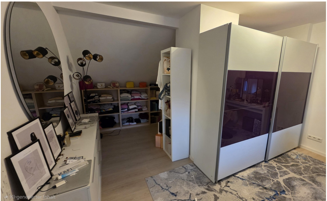
Schlafzimmer 4 OG mit Ankleide