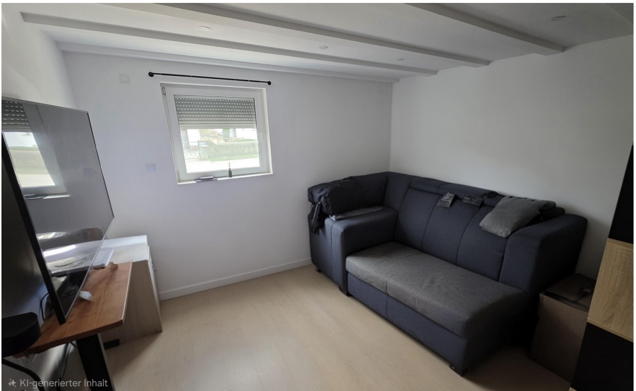
Schlafzimmer 2 EG