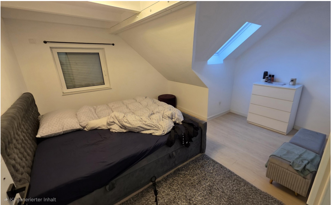
Schlafzimmer 3 OG