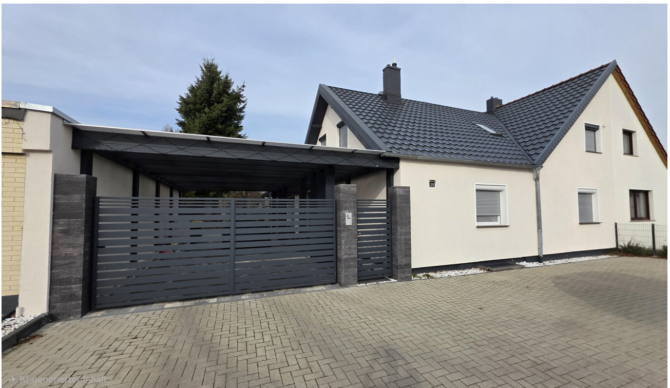
Tor- / Hausansicht