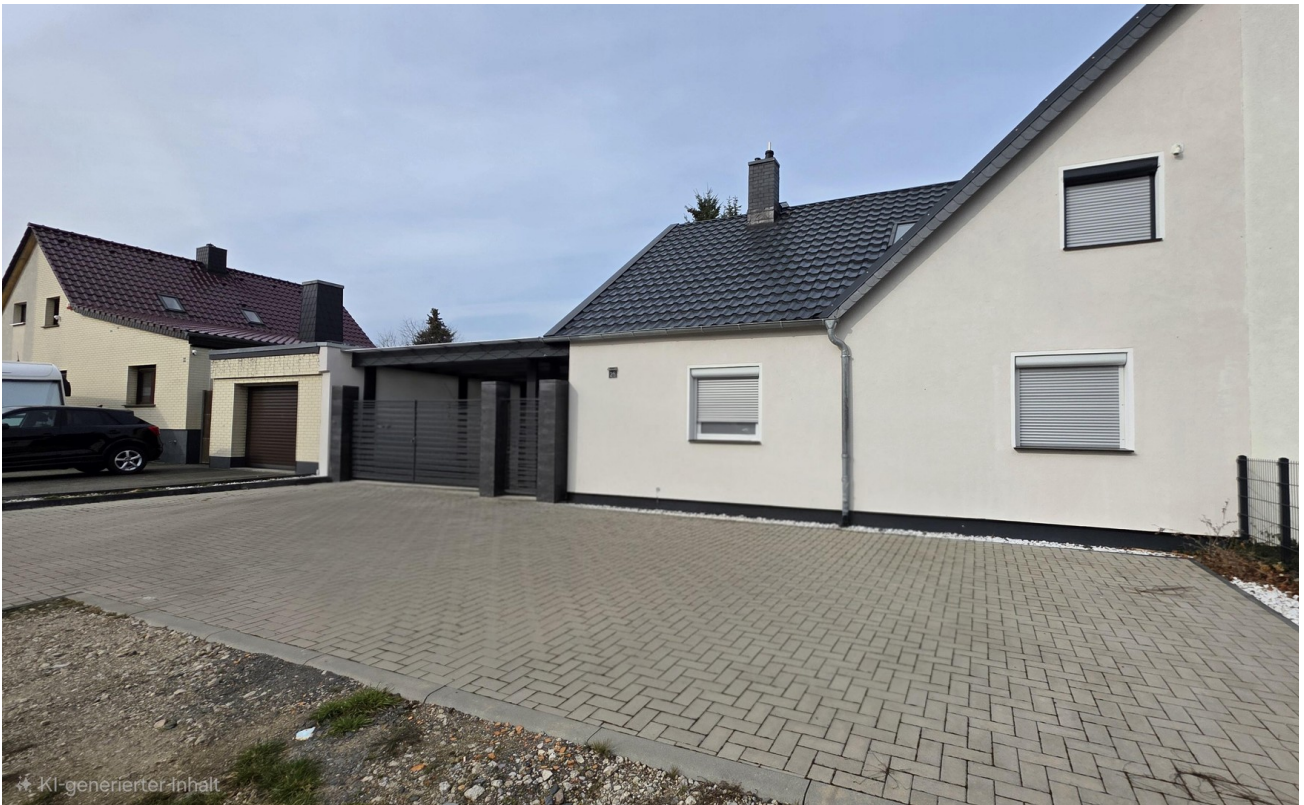
Tor- / Hausansicht