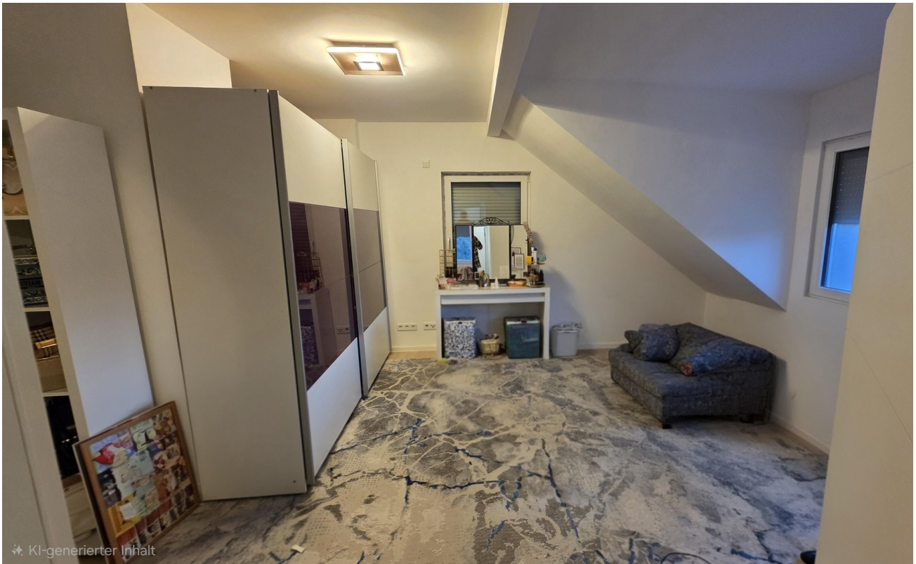
Schlafzimmer 4 OG