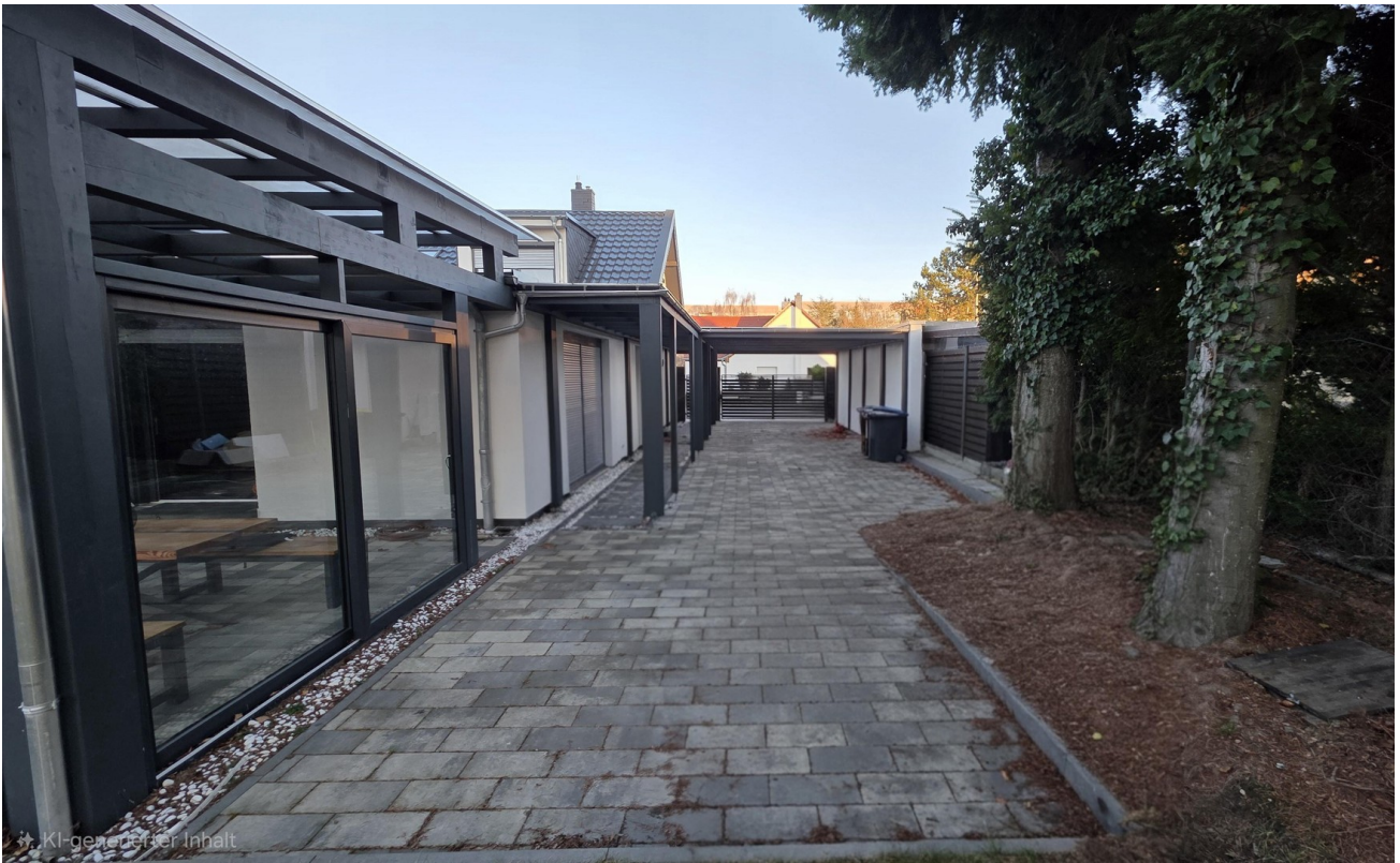
Einfahrt / Carport