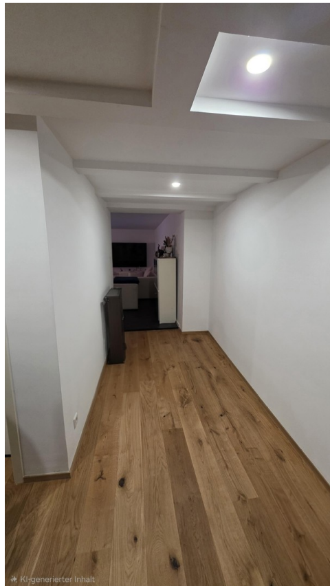
Flur / Durchgang WZ