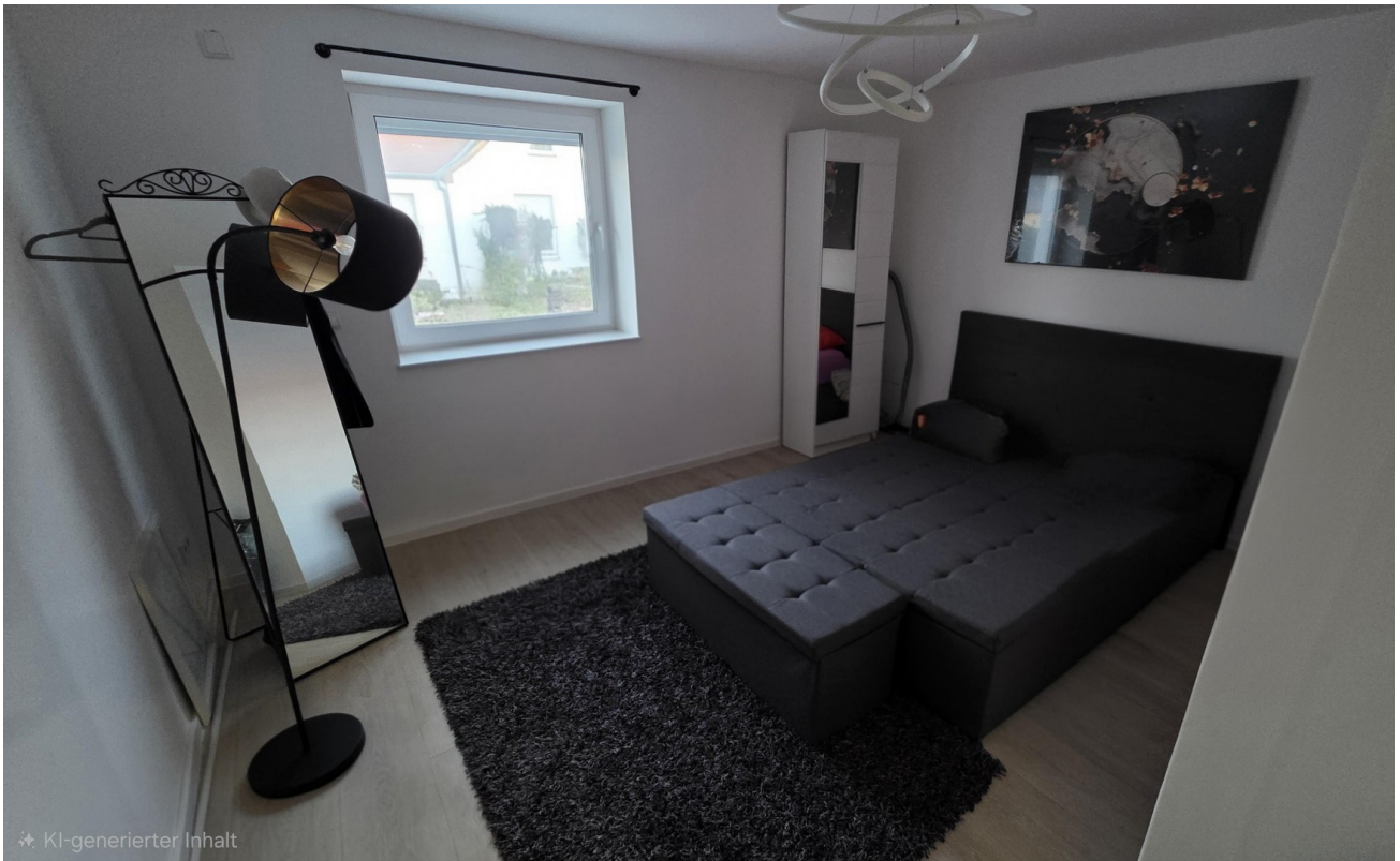
Schlafzimmer 1 EG