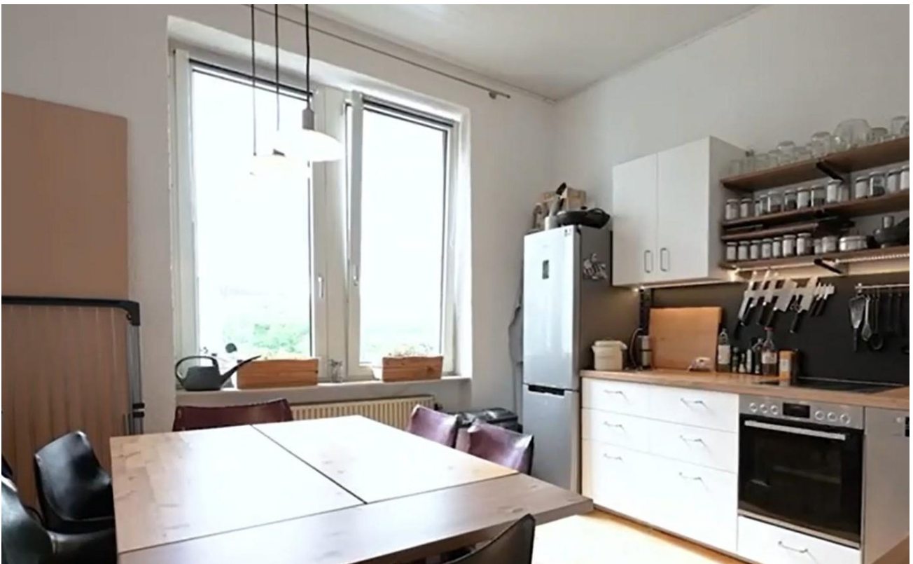
2.OG links Küche