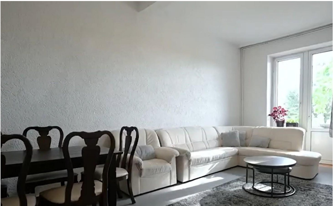
2. OG rechts