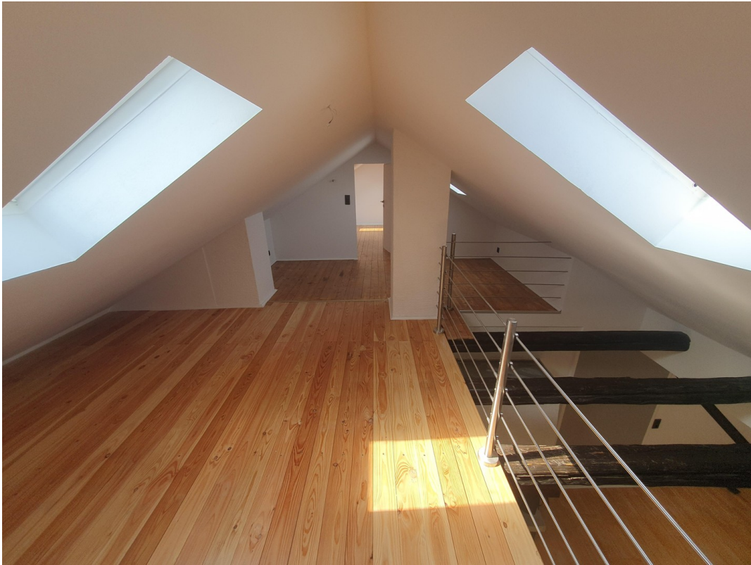
Dachg. rechts Spitzboden