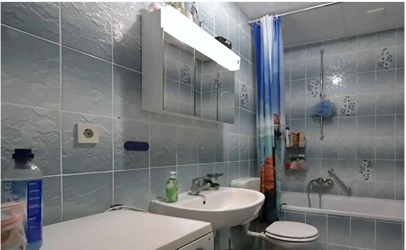
2. OG Bad rechts