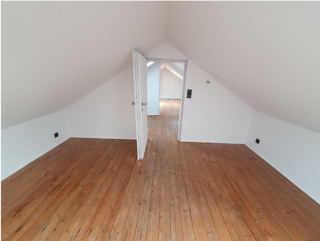
Dachg. rechts Spitzboden