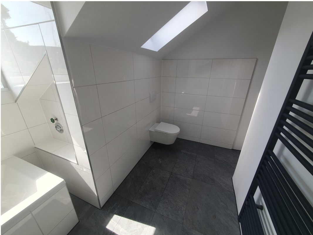
Wohnung Dachg. Bad rechts