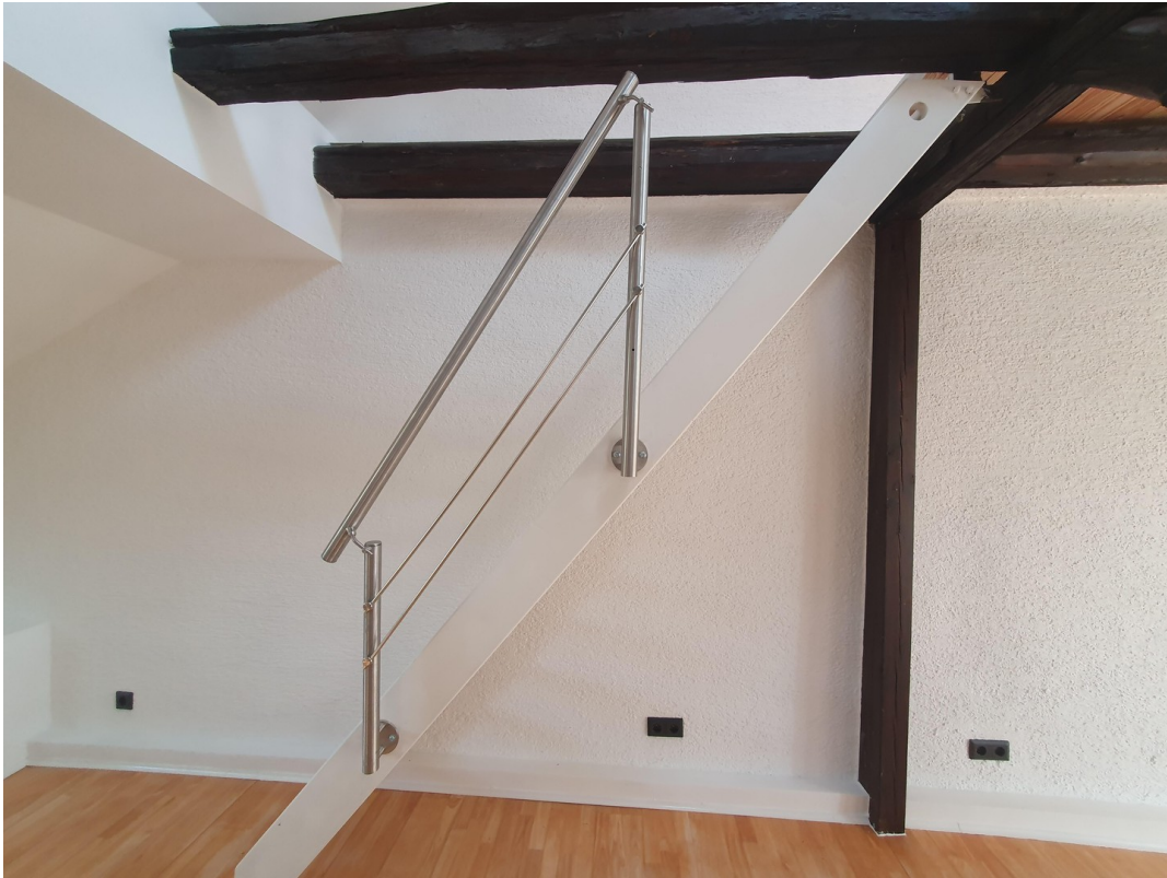
Wohnung Dachgeschoss rechts