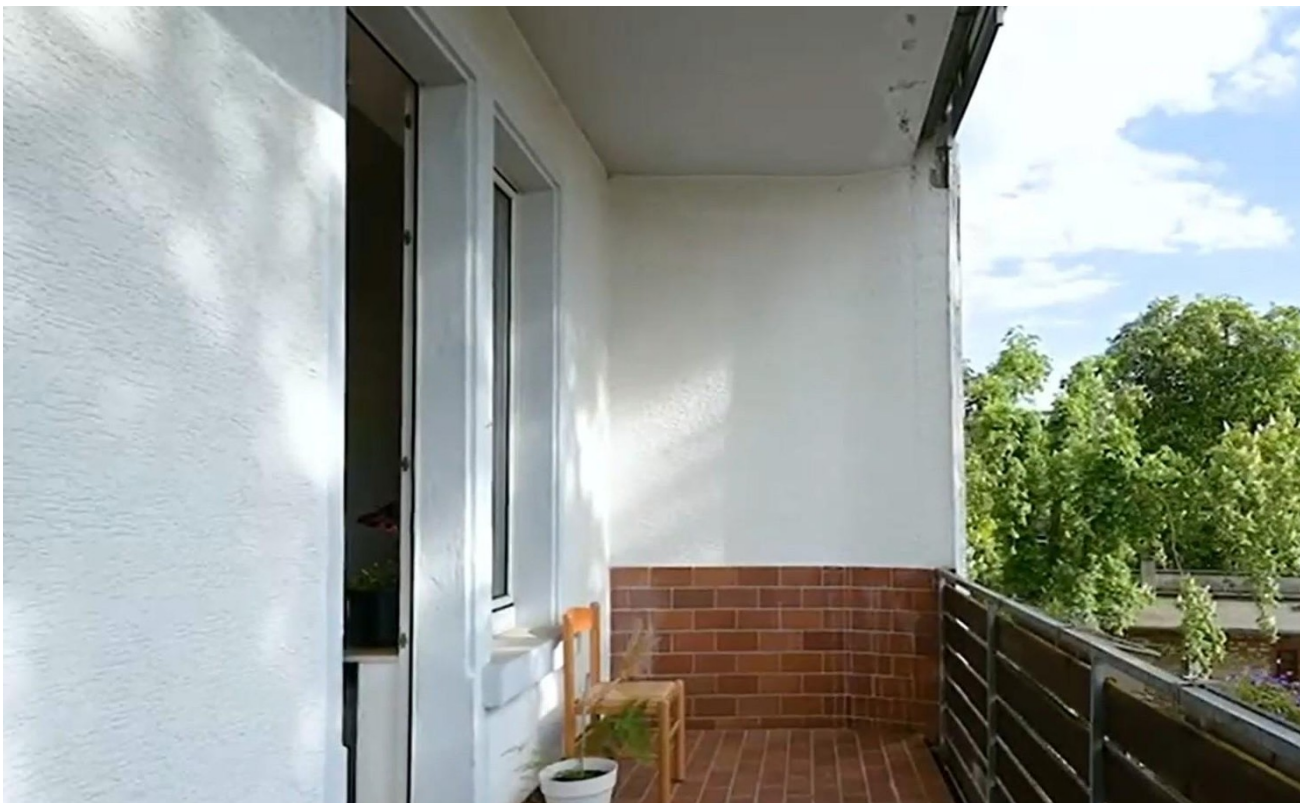
2.OG rechts Balkon