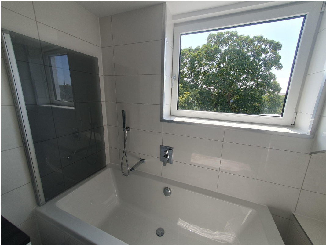
Wohnung Dachg. Bad rechts