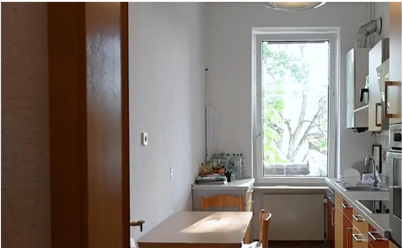
2.OG rechts Küche