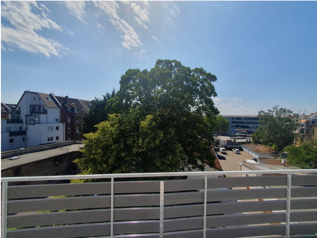
Wohnung Dachgeschoss rechts