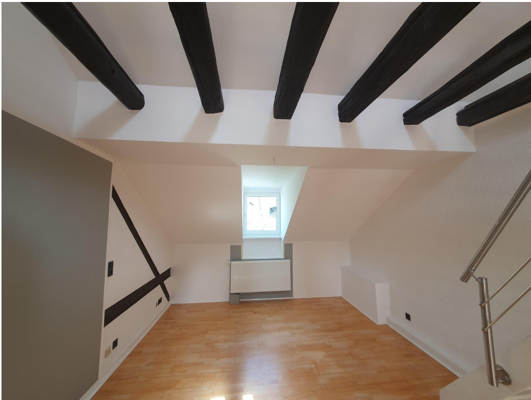
Wohnung Dachgeschoss rechts