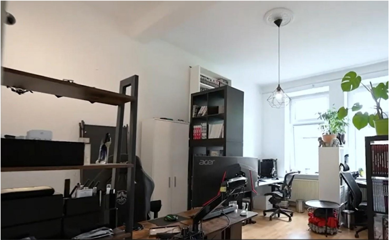
2.OG links, Zimmer