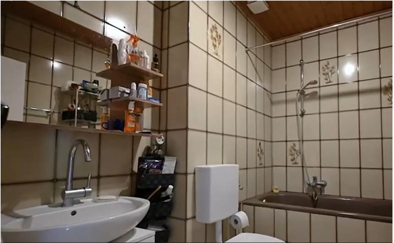
2.OG Bad links