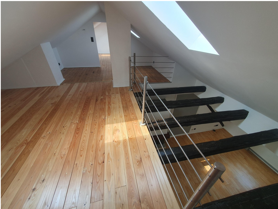
Dachg. rechts Spitzboden