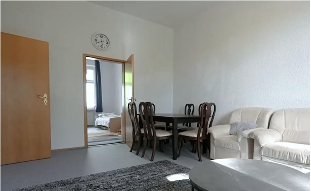
2.OG rechts, Zimmer