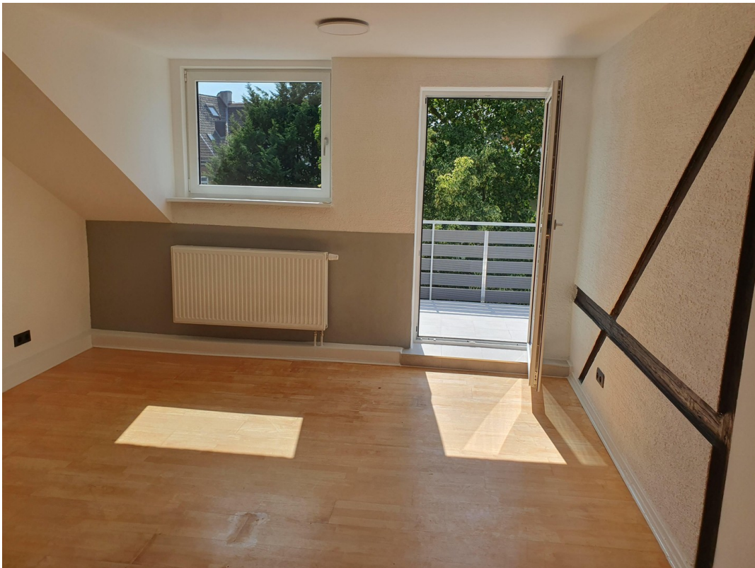
Wohnung Dachg. rechts