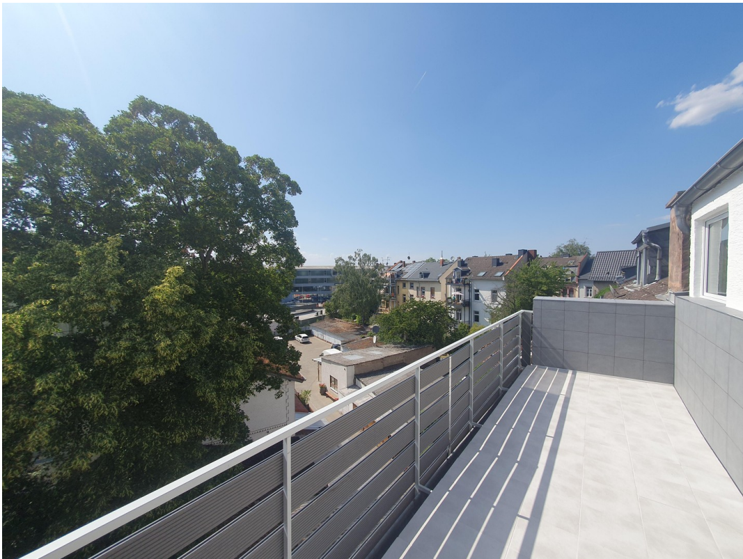
Wohnung Dachgeschoss rechts