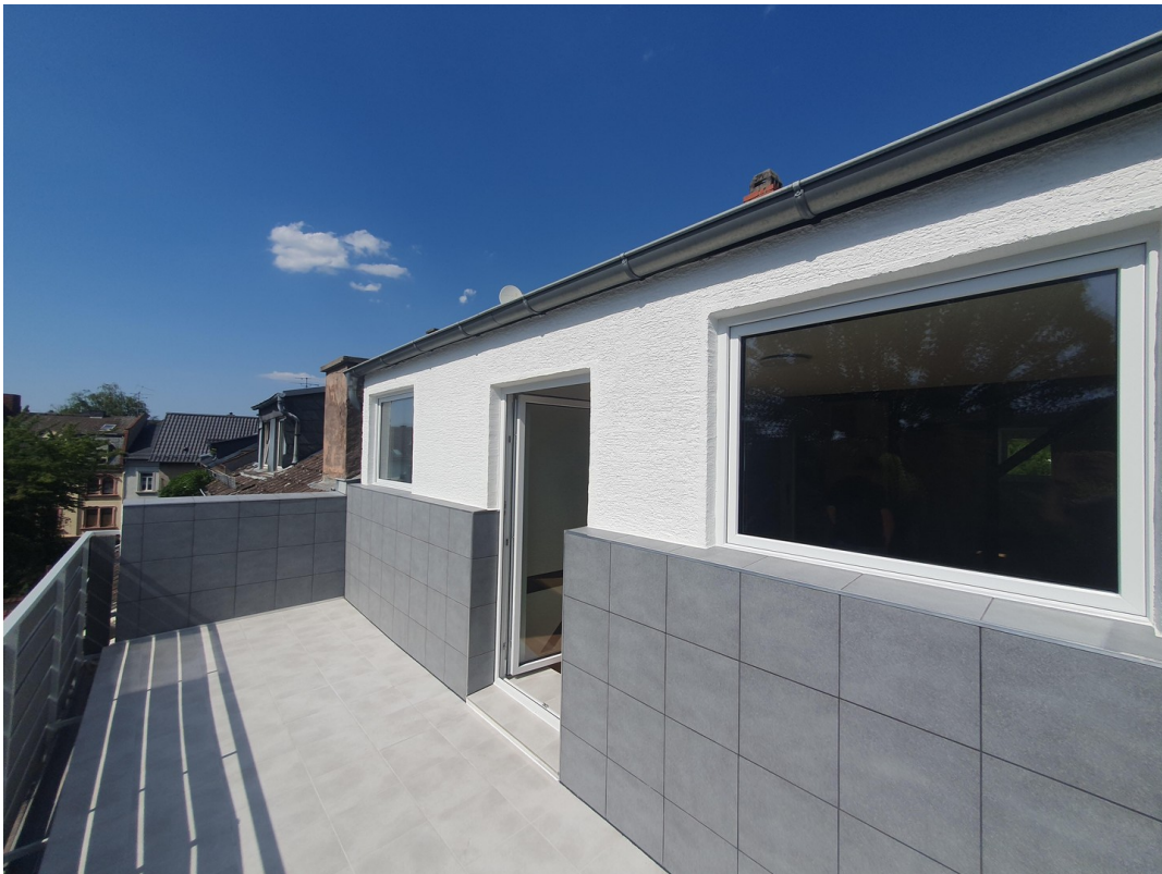
Wohnung Dachgeschoss rechts