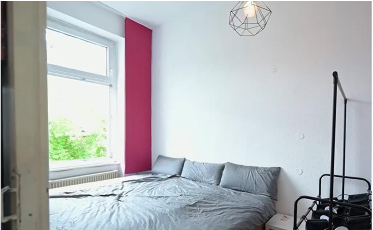
2.OG links, Zimmer