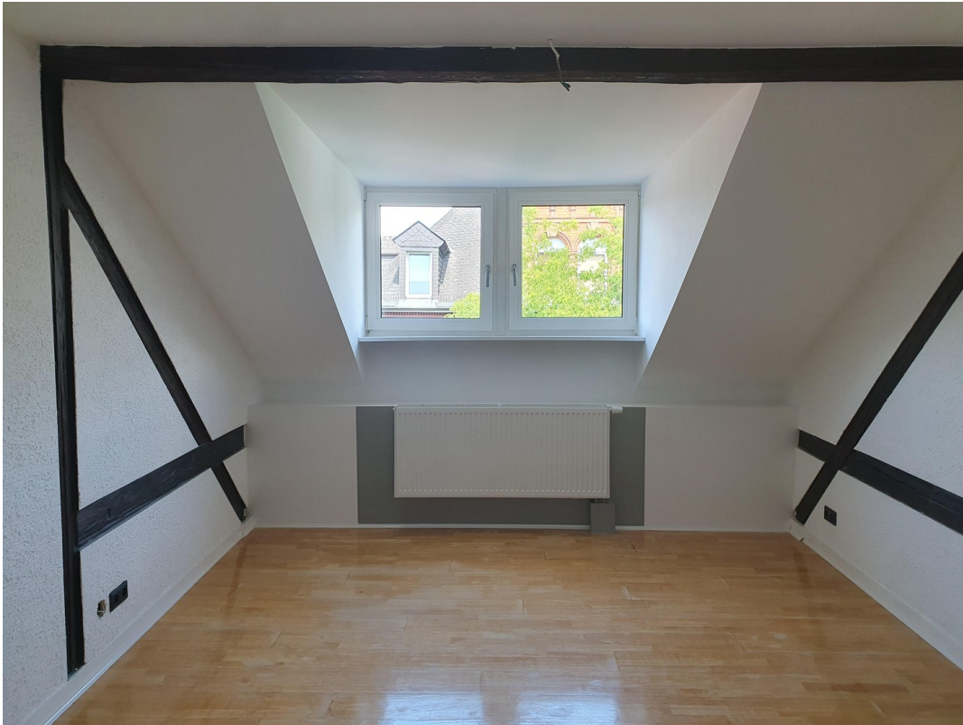
Wohnung Dachgeschoss rechts