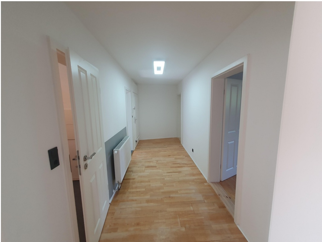
Wohnung Dachgeschoss rechts